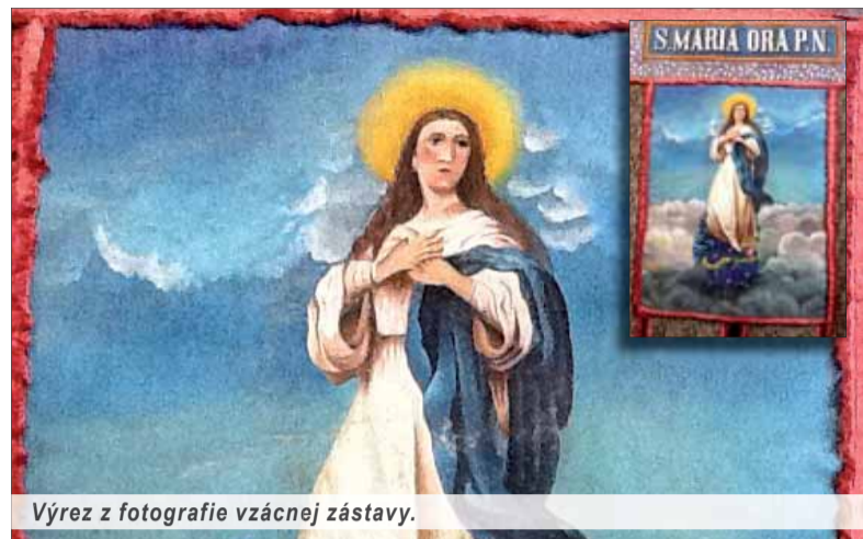
Výrez z fotografie vzácnej zástavy.