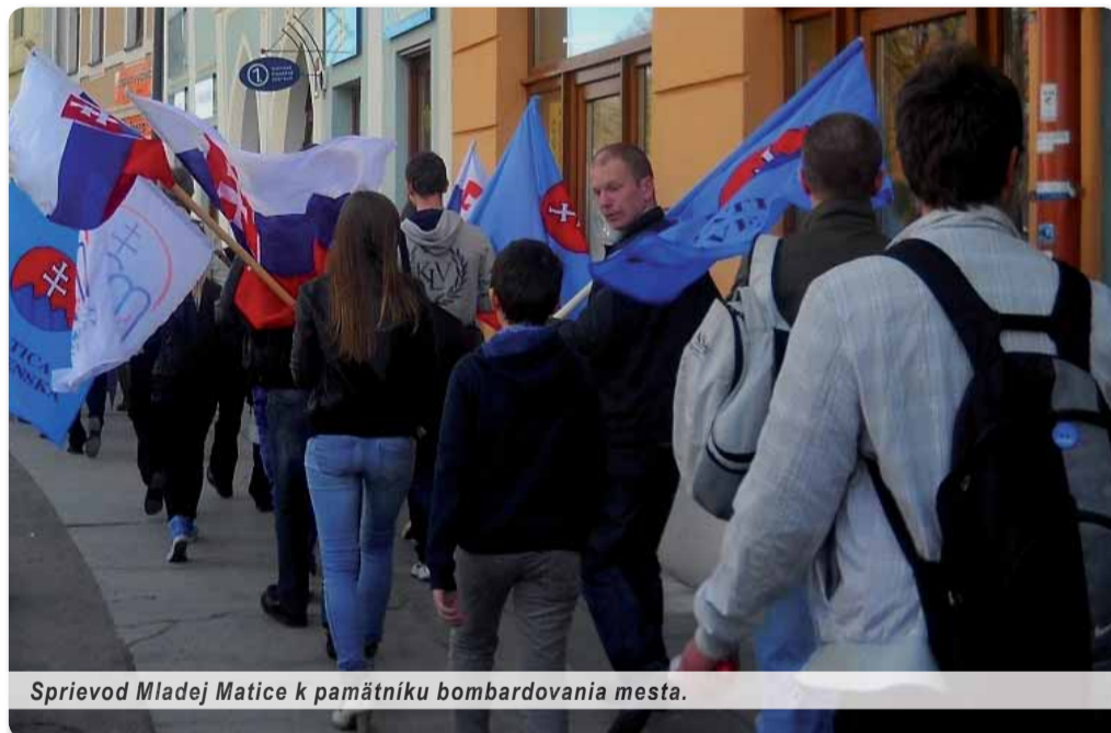
Sprievod Mladej Matice k pamätníku bombardovania mesta.