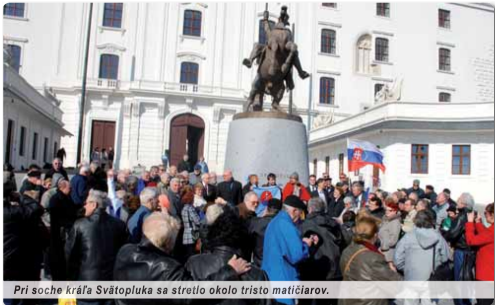
Pri soche kráľa Svätopluka sa stretlo okolo tristo matičiárov.