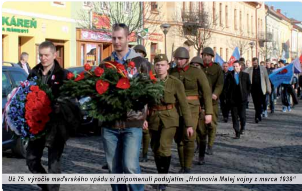
Už 75. výročie maďarského vpádu si pripomenuli podujatím „Hrdinovia Malej vojny z marca 1939“