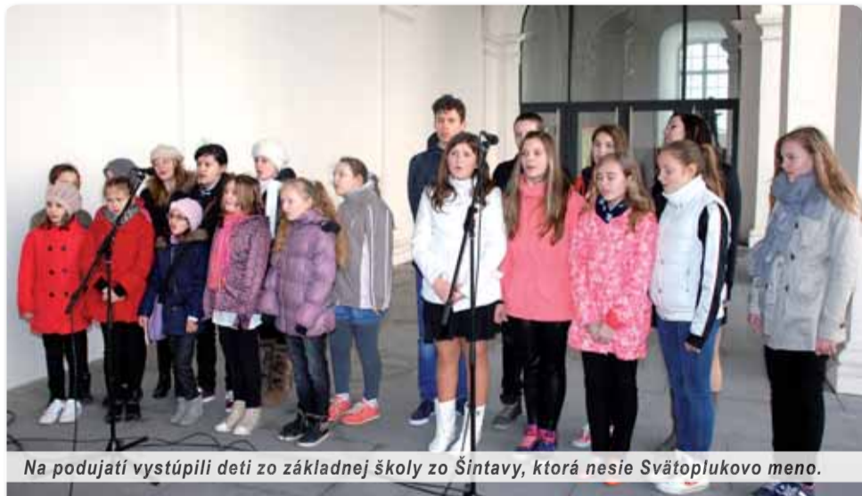
Na podujatí vystúpili deti zo základnej školy zo Šintavy, ktorá nesie Svätoplukovo meno.