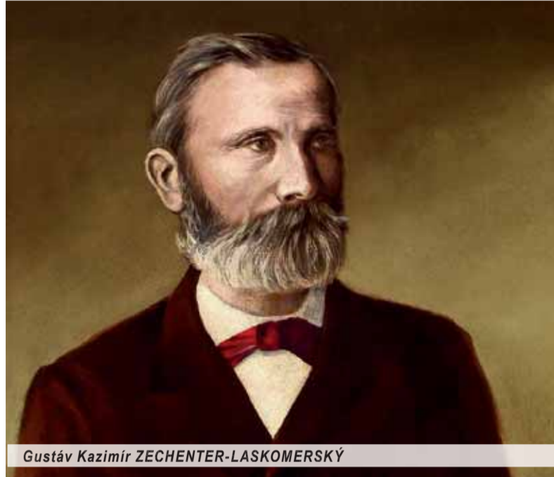
Gustáv Kazimír ZECHENTER-LASKOMERSKÝ