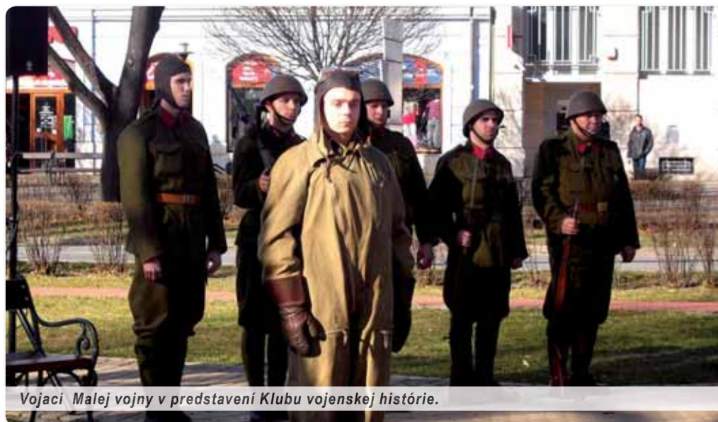
Vojaci Malej vojny v predstavení Klubu vojenskej histórie.