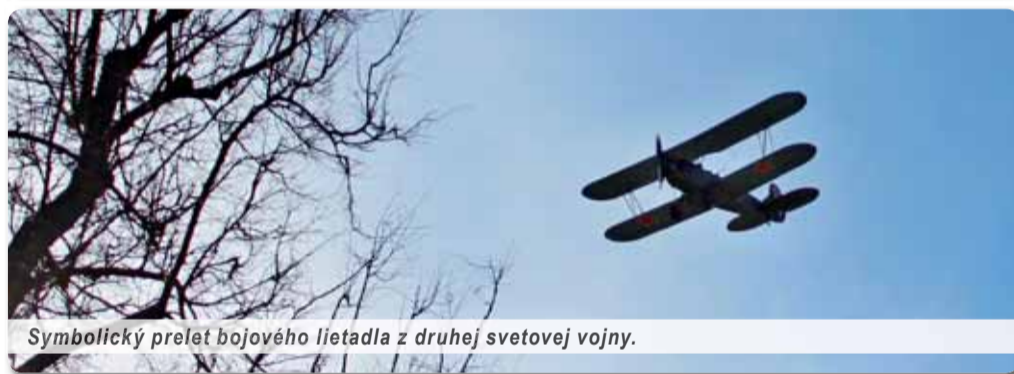
Symbolický prelet bojového lietadla z druhej svetovej vojny.