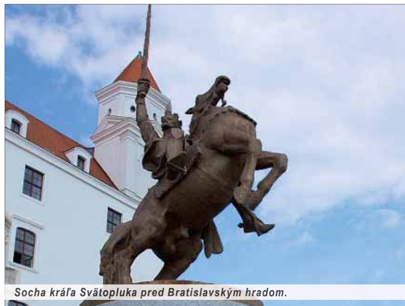
Socha kráľa Svätopluka pred Bratislavským hradom.