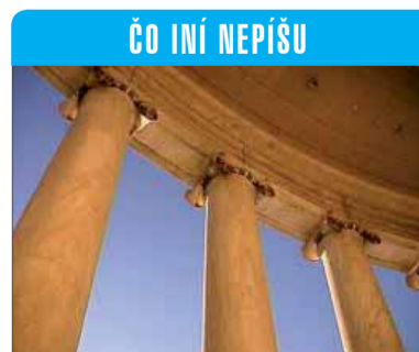
ČO INÍ NEPÍŠU

sume ako životné minimum – dostane na „odchodnú“ do dôchodku okolo 223 eur. A to ešte veľmi pravdepodobne okrem odvodov platil občas aj dane – ak sa mu darilo „kapitalisticky“ neprimerane prekročiť povolený