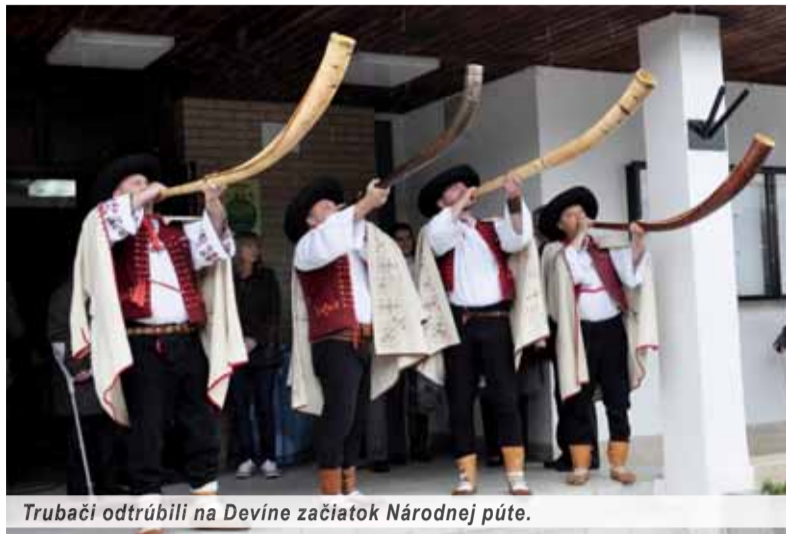
Trubači odtrúbili na Devíne začiatok Národnej púte.