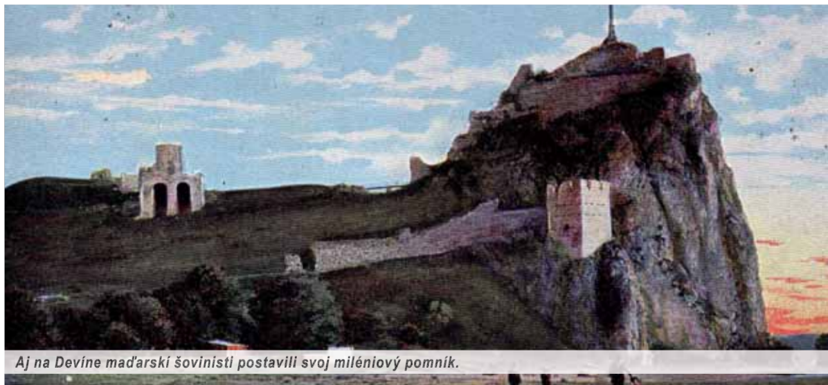
Aj na Devíne maďarskí šovinisti postavili svoj miléniový pomník.