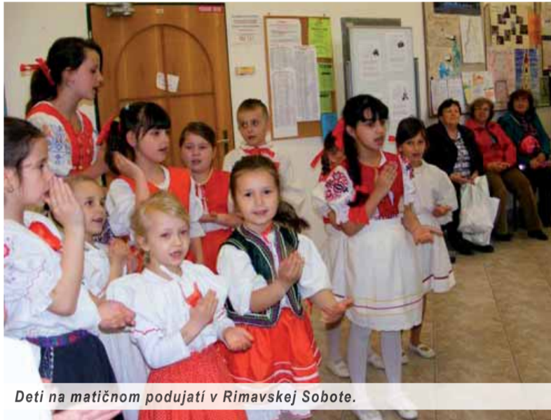
Deti na matičnom podujatí v Rimavskej Sobote.

Študenti a pedagógovia Evanjelického bilingválneho gymnázia v Tisovci v pondelok 14. apríla 2014 privítali vo svojich priestoroch lektorov a zručných majstrov remeselníkov, ktorí v rámci výchovnovzdelávacieho procesu bližšie priblížili slovenské ľudové tradície, remeslá a ľudovú slovesnosť, jej stopy a vplyv na umelú literatúru.