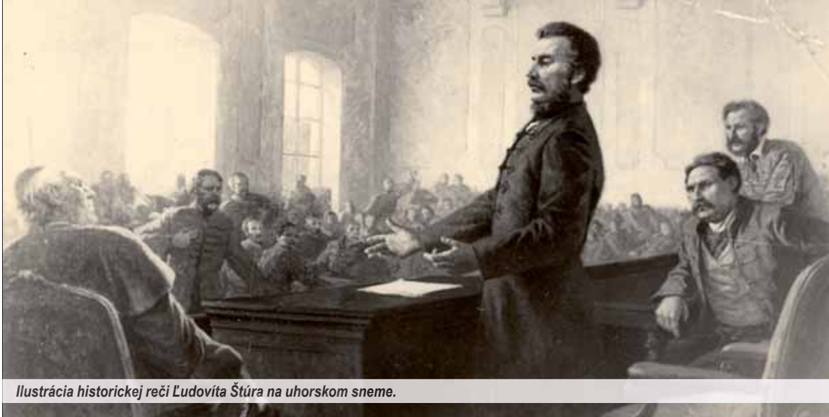
Ilustrácia historického reči Ľudovíta Štúra na uhorskom sneme.

Verejný výstup na posvätné pôde Devína je zaväzujúce, ak je témou slovenský vizionár Ľudovít Štúr. Vstupenie má zmysel len vtedy, ak sa budeme zamýšľať o presahu Štúrových skutkov a odkazu Devína pre dnešok. Porozmýšľam nahlas: čím by sme boli bez Štúra? Aj dnes zostáva veľkou výzvou jeho triáda, ktorú si sám vysníval a aj sám uskutočnil.