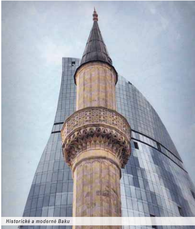
Historické a moderné Baku

Na začiatku tohto mesiaca bola v reprezentačných priestoroch Ministerstva kultúry Slovenskej republiky otvorená inšpiratívna výstava fotografií, predstavujúca krajinu nafty, zlata, železa, bavlny a kaukazského spiritualizmu – Azerbajdžan. Výstavu pripravila Európsko-azerbajdžanská spoločnosť už v roku 2012 a po prezentáciách vo veľkých európskych mestách ju inštalovali aj na Slovensku.