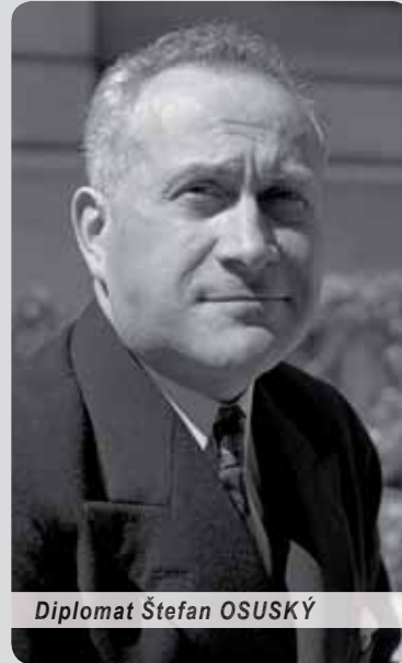
Diplomat Štefan OSUSKÝ

Svätoslav MATHÉ – Foto: internet; zdroj: sk.wikipedia.org