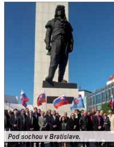
Pod sochou v Bratislave.