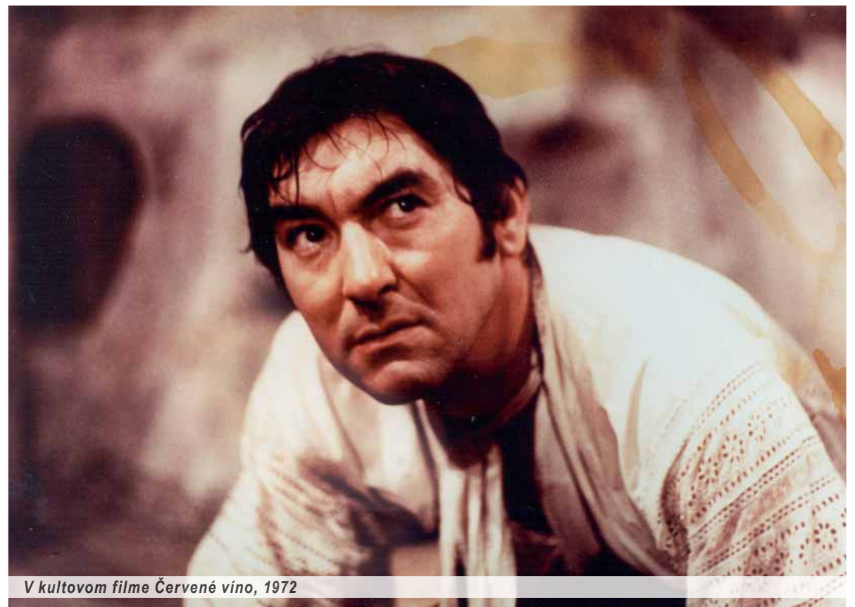
V kultovom filme Červené víno , 1972