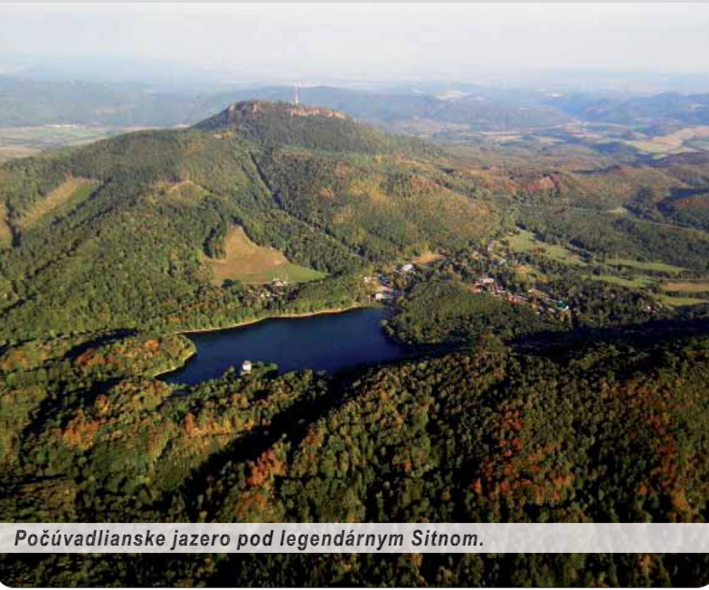
Počúvadlianske jazero pod legendárnym Sitnom.

Pojem Sitno sa zvykne prezentovať aj ako skrátený názov horského krajinného podcelku Štiavnických vrchov – Sitnianskej vrchoviny. Jej reliéf sa vyznačuje silnou koreláciou a odolnosťou hornín. Predstavuje dva typy krajiny: zalesnenú s riedkym osídlením a brázdotú s mestským osídlením, vrátane priemyselno-komunikačnej a poľnohospodárskej funkcie. Lákavé je všetko – vrch Sitno s neprebudenými rytmami i ako priama brána do pekla, Počúvadlianske jazero, okolité tajchy, a samozrejme i Banská Štiavnica so zápisom vo svetovom dedičstve UNESCO.