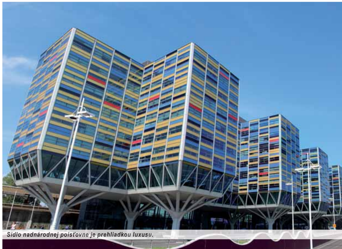
Sídlo nadnárodnej poisťovne je prehliadkou luxusu.

My si vyberáme tú dobrú. Slovensko vyhralo arbitráž v spore s holandskou poisťovňou Achmea, akcionárom Union zdravotnej poisťovne, pre plány vytvoriť jednu štátnu zdravotnú poisťovňu. Achmea by mala Slovensku zároveň zaplatiť vyše milión eur za právnikov. „Arbitrážny tribunál konštatoval, že koncept a implementácia verejného zdravotného poistenia je plne v rukách štátu. Zároveň uviedol, že tribunál nemá právo zasahovať do demokratického procesu suverénneho štátu a nemá právomoc rozhodovať o spore,“ vyjadril sa v reakcii Tlačový odbor Ministerstva financií SR (MF SR).