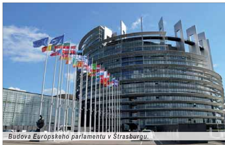
Budova Európskeho parlamentu v Štrasburgu.

Slovenský a zároveň európsky rekord v nízkej účasti v eurovoľbách zaujal zahraničie od Európy, Číny, Ruska až po USA. Nie ako čierna diera, ale ako pasívne vysvedčenie europolitike – ako veľký červený výkričník. Nebol to slovenský posun k protieuropanstvu ako vo Francúzsku, vo Veľkej Británii, ale aj v Maďarsku, ktoré lovilo voličov aj na južnom Slovensku, zásluhou čoho SMK získala kreslo v europarlamente. Protieuropsky volič pribudol aj v Nemecku a v Španielsku.