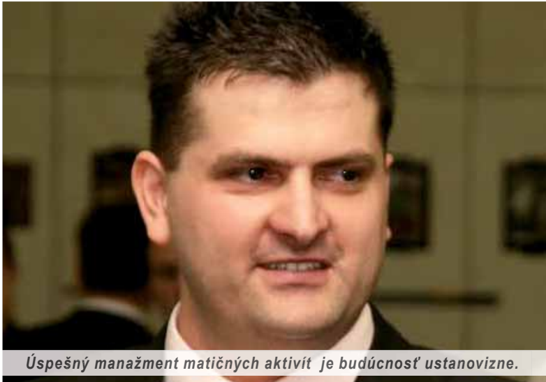
Úspešný manažment matičných aktivít je budúcnosť ustanovizne.

Treba úprimne a na rovinu povedať, že Dom MS v Komárne dnes existuje len vďaka Dramaťákovi. Jednak nám spravil meno fakticky po celom Slovensku a vďaka tomu, že si v dome prenajal priestory na nácvik, pomohol domu zaplatiť dlh, ktorý vznikol na vykurovaní. Muzikál Snehulienka a zopár trpaslíkov, ktorý úspešne uvádza, bude mať v Komárne za chvíľku sedemnásť repríz (premiéra bola v marci 2014) a vždy pred kompletne plným hľadiskom. Ani maďarské profesionálne divadlo, ktoré sídli v našom meste (k maďarskej národnosti sa hlási väčšina obyvateľstva), nemá toľko uvedení, repríz svojich hier. Či je to trvalé, je naozaj ťažké povedať. Takýto projekt stojí vyše štyridsaťtisíc eur, väčšinu peňazí musíme získať sponzorsky. Zatiaľ sa nám prostriedky darí zhŕňať, ale je to nesmierne náročné. Pokiaľ ide o záujem zo strany hercov, resp. tanečníkov, tak okrem dvadsiatich ôsmich aktívnych členov evidujeme asi šesťdesiat žiadostí. Ak sa nič mimoriadne nestane, v septembri urobíme konkurz. Záujem je aj o náš folklórom motivovaný súbor Slovenskí rebeli, počas tohto leta máme naplánovanú návštevu jedného svetového a jedného európskeho festivalu. Súbor má tri generácie, úplne úplne malé deti, ktoré sa fakticky len hrajú, školákov, čo je prí-