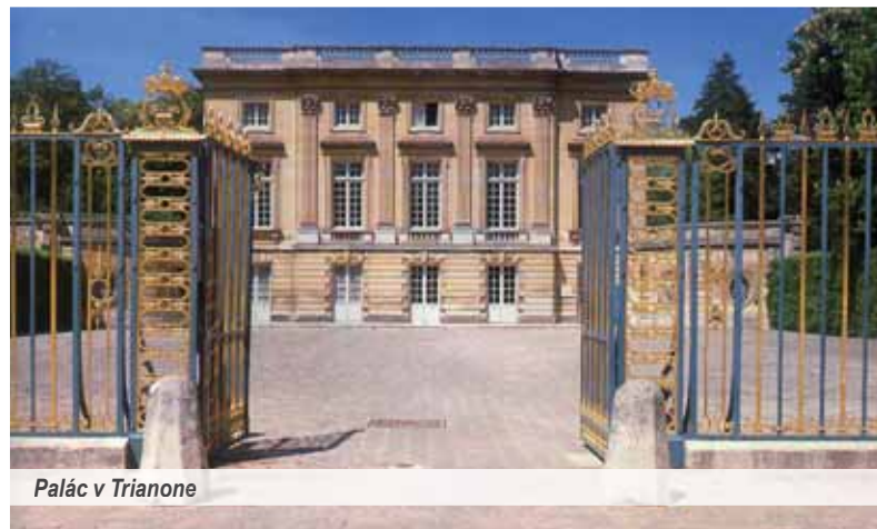
Palác v Trianone