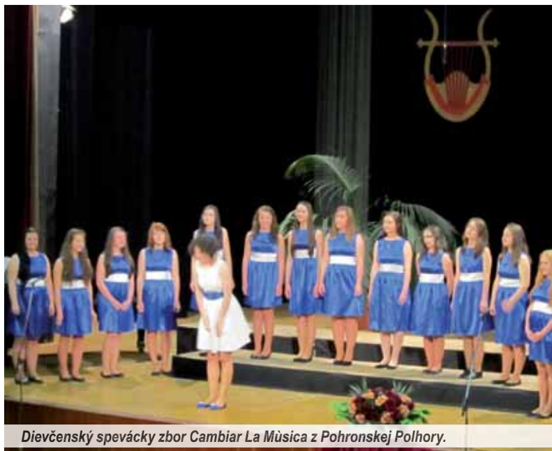
Dievčenský spevácky zbor Cambiar La Música z Pohronskej Polhory.

Hlavný rozkvet zborového spevu sa podľa niektorých prameňov datuje do rokov 1978 až 1995. Prá-