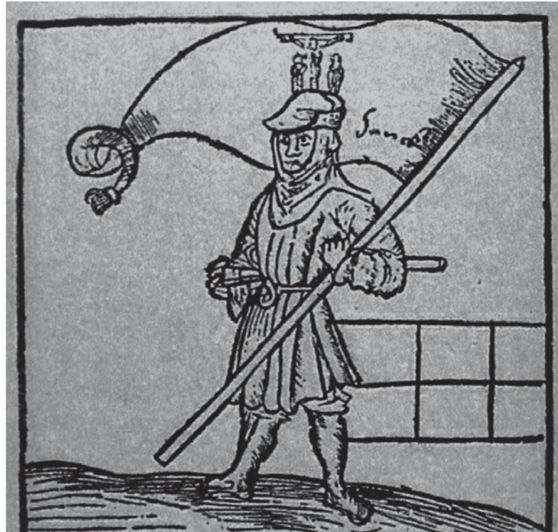
Dóžov križiak na dobovom letáku

Práve to viedlo poddaných, aby sa sťahovali na „voľnú“ zem. Šľachta však takejto rozsiahlej migrácii zamedzila presadením zákona obmedzujúceho slobodu sťahovania poddaných. Priame nebezpečenstvo predstavovala v tom čase najmä Osmanská ríša, ktorej obnovená vojenská expanzia trvalo a dlhodobo ohrozovala uhorské pohraničné pevnosti. Turecké nebezpečenstvo však viacerí podceňovali a jeho hrozbu nepokladali za reálnu.