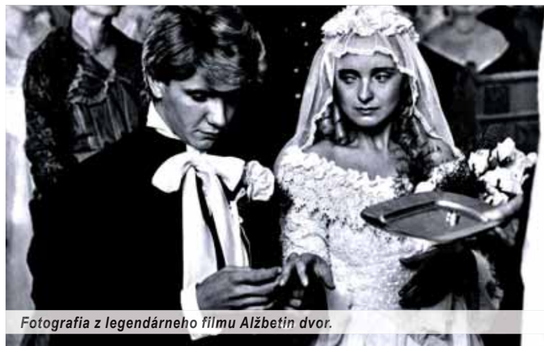
Fotografia z legendárneho filmu Alžbetin dvor.

a vydavateľskej práci v Košiciach, Prešove a Bratislave, kde sa začiatkom päťdesiatych rokov minulého storočia natrvalo presťahovala. S výnimkou desaťročného zákazu verejného publikovania ponúkala svojim dospelým i detským čitateľom podnetnú a pútavú literatúru. V jej repertoári nachádzame pohľady do osudov dospievajúcich ľudí, života mladých žien, horaliek, turčianskych a liptovských rodov, ako aj beletrizované memoáre, sondy do života v domove dôchodcov, sídliskového sveta mestských detí, maturantov či starého manželského páru, mladej rodiny, no aj tému zákulisia parlamentnej praxe, ku ktorému „pričuchla“ v rokoch 1990 – 1992 ako poslankyňa Slovenskej národnej rady. Spiso-