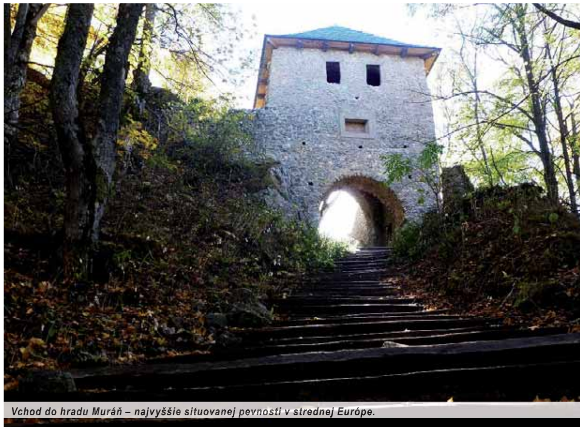
Vchod do hradu Muráň – najvyššie situovanej pevnosti v strednej Európe.

Slováci to mali oddávna ťažké. Poddaný musel šľachte dorábať všetko na jej bezstarostný život. Krajom sa preháňali divé hordy z ázijských a povolžských stepí, ktoré sa hradom a zámkom poväčšine vyhýbali, ale v nevoľníckych osadách brali so sebou všetko, a čo zostalo, ľahlo popolom. Tiahli tadiaľto hladné vojská stavovských povstaní, nenávisťou zaslepení husiti, nemilosrdní tureckí nájazdníci..., k tomu všetkému ešte aj cholera, mor, záškrt, tubera, pálenka. A na mnohých miestach trápili ľudí ešte aj lúpežní rytieri.