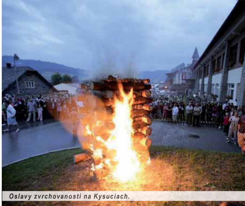
Oslavy zvrchovanosti na Kysuciach.

Deň prijatia Deklarácie Slovenskej národnej rady o zvrchovanosti Slovenskej republiky si pripomínáme ako deň, keď sme sa stali svojstojným národom. Druhý polrok posledného roku spoločného štátu Čechov a Slovákov zaznamenal formálne štátoprávne kroky, ktoré viedli k vzniku Slovenskej republiky ako skutočne plnoprávneho subjektu medzinárodného práva.