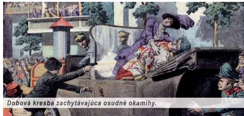
Dobová kresba zachytávajúca osudné okamihy.

Aj storočnica atentátu na následníka trónu poodhalila problémy, s ktorými je konfrontovaná Bosna a Hercegovina, a koľko bude treba vynaložiť úsilia, aby bol spoločný život opäť možný, ak je vôbec možný.