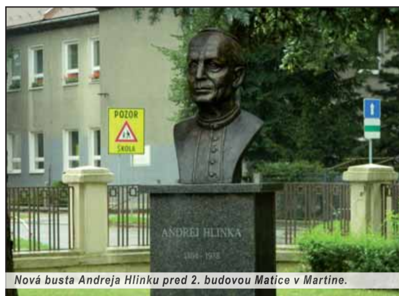
Nová busta Andreja Hlinku pred 2. budovou Matice v Martine.

Členovia výboru kriticky diskutovali o Správe o činnosti a hospodárení za rok 2013, v ktorej sa uvádza o rozpustení rezervných fondov na úrovni niekoľko stotisíc eur. Predseda dozorného