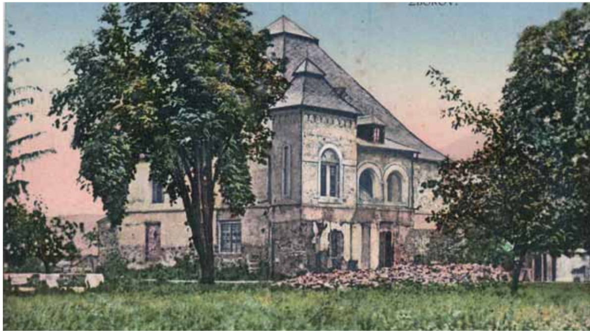
Serédiiovský kaštieľ (1924)

V tejto tak trochu geografickej exkurzii chcem opísať spolupôsobenie dvoch škodlivín – Česko-Slovenska a komunizmu – v Zborove, kedysi malebnej obce na východnom Slovensku, odkiaľ pochádzam. Popod na napísanie vznikali postupne pri mojich cestách za koncertmi najmä po Morave. Hneď skraja musím povedať, že na Moravu či do Čiech chodím rád koncertovať, sú tam skvelé kluby a úžasní ľudia, ktorí vedia oceniť aj trochu inú muziku, ako sa teraz rinie z rádií.