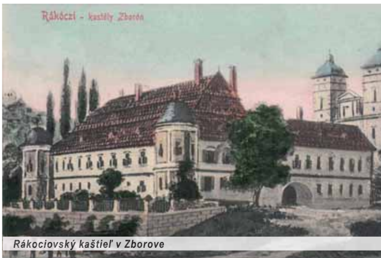
Rákociovský kaštieľ v Zborove

Pred prvou svetovou vojnou bol Zborov jeden zo skvostov na mape Šariša. Bol tam rákociovský kaštieľ s renesančným Kostolom sv. Žofie, sirmajovský kaštieľ, čarovná storočná lípová aleja, sirmajovská hrobka, serédiiovský kaštieľ, neodmysliteľný barokovo prestavaný kostol s gotickými základmi, pekná budova Kresťanského potravného družstva a nechýbala ani synagóga s rituálnymi kúpeľmi. No prišla pohroma s názvom prvá svetová vojna, keď stálo pár dní marca 1915 a spoločnými silami rakúsko-uhorského a ruského delostrelectva obec prakticky ľahla popolom. Artiléria a následné útoky jednotiek jednej i druhej strany zničili asi tristoštyridsať domov a Podhradie bolo prakticky zrovnané so zemou.