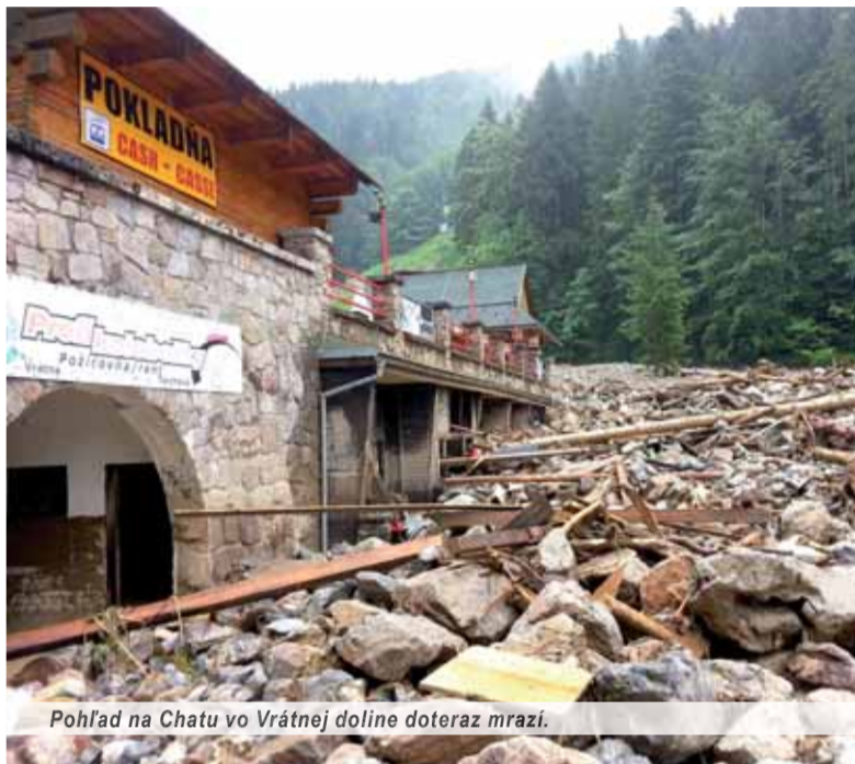
Pohľad na Chatu vo Vrátnej doline doteraz mrazi.

Podľa údajov hydrometeorologického ústredia napadlo v pondelok 21. júla na veľkej ohraničenej ploche v Žiline a v jej bezprostrednom okolí za hodinu a pol až šesťdesiatpäť milimetrov zrážok, čo sa blíži k storočnej vode. Prietrž mračen narobila veľké problémy priamo v krajskom meste, znefunkčnila dopravu, uvážnila v horskom teréne niekoľkých výletníkov, ale najviac škôd spôsobila prívalová vlna, ktorá sa prehnila Vrátnou dolinou. Takto sme v minulom čísle SNN informovali o prírodnej katastrofe, ktorá zničila turistickú i dopravnú infraštruktúru a spôsobila obrovské škody.