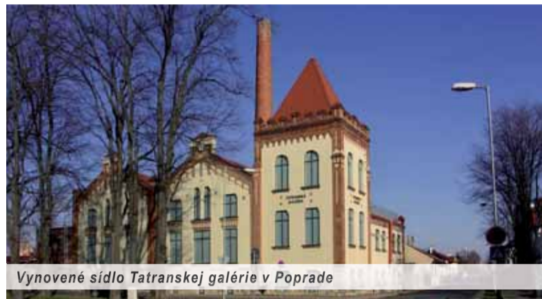
Vynovené sídlo Tatranskej galérie v Poprade

Najstaršie združenie výtvarných umelcov u nás – Umelecká beseda slovenská – stojí na prahu ďalšieho z významných jubileí. O pár mesiacov uplynie dvadsaťpäť rokov od obnovenia činnosti tohto spolku. UBS sa však sformovala už v roku 1921 ako zrkadlový odraz staršej Umeleckej besedy pražskej a jej prvým predsedom i starostom bol architekt Dušan Jurkovič. Už v znamení štvrtstoročného jubilea, ale najmä ako hold sedemdesiatemu výročiu SNP pripravili v Umeleckej besede slovenskej spoločne s vedením Tatranskej galérie v Poprade spoločný výstavný projekt nazvaný Sondy a reflexie, ktorý predstavia 8. augusta vo výstavných priestoroch TG Elektrárne na Hviezdoslavovej ulici.