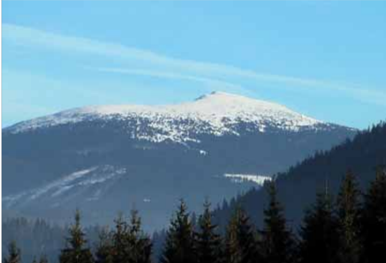
Masív Babej hory

Nie náhodou sa masívu Babej hory hovorí aj diabolský. Prírovnanie podľa všetkého pochádza zo skúsenosti s častými a rýchlymi zmenami poveternostných podmienok. V rezervácii sa vyskytujú viaceré vzácne rastliny. Rožec bábahorský rastie len na tomto mieste. Okolie návštevníkom približujú vysvetlivky na paneloch náučného chodníka pozdĺž trasy. Cesta späť smeruje po červeno a modro označenom chodníku. Tiahne sa popri štátnej hranici na severozápad s klesaním do sedla Brána (1 410 metrov). Zaberie asi trištvrte hodiny. Po nej nasleduje stúpanie po modrej značke na predvrchol Malej Babej hory (1 515 metrov). Červená značka ešte v sedle opúšťa Slovensko a sig-