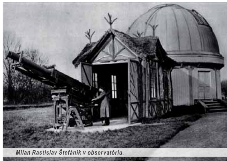
Milan Rastislav Štefánik v observatóriu.

Štefánik pil rád dobrou kávu. Nemuselo jí být mnoho, ale musela být dobrá. K dobré kávě patří však, jak znám, dobrý cukr. Protože se však v Paříži tenkrát sladilo sacharinem, vrtěl sebou Štefánik neklidně v židli po každé, když mu přinesli po obědě sacharinovanou kávu. A tu jsem pomohl já: měl jsem dobré kamarády u americké jízdy. Ti měli cukru dost a mohl jsem tudíž vypomáhat Štefánikově kávě. Tím jsem si získal také nějaké zásluhy při budování československého státu. Ptáte se asi, jak to. Vysvětlím vám to tedy, jak jsem to vysvětlil svého času panu ministru zahraničí. Řekl jsem mu: republiku spolubudovaly Štefánikovy dobré nápady. K dobrým nápadům potřeboval dobrou kávu. K dobré kávě potřeboval cukr. Ten cukr jsem mu dával já. Tudíž... A pan ministr souhlasil.“