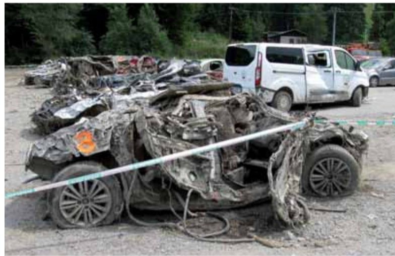
Keď príroda ukáže svoju silu, auto vyzerá ako pokrčený papier...