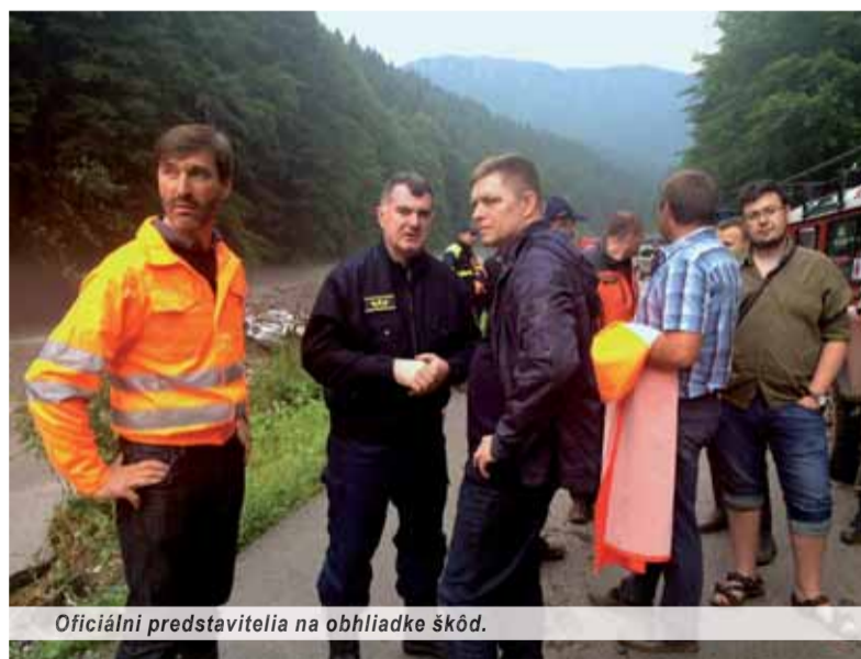
Oficiálni predstavitelia na obhliadke škôd.

Už v podvečerných hodinách onoho dňa sa v médiách objavujú flešové správy: „Popoludní zasiahla sever Slovenska silná búrka. Voda napáchala škody predovšetkým v Žiline a okolitých obciach, na Kysuciach a Orave. Storočnú vodu hlásili z Terchovej. Prívalový dažď a rozburýnený potok na viacerých miestach podmyli jedinou prístupovú cestu do doliny, voda vytrhla kusy asfal-