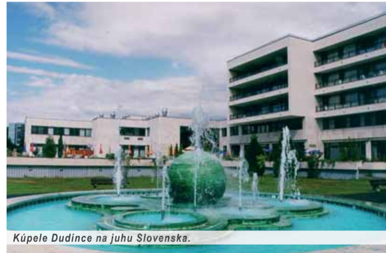
Kúpele Dudince na juhu Slovenska.

Jednými z najobľúbenejších a najdynamickejších sa rozvíjajúcich kúpeľov sú Bardejovské kúpele. Na prvé navštívenie očarí svojou polohou uprostred lesov plných turistick-