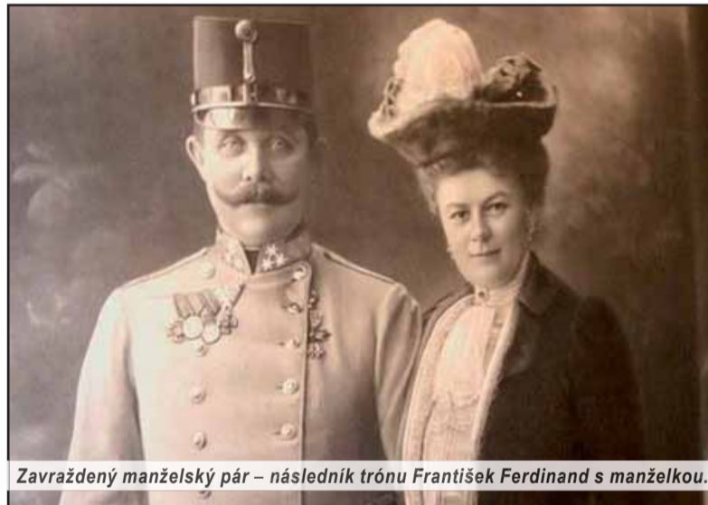
Zavraždený manželský pár – následník trónu František Ferdinand s manželkou.

V tejto súvislosti treba ešte uviesť, že v slovenskom prostredí sa často objavuje téza o tom, že atentát zmaril nádeje, ktoré pre slovenský národ a ďalšie utláča-