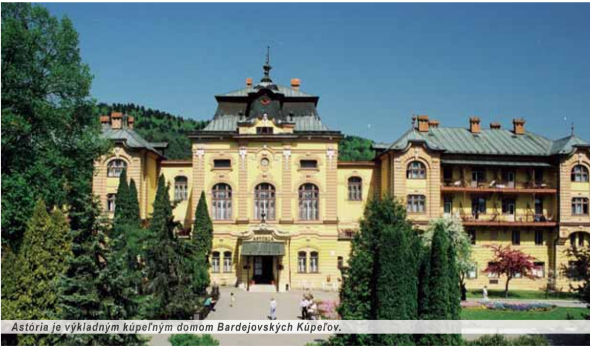
Astória je výkladným kúpeľným domom Bardejovských Kúpeľov.

Dlhodobou aktuálnym letným dovolenkovým trendom je zbalit si kufre, sadnúť do lietadla či auta(busu) a stráviť nejaký čas na plážach a spol. pri mori. Nič proti tomu, no ponúka sa nám vynikajúca alternatíva v podobe inej vody. U nás doma... Skôr Slovensko je krajina bohatá na mnohé prírodné krásy, ktoré nám často závidia celý svet a sú každoročne lákadlom pre množstvo turistov zo zahraničia, ale (samozrejme!) i pre našincov.