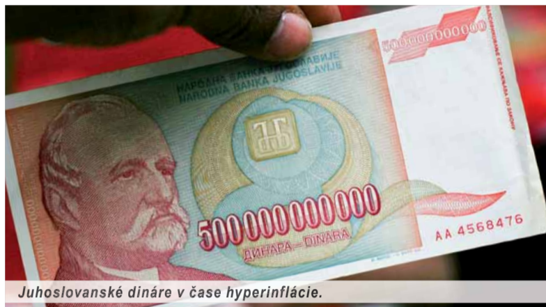
Juhoslovanské dináre v čase hyperinflácie.

Tibor B. HAČKO – Foto: zdroj: financnitrži.com