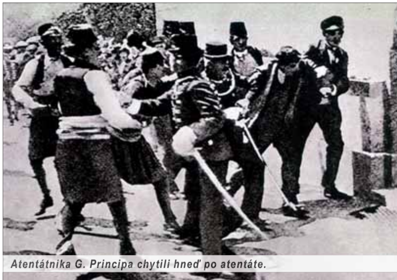
Atentátnika G. Principa chytili hneď po atentáte.

K atentátu došlo na deň sv. Víta (po srbsky Vidovdan), výročie tragickej bitky na Kosovom poli, čo je najvýznamnejší srbský národný sviatok. Smrťou následníka trónu a jeho manželky sa tragicky, predčasne skončila inšpekčná cesta a predchádzajúce manévry rakúsko-uhorskej armády v Bosne a Hercegovine, ktorú rakúsko-uhorská monarchia anektovala v roku 1908. Vojské cvičenia v blízkosti srbských hraníc, ukončené návštevou Sarajeva v deň sv. Víta, mali jasne demonštratívny, provokačný náboj zameraný proti Srbsku, ktoré sa nechcelo zmieriť s okupáciou a neskôr anexiou Bosny a Hercegoviny. Srbsko totiž Bosnu a Hercegovinu, kde Srbi v tom čase ešte