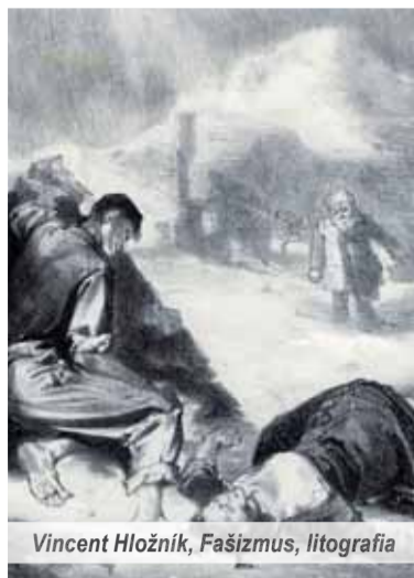
Vincent Hložník, Fašizmus, litografia

Aj keď v uplynulých rokoch prešlo tohto občianske združenie komplikovaným vývojom pri