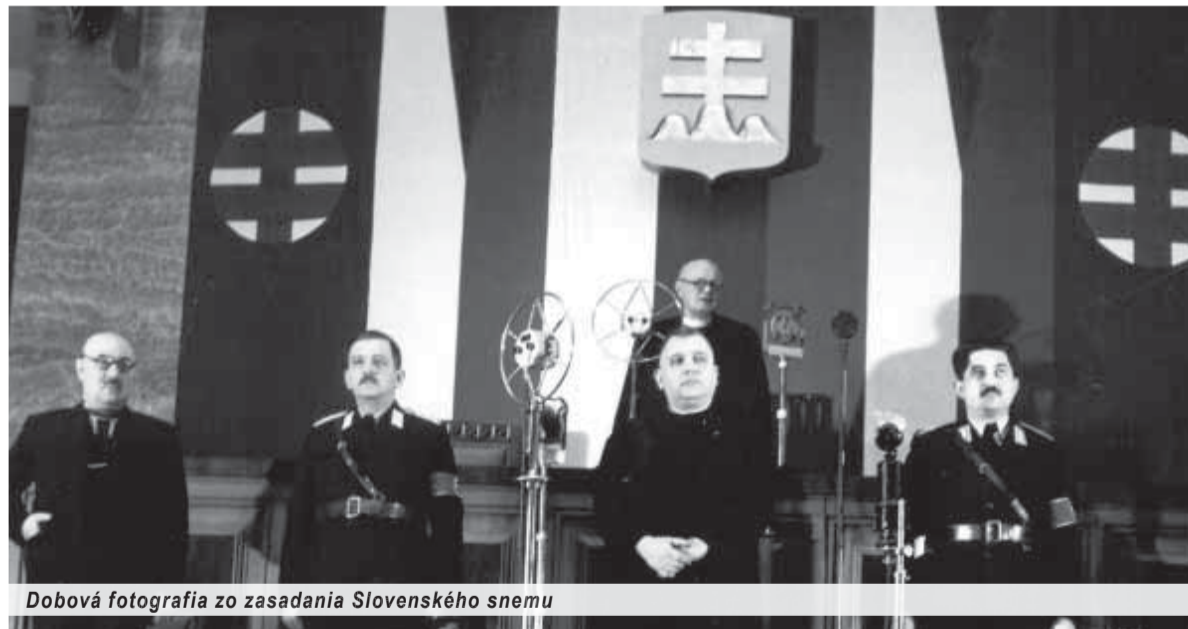
Dobová fotografia zo zasadania Slovenského snemu

Anton HRNKO: Prvá Slovenská republika nepochybne zohrala kľúčovú úlohu v moderných dejinách slovenského národa – so všetkými svojimi kladmi i zlyhaniami. Obnovený čechoslovakistický režim po roku 1945, ale najmä po roku 1948 znemožnil Slovákom vyrovnáť sa so svojimi zlyhaniami v rokoch vojny s jasným cieľom zlomiť ich vôľu po samostatnom, osobitom národnom a štátnom živote. Slováci si nemali svoje dejiny vykladať, ale mali nimi byť bičovaní, čo sa s určitými prestávkami robí od konca vojny dodnes. Preto sme sa s našimi dejinami stále nevyrovnali, a preto nie sme schopní ani zhodnotiť pozitíva, ktoré do národného života vniesla síce oklieštená, znásilnená, ale predsa len aká-taká národná suverénita. Tento satelitný štát v nemeckej mocenskej sfére definitívne rozhodol vnútorne i medzinárodne bez akejkoľvek pochybnosti, že Slováci sú samostatný národ schopný si svoje veci spravovať sami. Potvrdil ekonomickú spôsobilosť Slovenska existovať ako samostatný ekonomický priestor. Vytvoril administratívno-mocenskú štruktúru riadenia Slovenska, ktorú už nikdy nebolo možné úplne eliminovať, a pokus, ktorý na začiatku šesťdesiatych rokov urobil A. Novotný, vlastne vyprovokoval situáciu, ktorá skončila obrodným procesom a federalizáciou Česko-Slovenska v roku 1968. A to nehovorím o hlbokéj brázdě, ktorú vyoral pri vytvorení profesionálnych vedeckých, kultúrnych a ďalších a ďalších národných inštitúcií. Dejiny nikdy nie sú jednofarebné, vždy majú mnohofarebné spektrum.