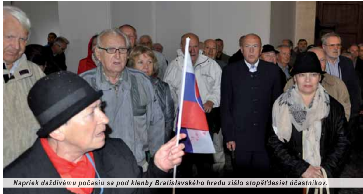
Napriek daždivému počasiu sa pod klenby Bratislavského hradu zišlo stopäťdesiat účastníkov.

Už po tretí raz sa 1. septembra zišli z iniciatívy Matice slovenskej vlastenci a matičíari na Bratislavskom hrade pri jazdeckej soche kráľa Svätopluka, aby slovom a piesňou oslávili Deň Ústavy Slovenskej republiky. Odznali inšpiratívne prejavy, umelecké slová aj národné hymnické piesne a kráľovi Svätoplukovi vzdali hold osobnosti nášho matičného i kultúrneho života.