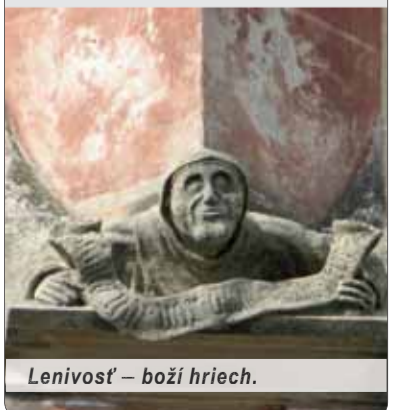
Lenivosť – boží hriech.