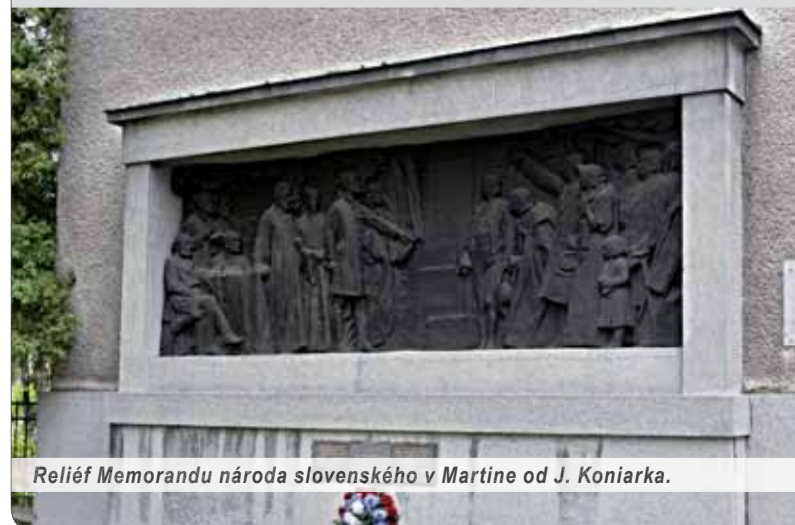
Reliéf Memorandu národa slovenského v Martine od J. Koniarka.

Umelec dal dielo odliatť v dielni vyhláseného pražského návrhára umeleckých a úžitkových predmetov Frantu Anýža. Reliéf slávnostne odhalili 6. júna 1935 na starostlivo pripravovanom Memorandumom námestí za účasti širokej verejnosti. Slávnostný prejav za Maticu predniesol Dr. J. Vanovič. Koniarkova kompozícia zachytáva skupinu ôsmich osnovateľov Memoranda, ktorých možno ľahko identifikovať, a na druhej strane zástupcov slovenského ľudu. Viacfigurálna scéna je zasadená do citlivo budovaného priestoru. Dielo predstavuje vrchol autorovej monumentálnej tvorby.