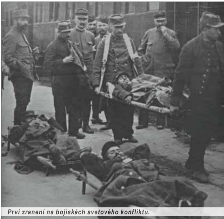
Prví zranení na bojiskách svetového konfliktu.

Storočnica sarajevského atentátu (28. jún 1914) umožní pripomenúť, že Milan Hodža bol poradcom v najužšom kruhu následníka trónu Františka Ferdinanda. Ten pripravoval federalizáciu monarchie, vrátane konkrétnej mapy so slovenskou časťou! Cieľom bolo po-