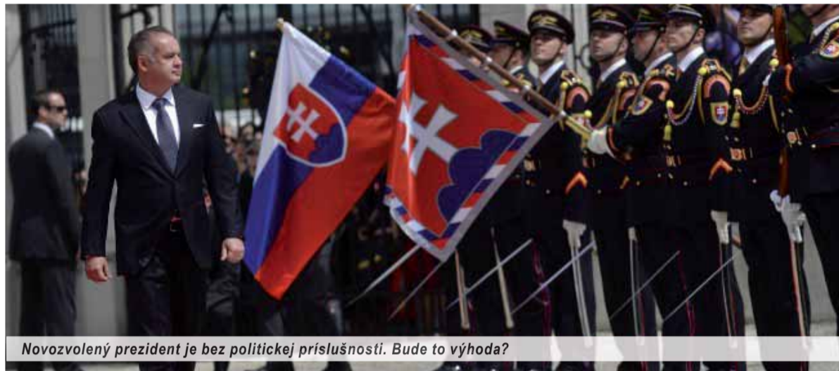
Novozvolený prezident je bez politickej príslušnosti. Bude to výhoda?

Rudolf Schuster, Michal Kováč, krátko zastupujúci a úradujúci prezident Vladimír Mečiar a Ivan Gašparovič. Dnes plejáda týchto prezidentov patrí už len do histórie samostatného Slovenska. Svetlejšej či temnejšej, to necháme na posúdenie dejinám. Občania sa v týchto dňoch venujú Andrejovi Kiskovi. „Myslím si, že pred Slovenskom sú také výzvy a každý deň prináša mnohým našim občanom také problémy, že v politike a medzi politikmi by nemalo byť miesto na osobné vojny alebo nepriateľstvo. Ako prezident sa pokúsim v tomto duchu vytvoriť vzťahy s vládou, s parlamentom a s politickými stranami,“ povedal v inauguračnom prejave.