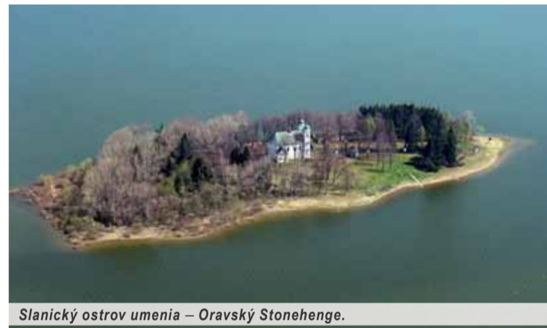
Slanický ostrov umenia – Oravský Stonehenge.