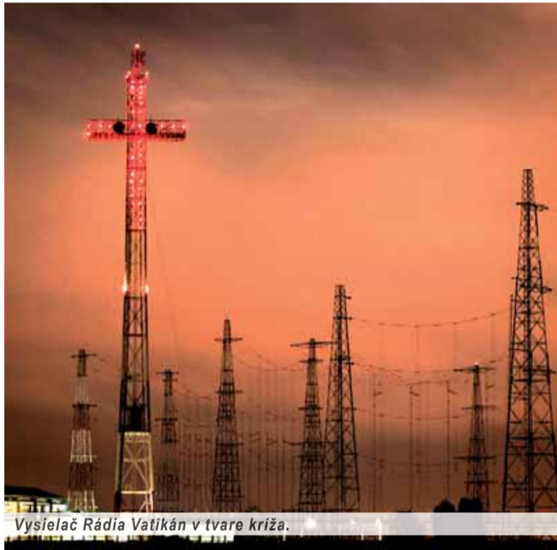
Vysielač Rádia Vatikán v tvare kríža.

Pravidelné slovenské vysielania sa začali o štyri roky neskôr 21.