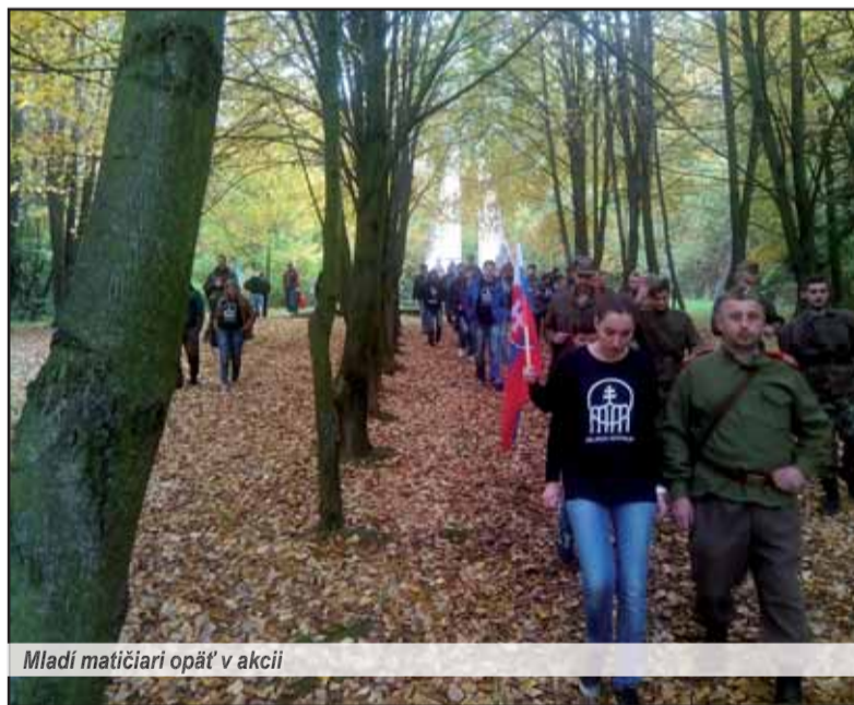
Mladí matičiari opäť v akcii