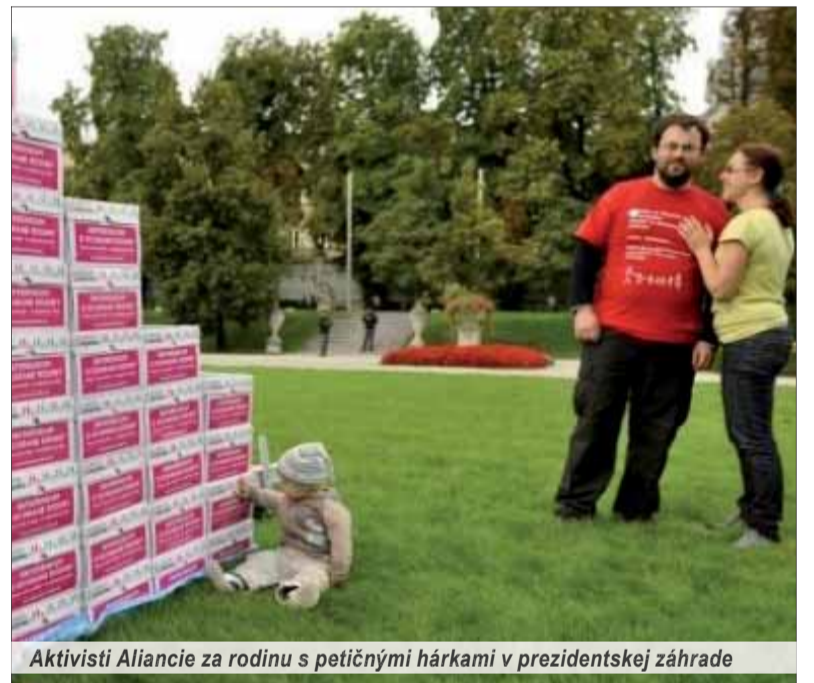
Aktivisti Aliancie za rodinu s petičnými hárkami v prezidentskej záhrade

Oklieštené referendum zrejme stroskotá. Je totiž predpoklad, že