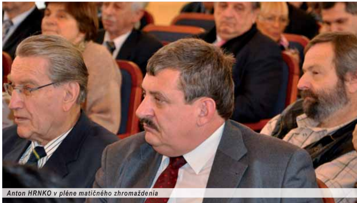
Anton HRNKO v pléne matičného zhromaždenia

V posledných rokoch nielen u nás, ale i v celej Európe mimoriadne klesla dôvera k politickým stranám. Nečudo, veď na politickú scénu sa stále viac a viac dostávajú rôzne obskúrne figúrky, ktoré by mali skôr zaplňať scény v kabaretoch, ako sedieť v poslaneckých laviciach. B. Grillo v Taliansku, N. Farage vo Veľkej Británii, T. Okamura v Česku, ale aj I. Matovič na Slovensku v parlamentných poslaneckých laviciach sú viditeľnými príznakmi krízy politických strán a s tým spojenou krízou politického systému západoeurópskych štátov.