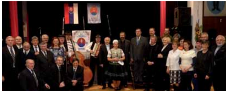
Novoročné stretnutie členov aktívnej matičnej organizácie v Rybníku