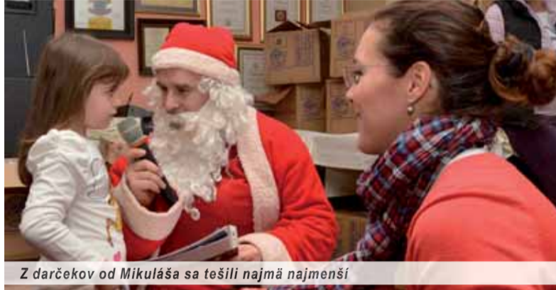
Z darčiekov od Mikuláša sa tešili najmä najmenší

Počas sviatku svätého Mikuláša zorganizoval spolok Čiernohorsko-slovenské priateľstvo (ČSP) podujatie Mikuláš v Podgorici 2014. Slávnostne vyzdobená miestnosť reštaurácie Ribnica v čiernohorskom hlavnom meste sa zaplnila do posledného miesta. Zišli sa v nej deti z viacerých čiernohorských miest ako Podgorica, Bar, Herceg Novi, Budva a Tivat.