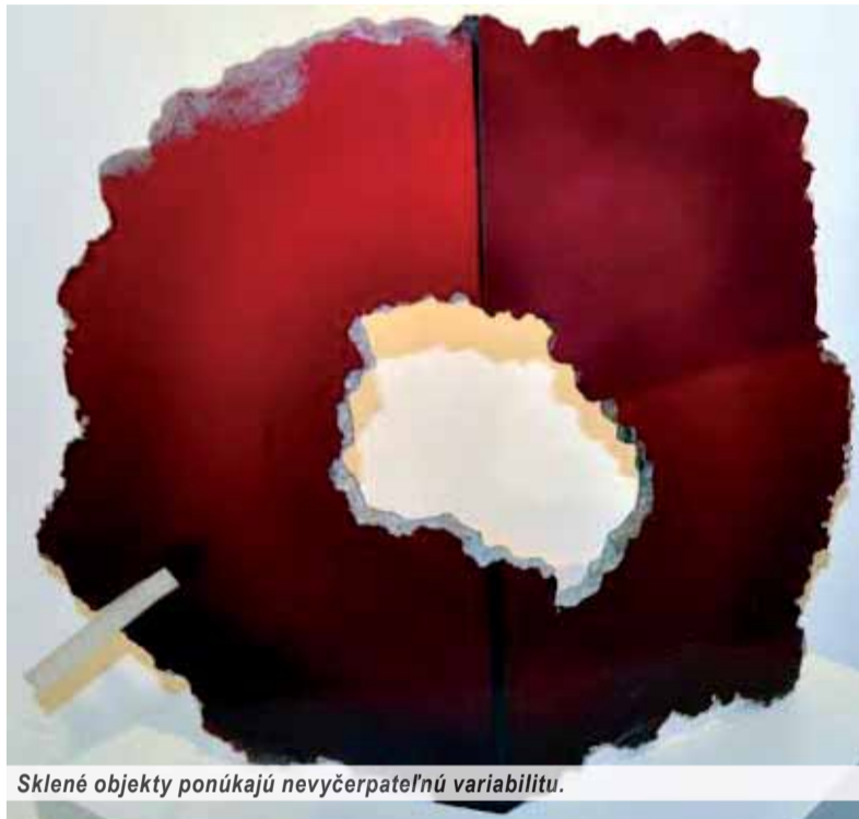
Sklené objekty ponúkajú nevyčerpateľnú variabilitu.

Tradicia umeleckého sklárstva je na Slovensku už najmenej polstoročie prítomná, aj keď ju širšia verejnosť vníma skôr okrajovo. Aj napriek nesporným kvalitám boli v minulom režime naši umelci sklári tak trochu v tieni svojich českých kolegov a po zániku Česko-Slovenska postupne atrofovali aj naše sklárne. O to zaujímavejšia je výstava, ktorá približuje tvorbu slovenských umeleckých sklárov vo svetovom kontexte.