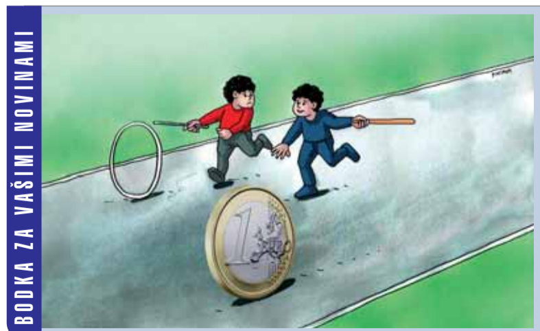
BODKA ZA VAŠIMI NOVINAMI