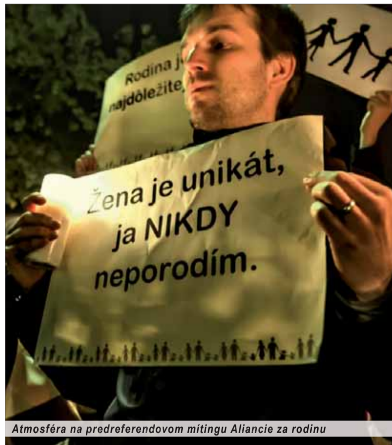
Atmosféra na predreferendovom mítingu Aliancie za rodinu

Andrej Kiska vyslovil želanie, aby spôsob, akým ľudia dospejú k výsledku hlasovania, nech by dopadol akokoľvek, nezanechal rany na ľuďoch, na schopnosti diskutovať a počúvať sa navzájom. „Aby sa argumentovalo úctivo a pravdivo, aby sme nevyšli z referenda rozdelení na nepriateľské tábory. Aby sa pre túto tému dokonca nerozpadávali priateľstvá,“ vyzval. Žiaľ, zostal – aspoň nateraz – nevy počutý. Jeho výzva nebola dostatočne autoritatívna ani pre správcu komerčného, ale ani pre správcu verejnoprávneho média. Paradoxne, v slovenskom