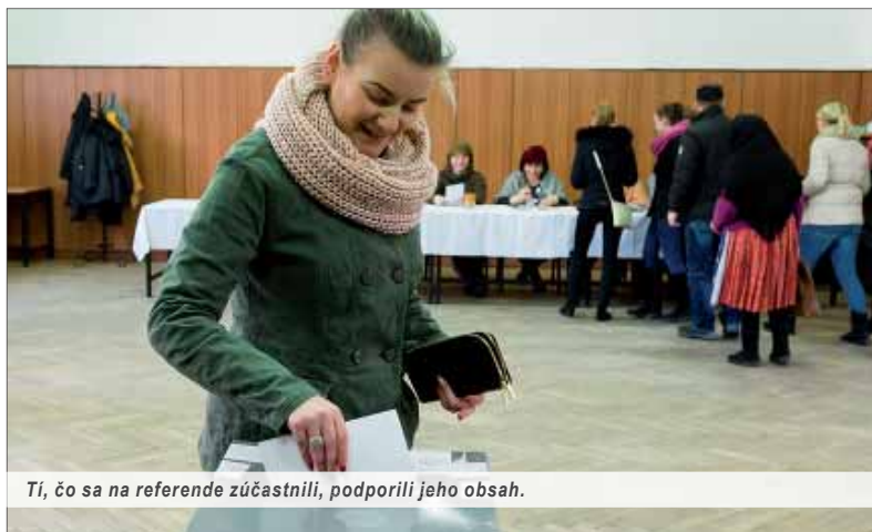
Tí, čo sa na referende zúčastnili, podporili jeho obsah.

Netreba zabúdať, že odporcovia referenda sú súčasne pod-