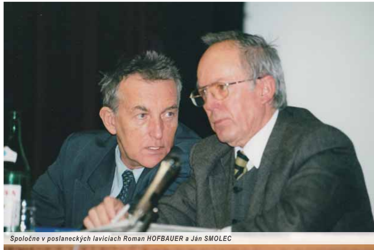
Spoločne v poslaneckých laviciach Roman HOFBAUER a Ján SMOLEC