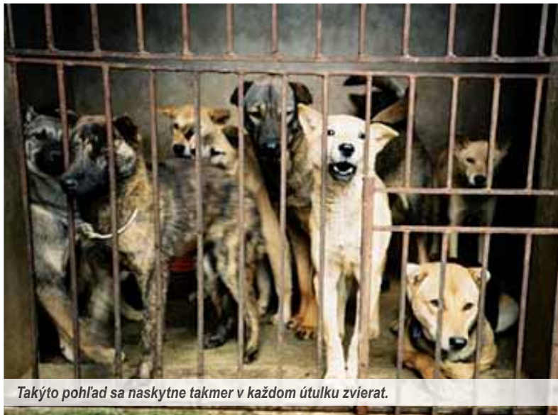
Takýto pohľad sa nasýtkne takmer v každom útulku zvierat.

V Bratislave neznámy páchatel' v priebehu niekoľkých mesiacov otrávil už vyše dve desiatky psov. To sú však len prípady, o ktorých sa vie, lebo majitelia psov sa snažili zachrániť svojich miláčikov u veterinára. Ďalšie prípady, keď pes po otrave uhynul a majitelia nevedeli prečo, sú neevidované. Ten, kto sa vrší na psoch a zákerne ich zabíja otravou, je zločinec. Druhá vec je, či by sa pes na vychádzke s majiteľom, ktorý sa mu venuje a dodržiava príslušné vyhlášky, mohol otráviť z voľne pohodenej návnady. Ak by bol pes na vódkze a na očiach majiteľa, ten by mu sotva dovolil zhltnúť čokoľvek zo zeme. Takže sme pri tom, že za smrť psa aj v takýchto prípadoch zodpovedá majiteľ, ktorý sa o svoje zviera nestará.