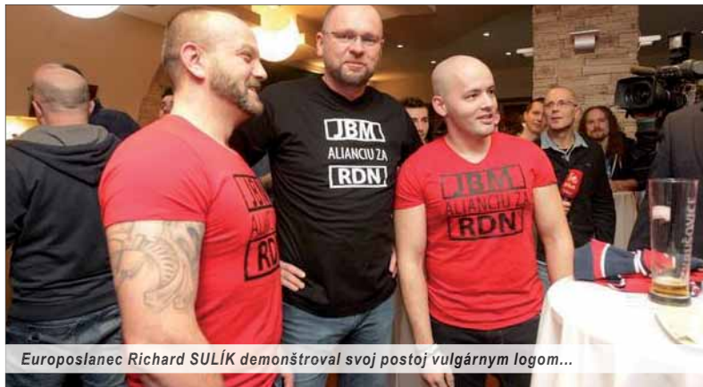
Europoslanec Richard SULÍK demonštroval svoj postoj vulgárnym logom...