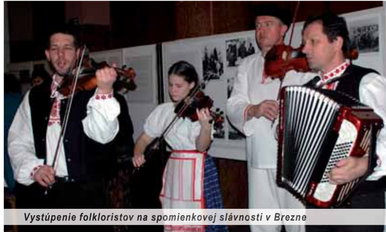
Vystúpenie folkloristov na spomienkovej slávnosti v Brezne

Matičarske dejiny v Brezne siahajú do novembra 1919, keď v tomto horehronskom centre vznikol matičný odbor. Pri svojom založení mal sedemdesiatdva členov. V súčasnosti má tamojšia organizácia MS takmer štyristo individuálnych a šesť kolektívnych členov.