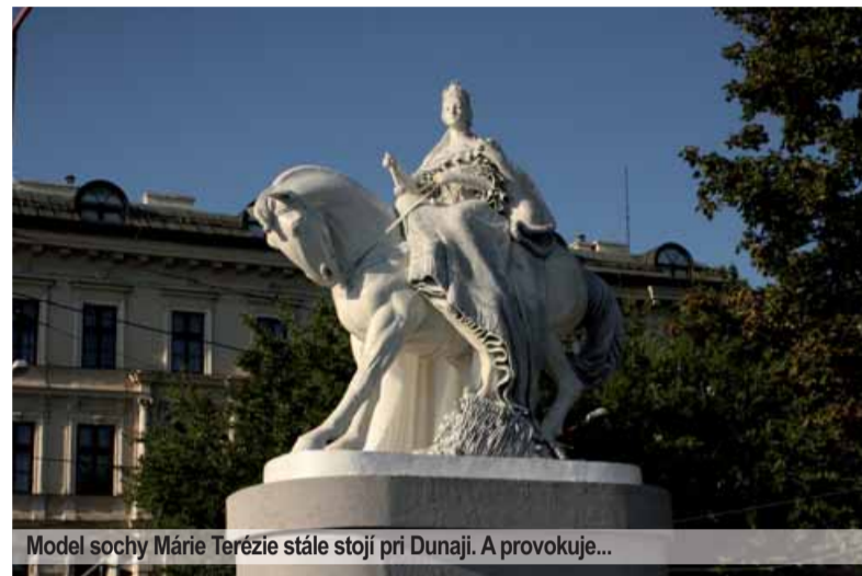
Model sochy Márie Terézie stále stojí pri Dunaji. A provokuje...