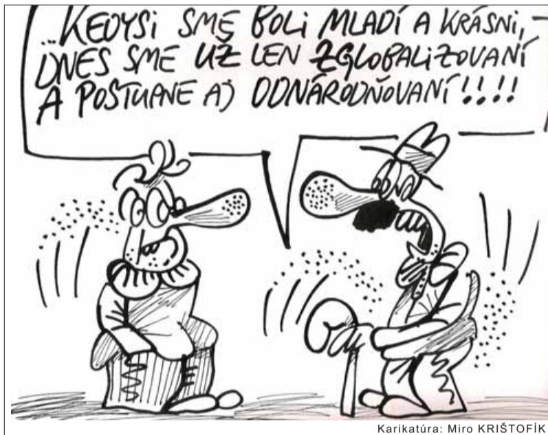
Karikatúra: Miro KRISTOFÍK

Brothers) a od iných ľudí prevzatých nepodložených svedectiev. Zaisťte sa ľahšie meria veľkosť hrubého domáceho produktu (HDP) ako hmotnosť materiálnych predmetov. To však neznamená, že sa nedá merať.