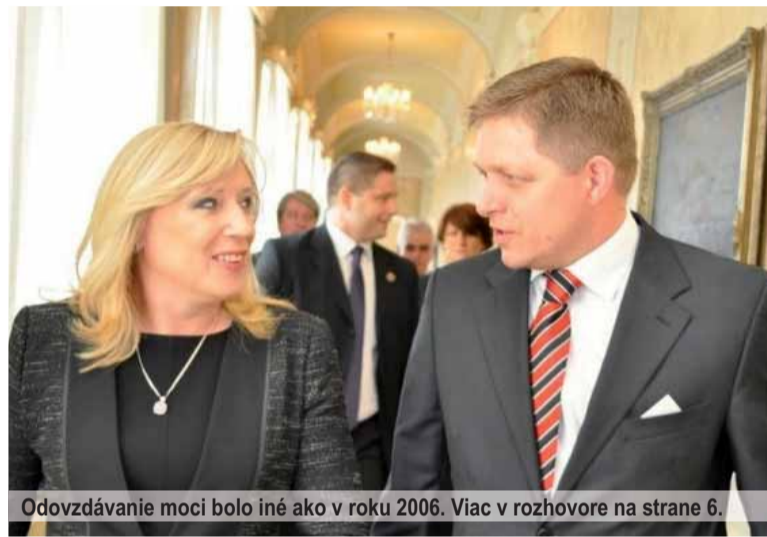
Odvzdávanie moci bolo iné ako v roku 2006. Viac v rozhovore na strane 6.

Desaťtisíce členov sú podľa predsedu Matice pripravené poskytnúť aktívnu podporu vláde pri docenení zdravého vlastenectva v našom živote v jej budúcich rozhodnutiach. Maticiari tak nielen pasívne očakávajú zásadné zmeny v živote našej spoločnosti,