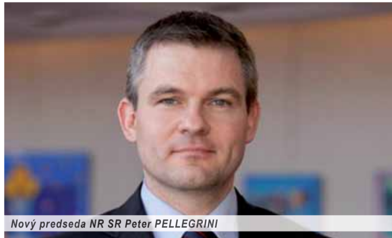
Nový predseda NR SR Peter PELLEGRINI

Nový minister školstva Juraj Draxler to nebude mať ľahké. Sedí na stoličke, na ktorej sa od revolúcie vystriedalo najviac úradníkov. No podľa jeho blogov možno je pre rezort nádejou: „A spoločnosť ako celok pekne hlúpane. A zabáva sa na rôznych politických pseudoproblémoch. Osobne by ma každodenná drobná rezignovanosť na civilizovanú komunikáciu s úctou k logike a faktom, aj vystriedanie umenia náhradkami trápilo intenzívnejšie ako to, že niekto niekde stratil miesto alebo vyhral voľby. Z dlhodobé-