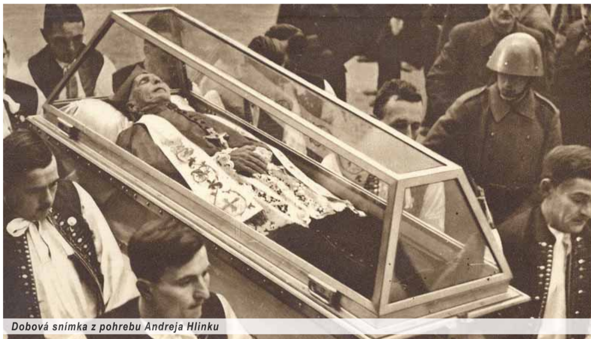
Dobová snímka z pohrebu Andreja Hlinku

Nasledujúce ráno krátko pred ôsmou hodinou prišla do Ružomberka slovenská vláda a presne o ôsmej hodine i vlak s prezidentom republiky, ktorý v sprievode zástupcov armády, úradov a diplomatického zboru, nadše-