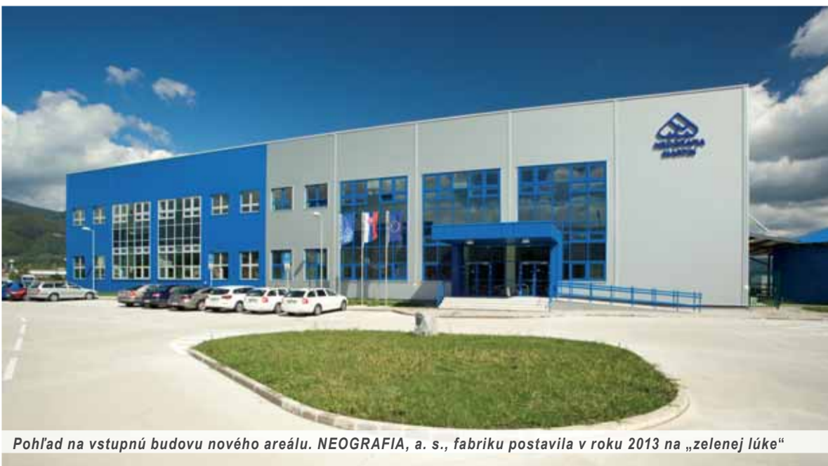
Pohľad na vstupnú budovu nového areálu. NEOGRAFIA, a. s., fabriku postavila v roku 2013 na „zelenej lúke“