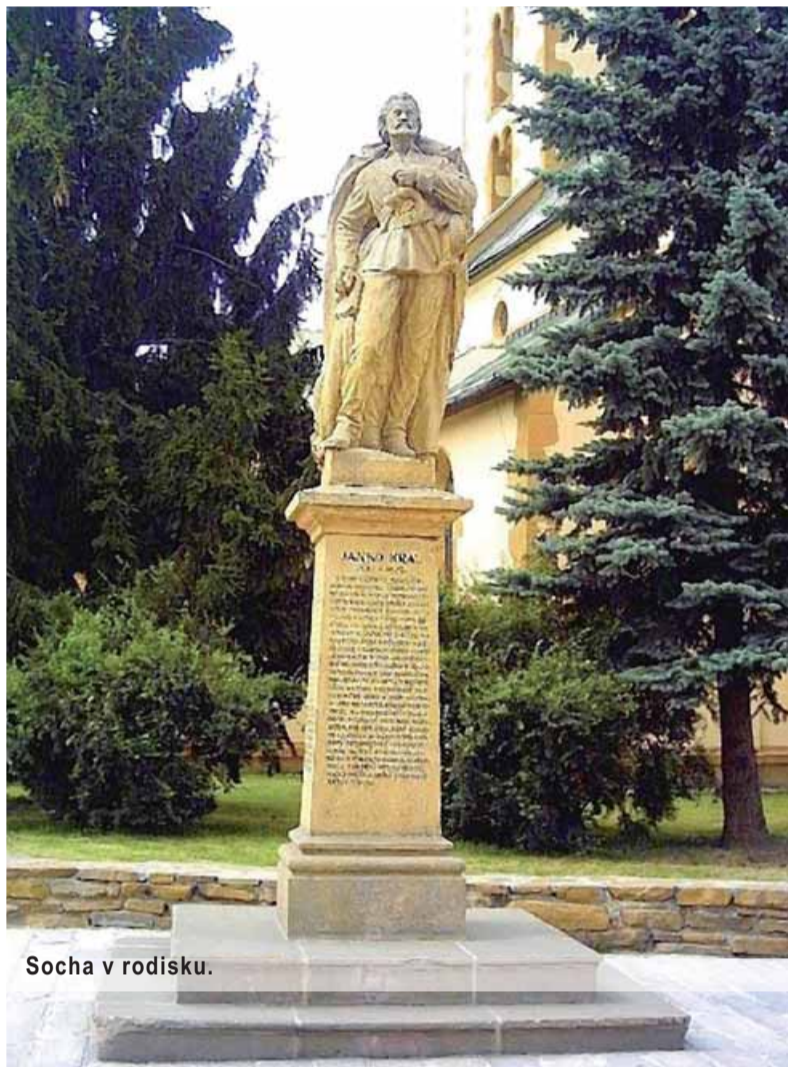
Socha v rodisku.