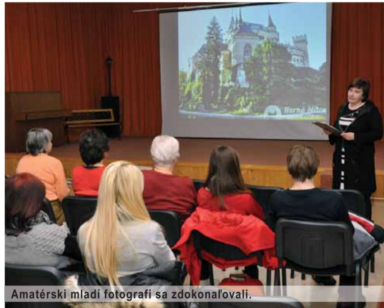
Amatérski mladí fotografi sa zdokonaľovali.