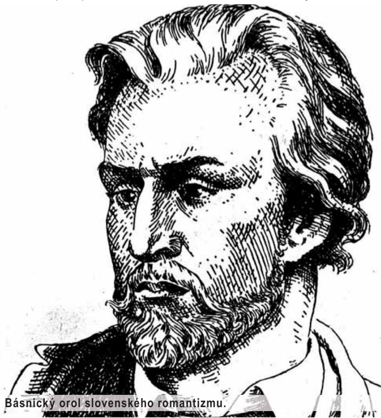
Básnický orol slovenského romantizmu.

V marci 1849 sa smutne stavia medzi účastníkmi pohrebu dvoch slovenských martýrov, o Šulekovi a Holubym píše Dumku dvoch bratov. Ak bolo doteraz možné hovoriť o nepretržitej literárnej tvorbe, po spomínanom prakticky táto jeho „činnosť“ zaniká. Až do náhleho skonu sa k písaniu dostáva iba sporadicky; tvrdý chlebič každodenného života mu vyštrbil pero. Ostáva spomenúť básne o „bunte“ a následnom väzení Šahy (1849), retrospektívne publikovanie rukopisných úryvkov (napr. z básne K Slovenom pod názvom Slovenčine v Slovenskom pozorníku z roku 1854), básne Slovo v Sokole z roku 1861... Na záver musíme vyzdvihnúť Kráľove nadšené verše oslavujúce slávne memorandové zhromaždenie v básni Duma slovenská s nedvojznačným podtitulom Na pamiatku zjazdu turčiansko-martinského 6. júna 1861.