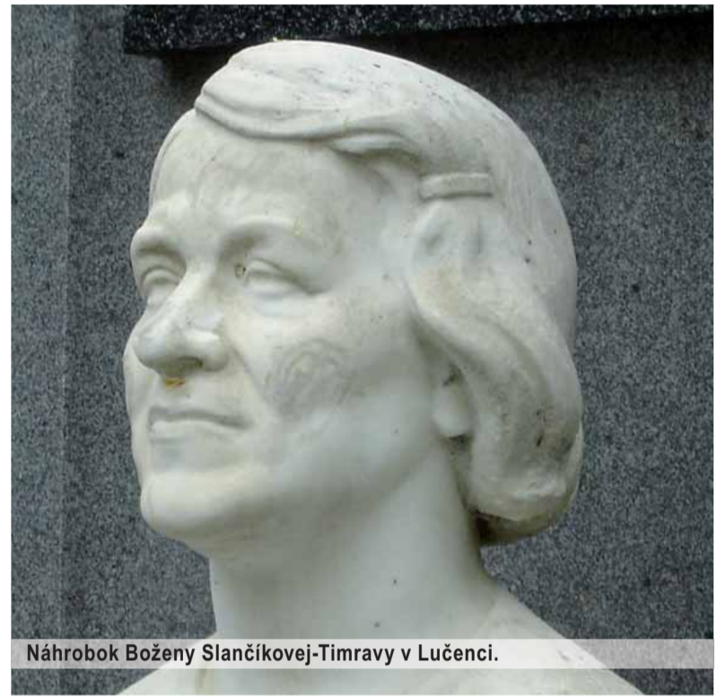
Náhrobok Boženy Slančíkovej-Timravu v Lučenci.