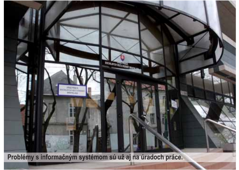
Problémy s informačným systémom sú už aj na úradoch práce.

dy práce budú môcť vzájomne efektívnejšie komunikovať. Napriek tomu zostáva pocit, že tu ktosi opäť svoju úlohu nezvládol.