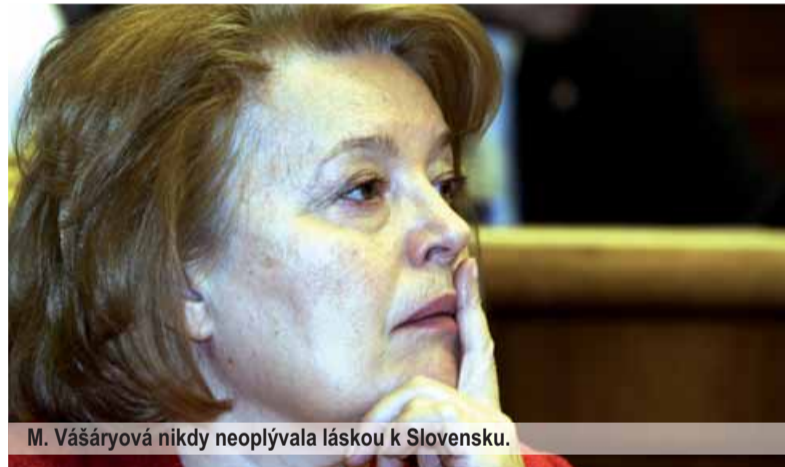
M. Vášáryová nikdy neoplývala láskou k Slovensku.

zostať mecenáškou a presadzovať dobrých ľudí a dobré myšlienky“. Jednou z prvých je tvrdenie, že Robert Fico o ničom nerozhoduje, že je len akoby riaditeľom akciovej spoločnosti a strana SMER-SD nie je autentickou ľavicovou stranou. Pani poslankyňa si nevšimla, že voľby skončili s reklamnou ilúziou, ktorú tak usilovne pomáhala šíriť, a to nepretržite: mylnej predstavy, že bez SDKÚ niet na Slovensku demokracie. Na vlne spochybňovania však začali „vysielat“ aj ďalší autori v českých novinách a „autorky“ súkromných televízií na Slovensku. Spochybňovanie je jasným zastreľovaním sa na prospech Budapešti. Rozložená politická scéna v Česku, medzinárodné neúspešná alebo izolovaná Budapešť – to vidí každý. Určite nemôže byť v slovenskom záujme v takejto situácii spochybňovať stabilnú vládu a stabilný parlament na Slovensku.