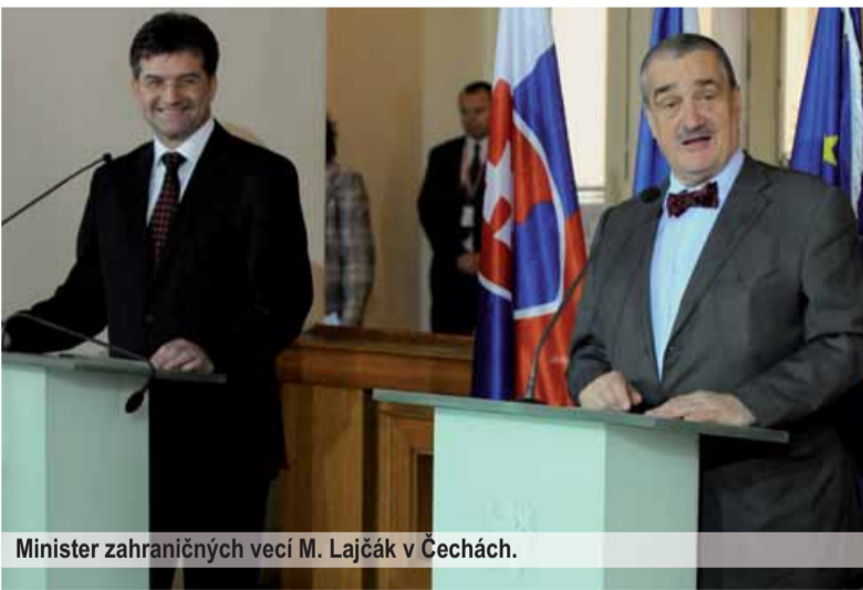
Minister zahraničných vecí M. Lajčák v Čechách.