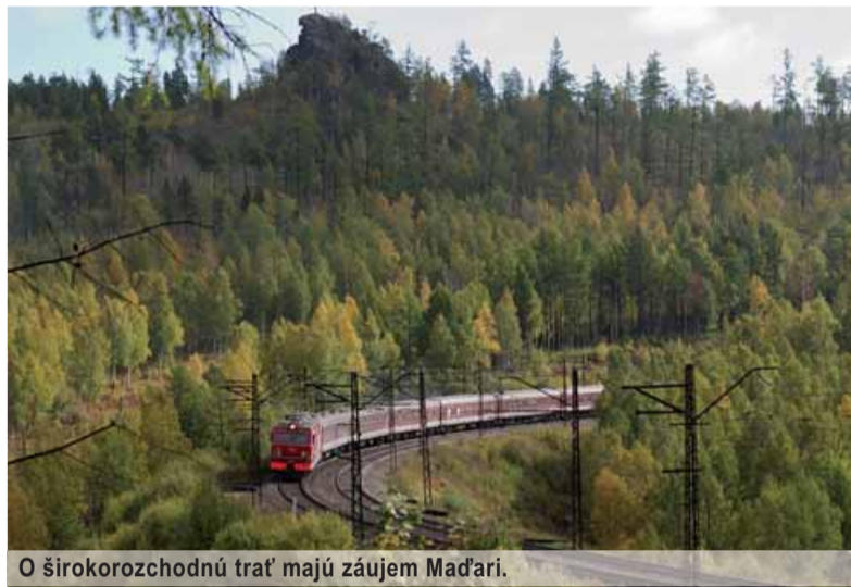
O širokorozhodnú trať majú záujem Maďari.

Obchod a politika nie je to isté. Oveľa horšie je však, ak sa spoja mizerné manažérske schopnosti so slepou a neprezieravou politikou. V najlepšom prípade nás niektoré rozhodnutia bývalej vlády budú stáť iba dva stratené roky. V tom horšom – desaťtisíce pracovných miest. A zároveň istý trvalý príjem, napríklad z prepravy tovarov po širokorozhodnej trati.