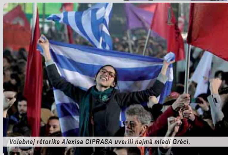
Volebnej rétorike Alexisa CIPRASA uverili najmä mladí Gréci.

„Grécky ľud dnes písal históriu,“ povedal jasajúcemu davu na jednom z aténskych námestí tesne po vyhlásení výsledkov plebiscitu A. Cipras. Isté je, že víťazstvo ľavice v Grécku