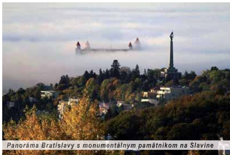
Panorama Bratislavy s monumentálnym pamätníkom na Slavíne