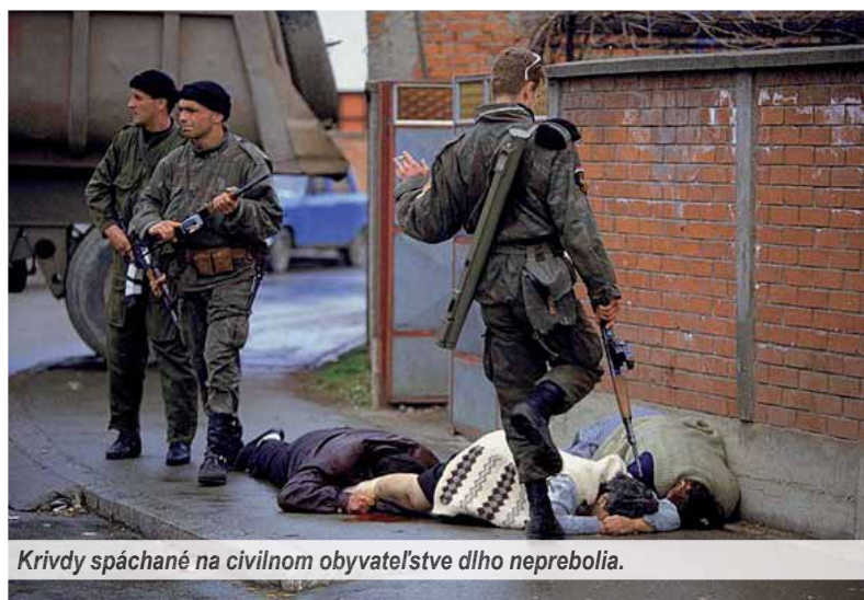
Krivdy spáchané na civilnom obyvateľstve dlho neprebolia.