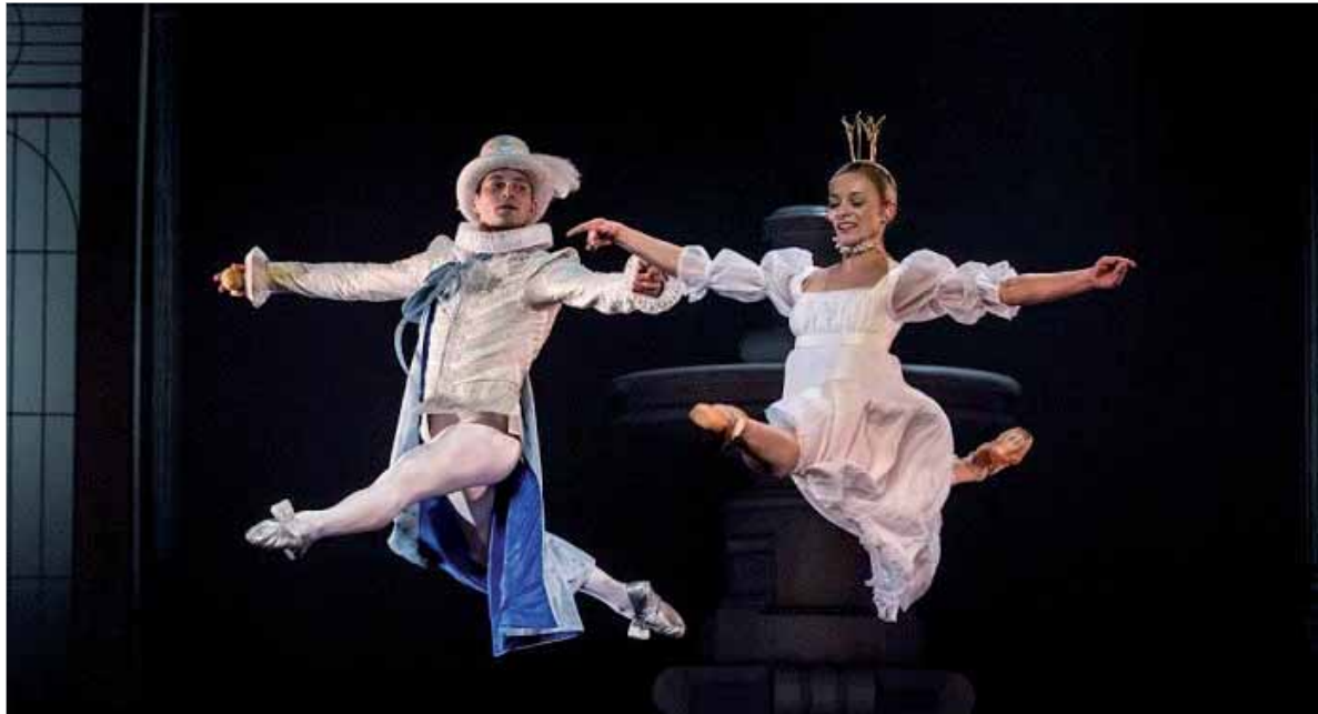
Baletný súbor prvej scény pripravil pre deti rozprávkovú lahôdku.

„Divadelných predstavení pre detského diváka je na Slovensku akútny nedostatok,“ počúvame ponosy dramaturgov zo všetkých ansámblov. Treba dodať, že činoherných by sa ešte aj našlo, slabšie je to v opernej a baletnej oblasti. A tak dramaturgia Baletu Slovenského národného divadla v Bratislave zaradila pre túto sezónu časom overené baletné dielo klasika českej hudby Oskara Nedbala, ktorý zohral významnú úlohu v začiatkoch existencie nášho profesionálneho divadla na Slovensku.