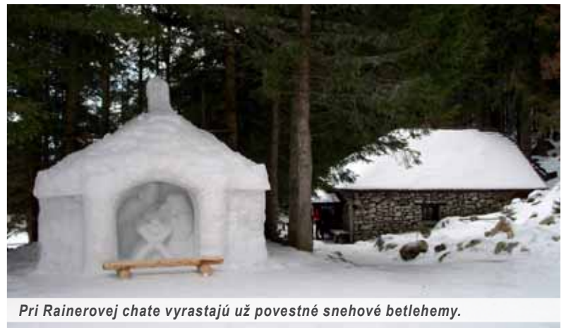
Pri Rainerovej chate vyrastajú už povestné snehové betlehemy.

K obľúbenosti chaty prispievajú aj pravidelné podujatia, ako je v zime snehový betlehem spojený s Trojkráľovou koledou a v lete zasa Deň chaty v polovici augusta. „Trojkráľové poludnie na Rainerovej chate bolo na začiatku len také novoročné stretnutie priateľov chaty. V súčasnosti chodia na toto podujatie stovky ľudí. Stalo sa to tak, že každý zúčastnený o tom povedal niekomu ďalšiemu, prídte sa pozrieť, býva tam priateľské stretnutie, býva tam muzika, je tam veselo. Nakoniec je to už v takých rozmeroch, že musia chodiť mimoriadne lanovky, len aby stihli vyviezť všetkých ľudí, ktorí sa chcú pozrieť na betlehem,“ hovorí chatár, ktorý sa tak stal otcem tradície. Okrem snehových betlehemov stavia aj iné sochy zo snehu, čo dokazuje jeho umelecké nadanie. V tejto zime postavil vedľa