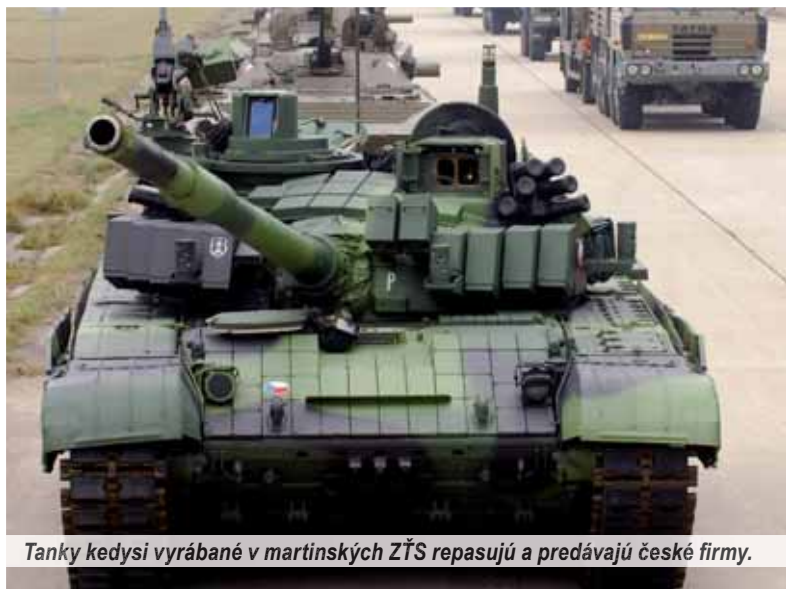
Tanky kedysi vyrábané v martinských ZŤS repasujú a predávajú české firmy.