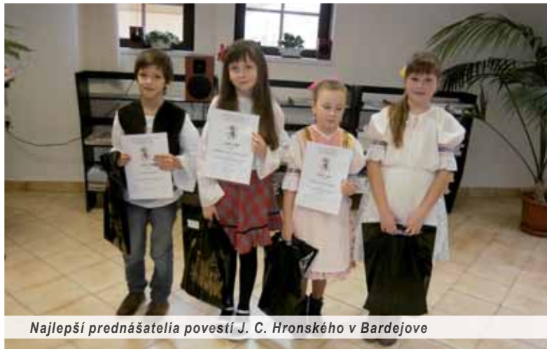
Najlepší prednášatelia povestí J. C. Hronského v Bardejove

V minulotýždňovom vydaní SNN sme informovali o okresnom kole súťaže Šaliansky Matko 2015 v Banskej Bystrici. Z pochopiteľných dôvodov nemôžeme priniesť správy a obrázky zo všetkých školských a ďalších postupových kol a oceniť výkony účastníkov. Teší nás vklad a zaujatie pedagógov aj organizátorov, ktorí nám do redakcie posielajú stále novšie údaje o ďalších miestach konania a o adeptoch na celkové úspešné umiestnenie už v 22. ročníku tejto populárnej matičnej akcie. Želáme im v tomto ich záslužnom počinaní veľa úspechov.