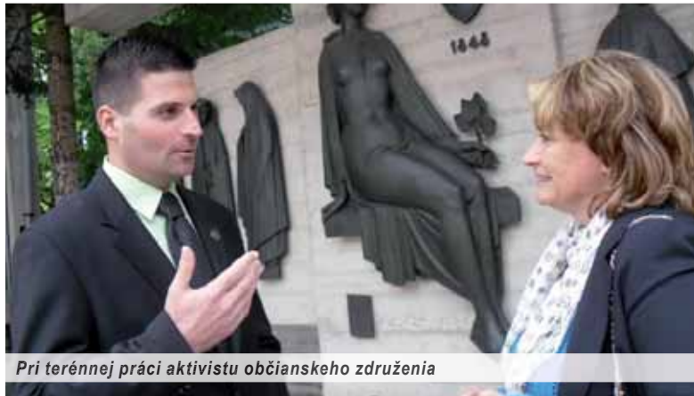
Pri terénnej práci aktivistu občianskeho združenia

Ide o obrovský tlak na normálne hodnoty nielen Slovenska, ale celej Európy. Veď vidíme, čo sa deje v západnej Európe, a už to prichádza aj do jej