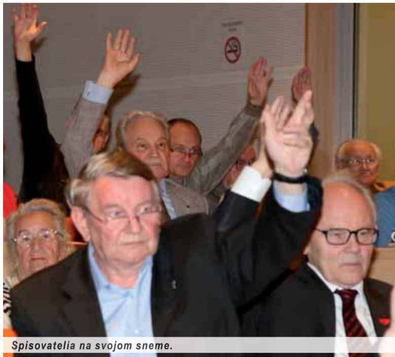
Spisovatelia na svojom sneme.