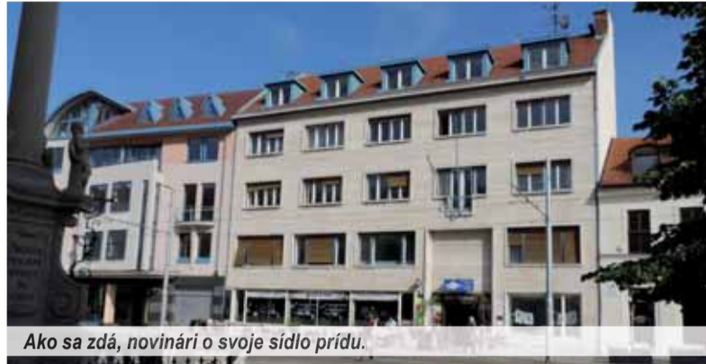
Ako sa zdá, novinári o svoje sídlo prídu.

Syndikát slovenských novinárov, zdá sa, sa najnovšie topí v iných problémoch, ako je „len“ založenie budovy najhorším možným spôsobom zo všetkých možných zlých schránkovej spoločnosti. Tu niektorí slovenskí „novinári“ predvedli naozaj netušené schopnosti, keď sa pod niečo také podpisovali.