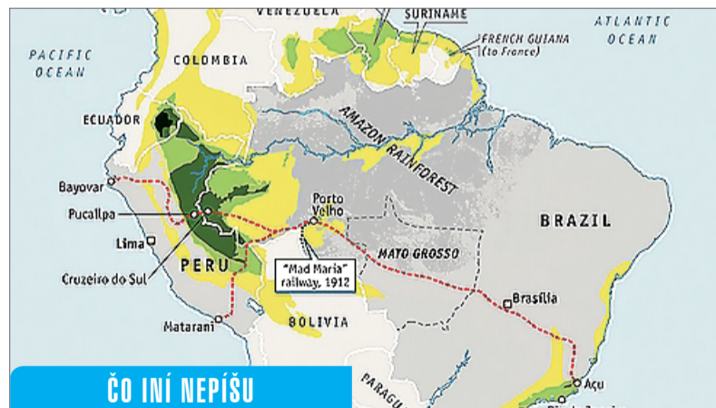
ČO INÍ NEPÍŠU

Na možnej výstavbe železnice sa dohodla čínska vláda aj s predstaviteľmi Brazílie. Navrhovaná železnica by znížila náklady na prepravu agrokomodít a nerastných surovín do Ázie. Ak