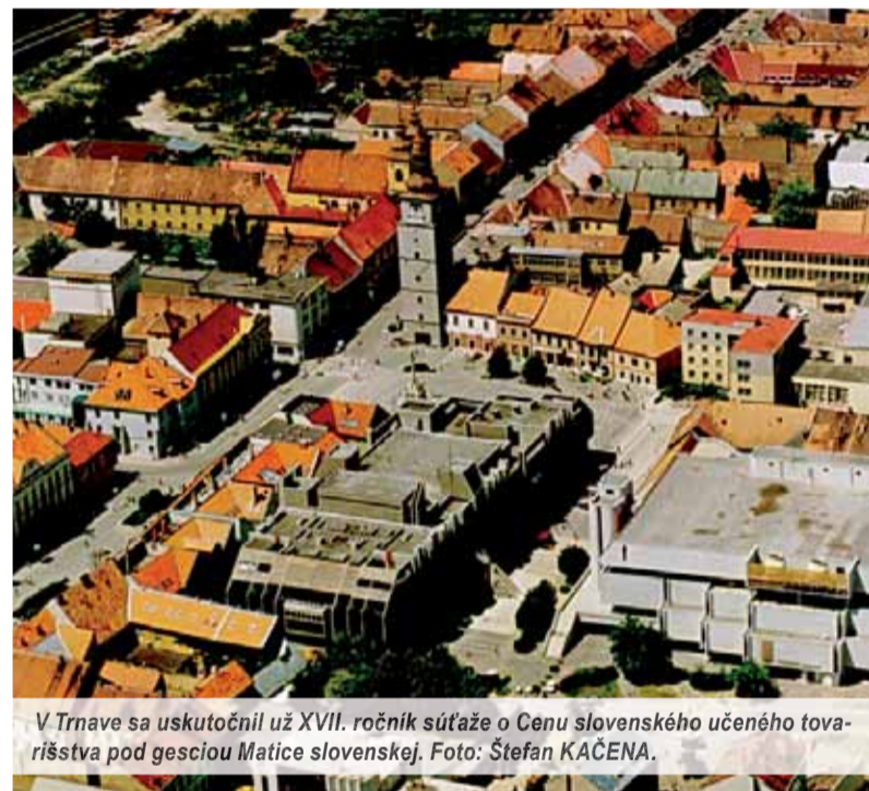
V Trnave sa uskutočnil už XVII. ročník súťaže o Cenu slovenského učeného tovarišstva pod gesciou Matice slovenskej.

Do XVII. ročníka celoslovenskej literárnej súťaže o Cenu Slovenského učeného tovarišstva 2014/2015 sa prihlásilo stotridsaťtri účastníkov, čo organizátorov samozrejme potešilo. Svoje príspevky tentoraz poslalo sedemdesiatdeväť autorov poézie a päťdesiatštyri autorov prózy. Tradičná súťaž pod gesciou Matice slovenskej za desať rokov ako košatý strom zapustila hlboké korene, ktorého vetvy sú rozkonárené po celom Slovensku.