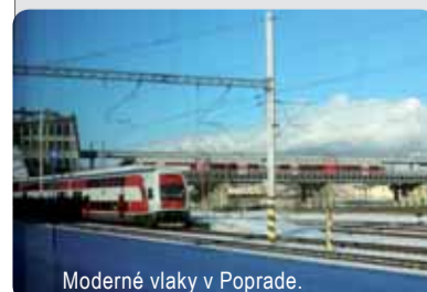
Moderné vlaky v Poprade.