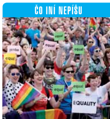
ČO INÍ NEPÍŠU

v írskom parlamente aktívne podporovala kampaň za homosexuálne „manželstvá“ a hrozili svojim členom vyhodením, ak nebudú dodržiavať stranícku líniu. Všetky veľké verejné