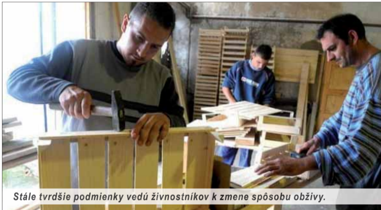
Stále tvrdšie podmienky vedú živnostníkov k zmene spôsobu obživy.

Ak podľa údajov úradov práce len veľmi malá časť živnostníkov po zrušení živností končí na pracovnom úrade, kde sa potom strácajú? Prvá možnosť je absolútne legálna, no pre štát maximálne nevýhodná – v zahraničí. Druhá možnosť naráža na zákony a pre štát je takisto nevýhodná – bývalí živnostníci sa strácajú v šedivej a čiernej ekonomike. Politika likvidácie stredného stavu nie je prezieravá. V súčasnosti je však podporená aj tým, že len veľmi málo zo sociálnych balíčkov, primárne určených zamestnancom, sa týka aj živnostníkov.