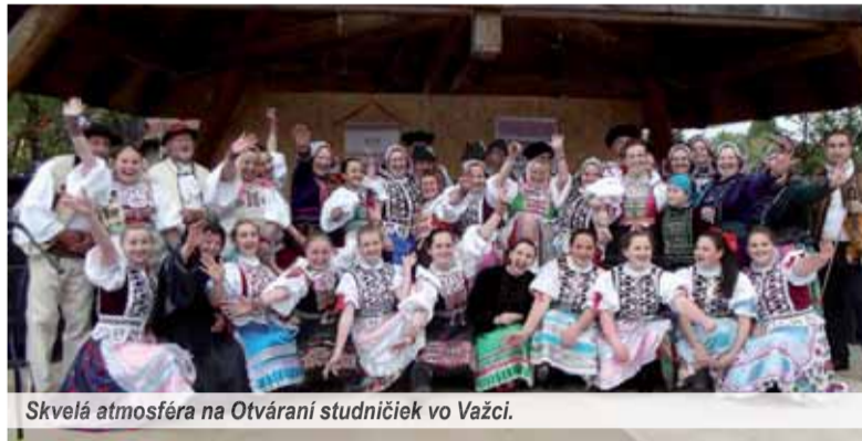
Skvelá atmosféra na Otváraní studničiek vo Važci.