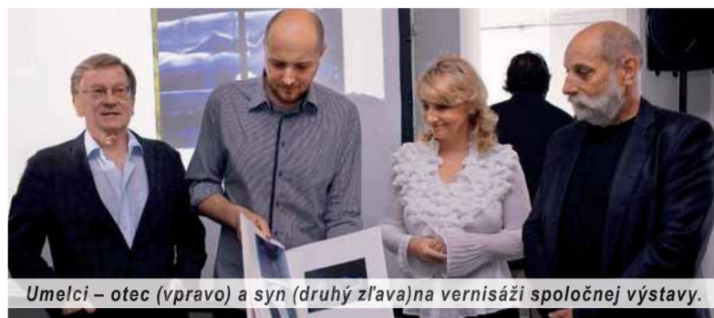
Umelci – otec (vpravo) a syn (druhý zľava) na vernisáži spoločnej výstavy.