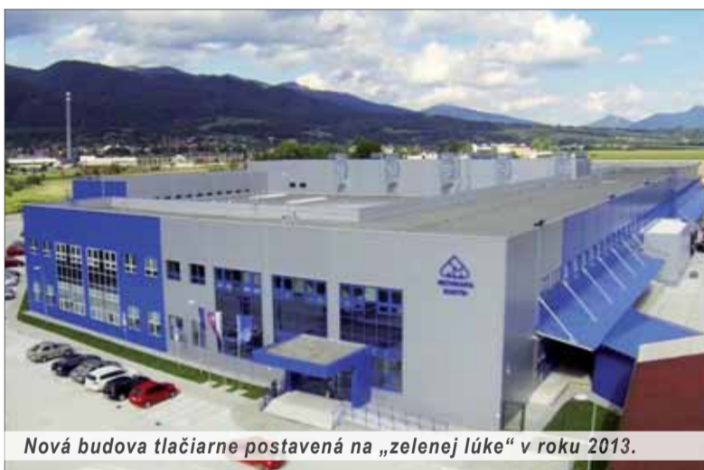
Nová budova tlačiarne postavená na „zelenej lúke“ v roku 2013.