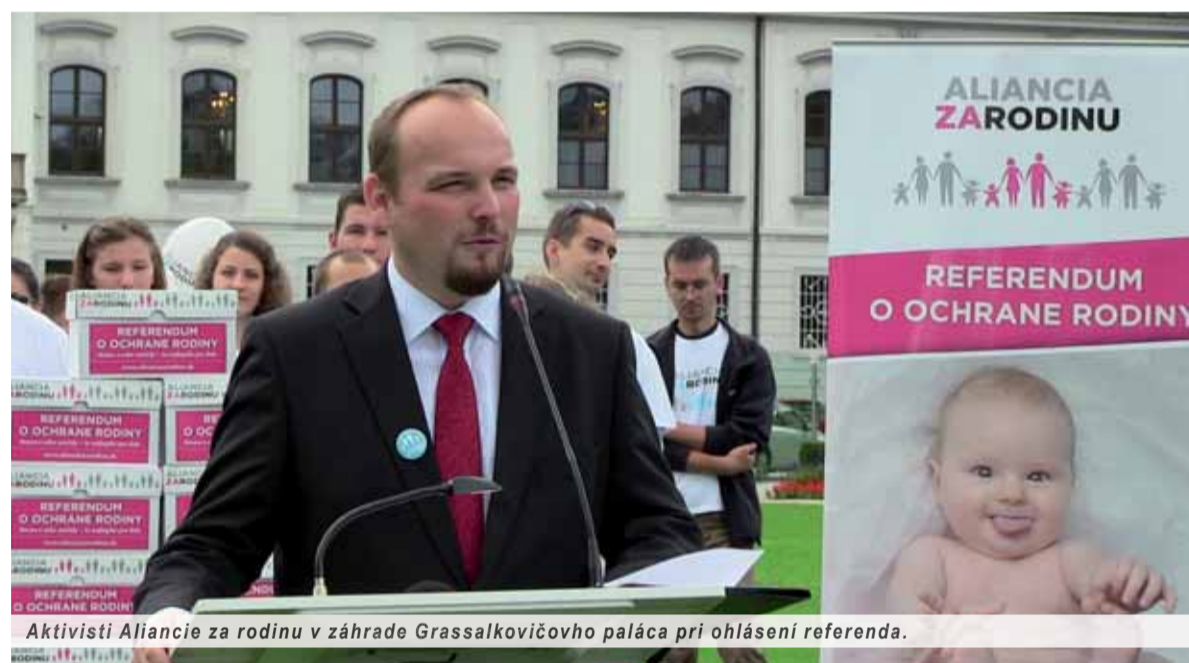
Aktivisti Aliancie za rodinu v záhrade Grassalkovičovho paláca pri ohlásení referenda.

vnucuje model správania alebo že ju k tomu núti ekonomické okolnosti. Ak sa žena chce obetovať pre deti, nemalo by to byť vnímané negatívne. Veď vieme, že je to skvelá investícia, ktorú to dieťa nájde. A rovnako aj štát. Čiže ciele stratégie sa nám zdali absolútne nevhodné, a preto sme ich demontovali. Špekulácie predkladateľov stratégie, či má otec alebo matka zostať s dieťaťom, považujeme za sociálne inžinierstvo. A nie za rodovú rovnosť. Je predsa na rodi-