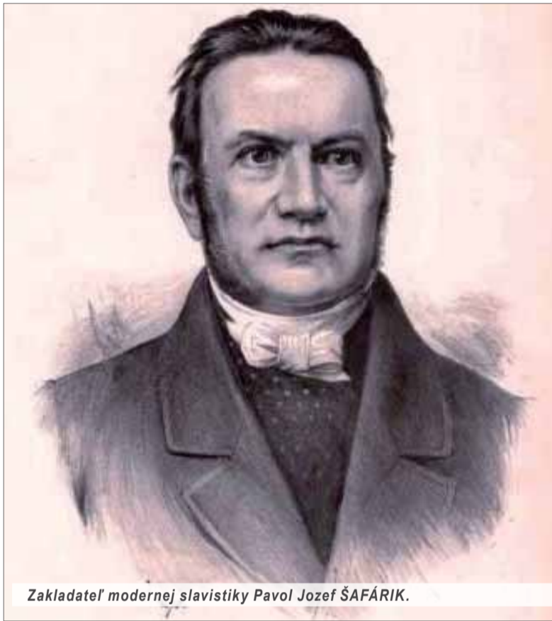
Zakladateľ modernej slavistiky Pavol Jozef ŠAFÁRIK.

V rokoch 1805 – 1808 študoval v Rožňave, kde si popri povinnej latinčine osvojil maďarčinu a nemčinu. Na jeseň v roku 1808 odišiel na štúdium do Dobšinej, o čom pravdepodobne opäť rozhodlo hmotné postavenie rodiny, keďže tu mohol bývať u sestry Márie. V dobšinskej škole dosiahol ešte väčšie úspechy než v Rožňave. Odchádzal odtiaľ s výborným vysvedčením, potrebnými vedomosťami z literatúry, so znalosťou latinčiny, nemčiny a maďarčiny. Pätnásťročný Šafárik však už vyčerpal možnosti štúdia v regióne a ak