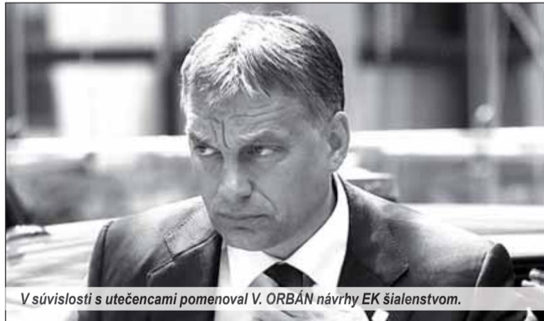
V súvislosti s utečencami pomenoval V. ORBÁN návrhy EK šialenstvom.

Až teraz v polovici roka 2015, keď sa Únia usiluje administratívne