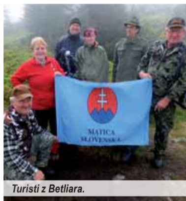
Turisti z Betliara.

nielen účinkujúcim, ale aj rodákom, domácim či hosťom nielen z blízkeho, ale aj širokého okolia, sa mala spievať važecká hymna – Kopala studničku. A práve tu sa prejavila oslava zblížovania a ľudskej vzájomnosti, na javisku zostali FZ Stráne a k nim sa pripojila Fsk Hôra Rejdová. Spoločný spev nielen javiskových spevákov, ale v stojí všetkých prítomných umocnil vzácnu chvíľu. Spoločné záverečné fotenie malo tiež svoje čaro, oba kolektívy sa tak pomiešali, že môžete na fotografiách hľadať, kto je odkiaľ. Ďakujeme organizátorom za krásny deň a ďakujeme všetkým účinkujúcim za radosť a hrdosť pri zachovávaní zvykov.