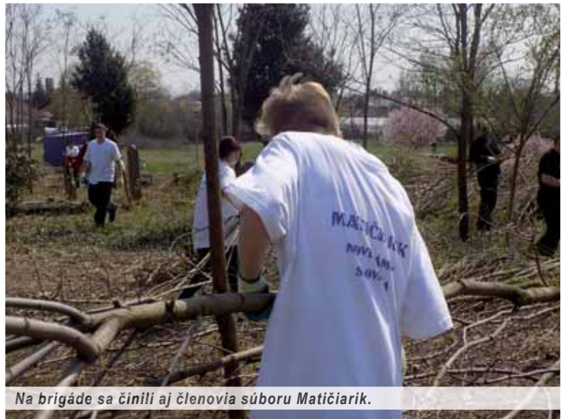
Na brigáde sa činili aj členovia súboru Matičiarik.

ľudí. Vyjadril spokojnosť s tým, že sa pri verejnoprospešnej aktivite stretli Novozámockania rôznych vekových kategórií, z rôznych spoločenských organizácií a vykonali kus užitočnej práce pri úprave životného prostredia mesta aj pri záchrane kultúrnych pamiatok. A naozaj bola radosť pozorovať sa na ich elán a chuť urobiť niečo pre dobro všetkých.