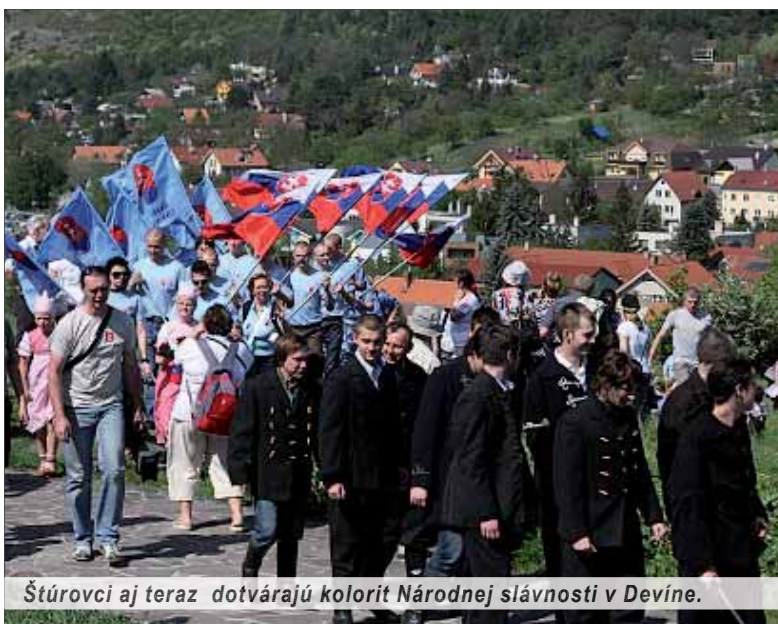
Štúrovci aj teraz dotvárajú kolorit Národnej slávnosti v Devíne.

Osobne ma veľmi teší, že tento rok zaradilo UNESCO do svojho kalendára výročí dvojsté výročie narodenia Ľudovíta Štúra, čím jeho osobnosť dostala medzinárodný, nadnárodný rozmer. V tomto roku uplynie aj stosedemdesiat rokov od vydania prvého čísla Slovenských národných novín, ktorých zakladateľom, vydavateľom a hlavným redaktorom bol práve Ľudovít Štúr. Noviny znamenali prelom nielen