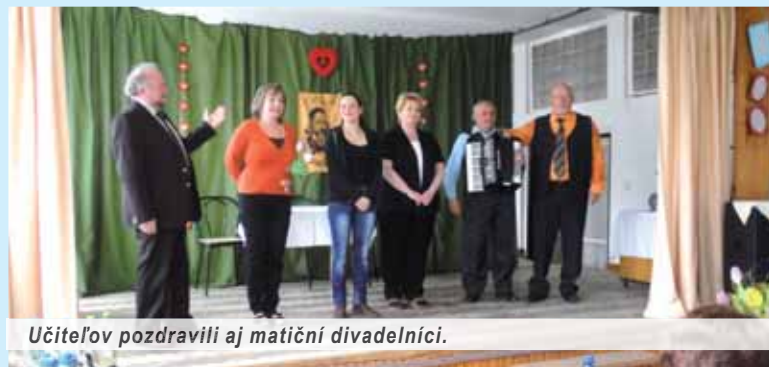
Učiteľov pozdravili aj matiční divadelníci.