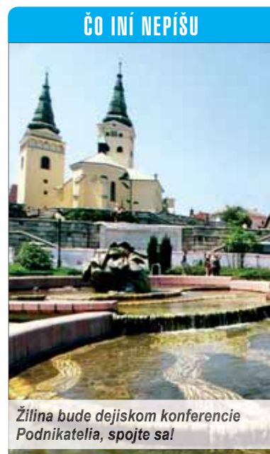
Žilina bude dejiskom konferencie Podnikatelia, spojte sa!