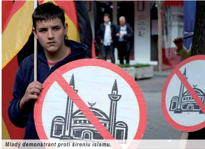
Mladý demonstrant proti šíreniu islamu.

Posledné teroristické vraždenia v západoeurópskych mestách vystrašili celý náš kontinent. Napriek zvýšenej ostražitosti tajných služieb, polície a armády nik nemôže vylúčiť, že sa tragédia opäť neprehodí – a možno aj v dotyku s nami. Moslimských prisťahovalcov je vo veľkej časti Európy masa, možno už dvanásť miliónov, možno ešte viac, a nik nevie, koľkí z nich sú už zapojení v teroristických bunkách, mnohí dokonca vycvičení v táboroch veľkých moslimských teroristických organizácií. Najväčšou hrozbou pre Európu je však približne päťtisíc dobrovoľníkov v radoch bojovníkov „Islamského štátu“, pochádzajúcich z Európy. Mladí muži, ktorí sa na našom kontinente narodili a fanatizmus ich viedol do boja za „svätú vec“ ďaleko od pohodlia európskych miest, nepoznajú zľutovania, sa vra-