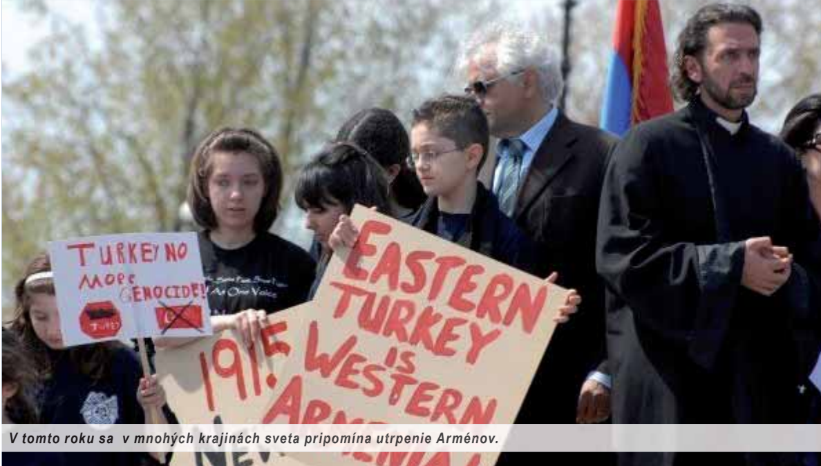
V tomto roku sa v mnohých krajinách sveta pripomína utrpenie Arménov.

Jedným z výnimočných dátumov roka 2015 je nesporne storočnica masakry tisícov príslušníkov najstaršieho kresťanského národa na svete – arménskeho. Dodnes sa vedú o tom prudké spory. Je to citlivá politická téma aj v medzinárodných vzťahoch. Týka sa dvoch významných štátov – Arménskej republiky, jedného z ekonomicky najpostihnutejších štátov na Kaukaze a zároveň člena Východného partnerstva, prípravného programu Európskej únie, a Tureckej republiky, člena Severoatlantickej aliancie NATO, výraznej regionálnej mocnosti a štátu, s ktorým od roku 1964 vedie, či skôr naťahuje Európska únia, Brusel, rokovania o vstupe do európskeho spoločenstva.