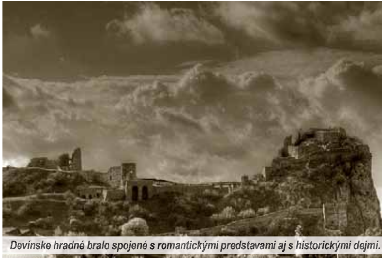
Devínske hradné bralo spojené s romantickými predstavami aj s historickými dejmi.

Devínsky hradný kolos patrí medzi popredné národné symboly i k dôležitým miestam historickej pamäti slovenského národa. Samotný hrad, týčiaci sa na mohutnom skalnom brale pri sútoku Dunaja a Moravy, pôsobí mýtický. Viažu sa k nemu dôležité dejinné udalosti z 9. i z 19. storočia. Nečudo, že svojím charakterom a históriou zaujal mnohé generácie Slovákov.