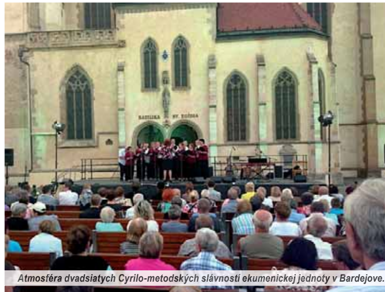
Atmósfera dvadsiatych Cyrilo-metodských slávností ekumenickej jednoty v Bardejove.

Stovky národovcov zasvätili život práci na národnom poli a súčasne poslianiu kresťanskému duchovnému – Jozef Ignác Bajza, Juraj Fándly, Anton Bernolák, Alexander Rudnay, Štefan Moyses, Karol Kuzmány, Jozef Miloslav Hurban, František V. Sasinek, Ferdinand Juriga, Andrej Hlinka a František Fuga, sú len tí najznámejší, nepočítajúc ďalších národných buditeľov – kňazov,