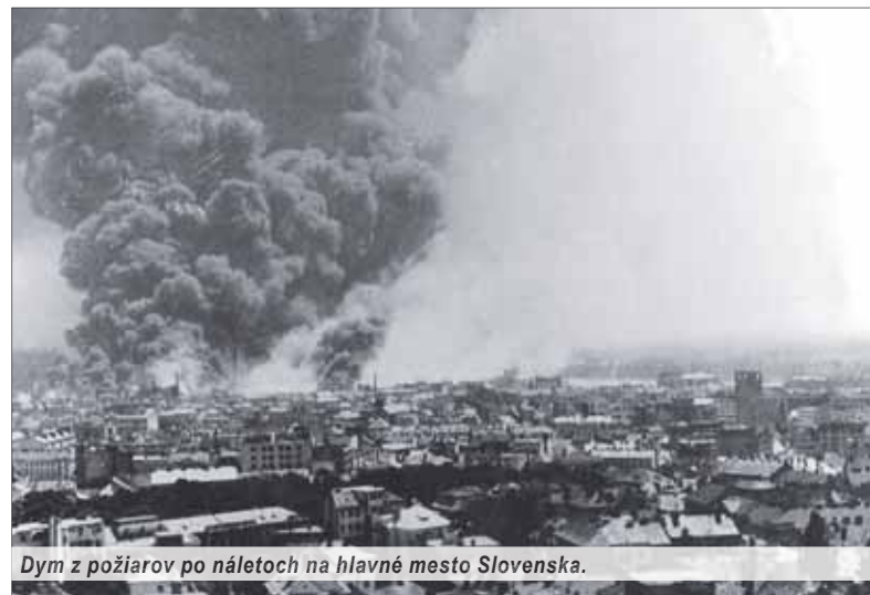
Dym z požiarov po náletoch na hlavné mesto Slovenska.

Popoludní 26. marca 1945 usmrtili Američania posledné bombardovanie hlavného mesta, a tým aj vtedajšej SR. Cieľom vyše päťsto bombardérov so stihacím sprievodom boli zriaďovacie stanice v mestách v okolí Viedne a v severnom Maďarsku. Na Bratislavu bolo vyslaných 122 bombardérov B-24 so sprievodom 50 stíhačiek. Nad mesto však nakoniec priletelo len 60 bombardérov, ktoré medzi 13. a 14. hodinou zhodili na cieľ – Zriaďovacie stanice v Rači – 133 ton bômb. Zo šesťsto vagónov bolo asi sto zničených či poškodených. Objekt bol veľmi ťažko poškodený. Počet mŕtvych na stanici bol jedenásť civilných osôb a desať nemeckých vojakov. Pri druhom nálete bol cieľom priestor stanice Račičtorf (Rača), kde bomby usmrtili jedného vojaka a štyri osoby ťažko ranili. Existujú však dobové údaje o ešte vyššom počte civilných obetí.