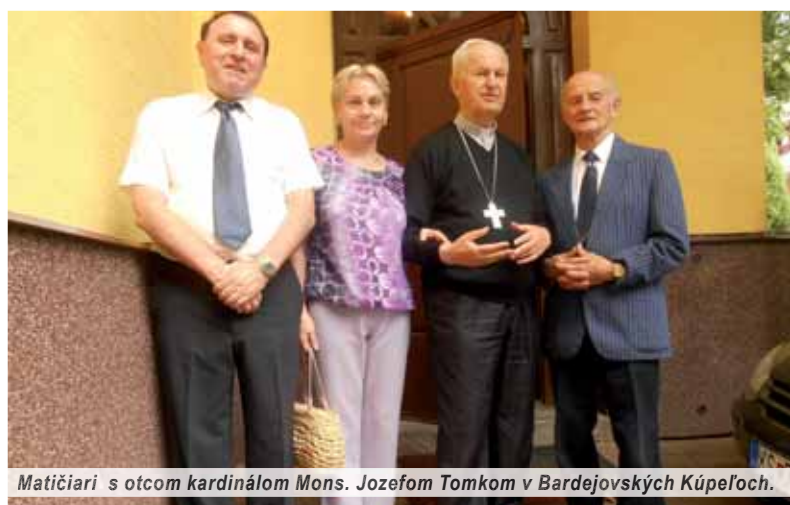
Matičiari s otcom kardinálom Mons. Jozefom Tomkom v Bardejovských Kúpeľoch.

Pôsobivú atmosféru celého podujatia završila farebne osvetená Bazilika sv. Egídia, ktorá vytvárala fantastickú kulisu celému jubilejnému ročníku slávností sv. Cyrila a Metoda.