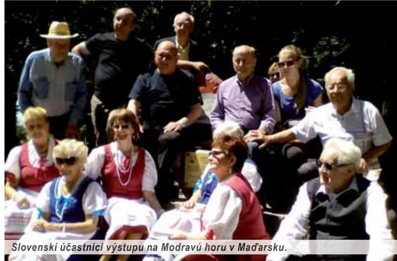
Slovenskí účastníci výstupu na Modravú horu v Maďarsku.

Členovia Miestneho odboru Matice slovenskej v Jarovciach spolu s ďalšími Slováckmi vystúpili už šiestykrát na vrch Matra v severnej časti Maďarska. Spolu s ďalšími občanmi z viacerých končín Slovenska vystúpili na tisíc metrov vysokú Modravú horu (Kekestető), najvyšší vrch tohto pohoria. S myšlienkou organizovať výstup na Matru prišiel bývalý slovenský premiér Ján Čarnogurský, v súčasnosti predseda Slovensko-ruskej spoločnosti. Aj to je podľa neho spôsob, ako priblížiť najmä mladým ľuďom naše dejiny, zdôraznil pre SNN.