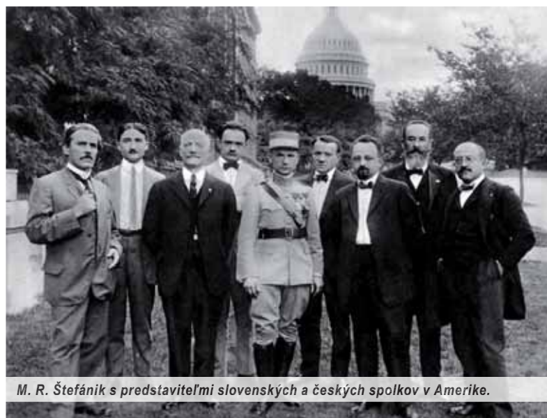
M. R. Štefánik s predstaviteľmi slovenských a českých spolokov v Amerike.

M. R. Štefánik síce zahynul mladý, ale národ naň nikdy nezabudol. Zostal symbolom nezištnej práce pre národ, symbolom odevnosti a obety, ktorú nemohlo vo vedomí národa odstrániť ani štyridsaťročné vymývanie mozgov. Národ sa k nemu prihlásil vždy, keď sa siahlo na jeho slobodu alebo ju bolo treba vybojovať.