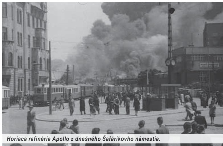
Horiaca rafinéria Apollo z dnešného Šafárikovho námestia.

nených bolo asi tridsaťšesť osôb. Po nálete zhorela stolárska dielňa, podnikový bufet, jedáleň, ošetrovňa i sklady, poškodená bola vodovodná, elektrická sieť i cesty. Výrobné prevádzky pod zemou neboli neohroziť.