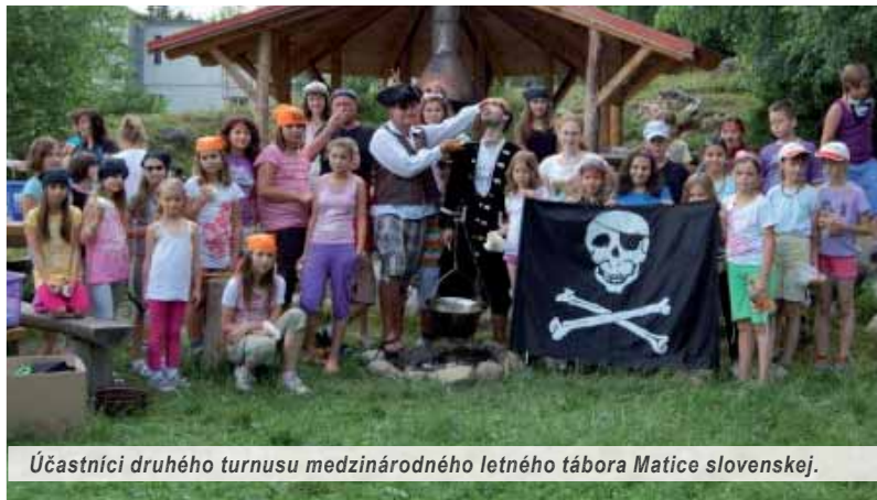
Účastníci druhého turnusu medzinárodného letného tábora Matice slovenskej.

Vo Vysokých Tatrách sa uprostred júla začal druhý turnus medzinárodného letného tábora Matice slovenskej. V Škole v prírode Detský raj v Tatranskej Lesnej príjemne strávi časť prázdnin stovka detí. Matica slovenská nim naplní časť svojho programu a tábor patrí k tradičným matičným aktivitám.