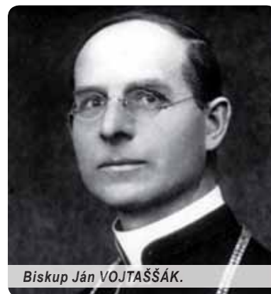
Biskup Ján VOJTAŠŠÁK.

Úsilie o prinavrátenie oravských a spišských obcí do Spišskej diecézy