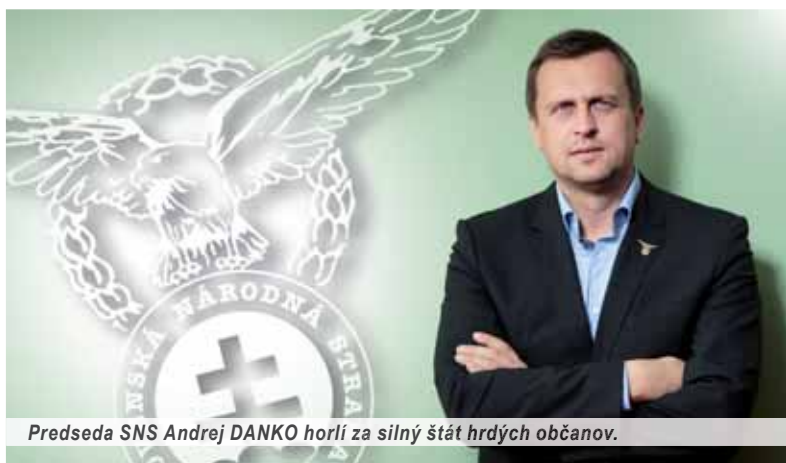
Predseda SNS Andrej DANKO horlí za silný štát hrdých občanov.

Slovenská národná strana začiatkom júna na východe Slovenska prijala vo svojom predsedníctve Košické programové tézy pre Slovensko. Sú to tézy, ktoré budú základom na vytvorenie volebného programu pre parlamentné voľby v roku 2016. Motto, ktoré uvádza tézy, znie: Naša vlasť si zaslúži viac! Úvodnou vetou k vyhláseniu je konštatovanie, že silný štát a hrdý občan tvoria úspešné Slovensko. K aktuálnemu smerovaniu strany a k témam, ktoré sú v tézach rozpracované, sa podrobnejšie vyjadril Andrej DANKO, predseda SNS.