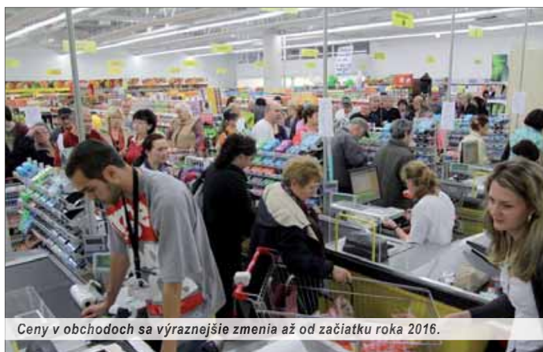
Ceny v obchodoch sa výraznejšie zmenia až od začiatku roka 2016.

Podľa slov premiéra R. Fica má byť návrh zákona o znížení DPH na