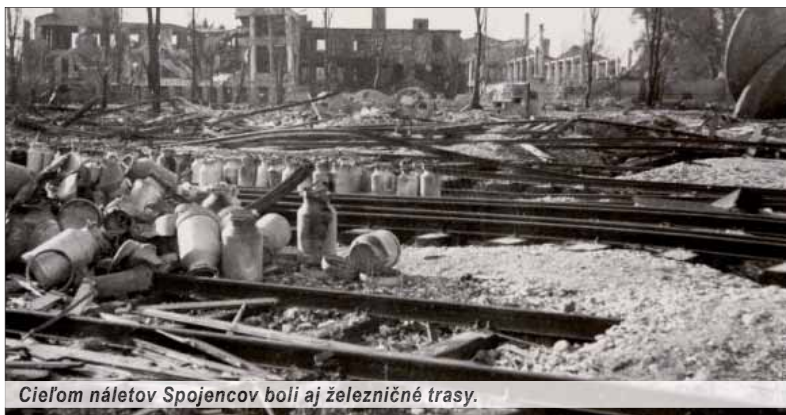
Cieľom náletov Spojencov boli aj železničné trasy.

Vyššie šesťsto amerických bombardérov vyštartovalo 22. augusta 1944 na vybrané rafinérie na území Nemecka.