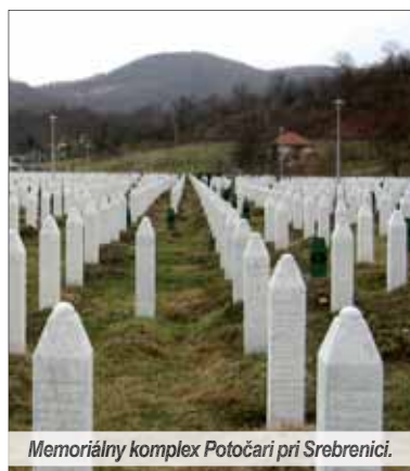
Memoriálny komplex Potočari pri Srebrenici.

Dvadsaťte výročie srebrenickej tragédie spreádzali nahromadené vášne aj politizácia, ktoré neprispeli k procesu zmierenia národov bývalej Juhoslávie. Štartérom napätia bola britská snaha presadiť v bezpečnostnej rade OSN návrh rezolúcie o Srebrenici, ktorá bola údajne motivovaná záujmom o zmierenie na Balkáne. O čestných úmysloch Veľkej Británie môžeme mať svoju mienku, isté je len to, že touto iniciatívou sa dosiahol presný opak. V pôvodnom návrhu sa ani slovom nespomenuli zločiny spáchané na Srboch, ktoré predchádzali vraždeniu v Srebrenici. Iniciatíva vyvolala zvýšenú srbskú diplomatickú akti-