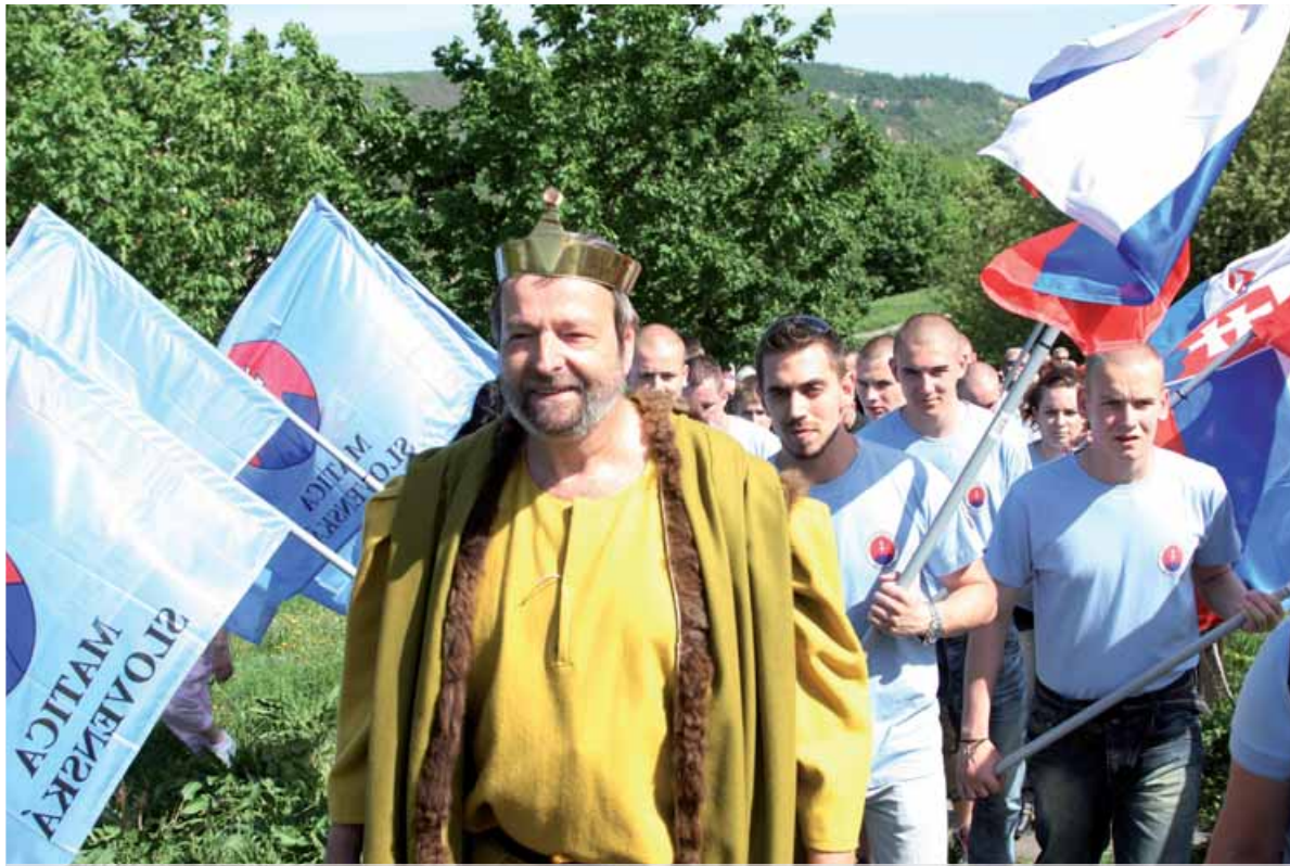
Národnej púte na Devíne, ktorú organizovala Matica, sa týkali aj listy našich čitateľov.

Stranu pripravil: Michal BADÍN - Foto: Ladislav LESAY