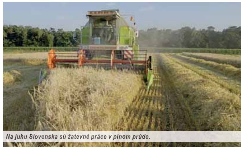
Na juhu Slovenska sú žatevné práce v plnom prúde.

žatiev. Scénických, novinárskych, dokonca už aj burzových, ale žatvu v zmysle zožať zasiat obilie treba hľadať ako ihlu v kope sena. Žatva médiá nezaujima, asi sa na nej nedá zarobiť, či ňou šokovať. Žatva je drina. Koho tá už u nás zaují-