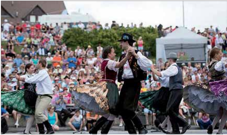
Na pódiu amfiteátra vo Východnej sa vystriedal rekordný počet účinkujúcich.

Už tradične patrí začiatok leta najväčšej oslave folklóru, ľudového tanca, hudby, ale aj zvykov, konkrétne Folklórnemu festivalu vo Východnej, ktorého šesťdesiaty prvý ročník sa konal 2. až 5. júla v tradičných priestoroch amfiteátra a príľahlých priestorov, ktoré sa stali cieľom tisícov návštevníkov z celého Slovenska, ale aj zo zahraničia. Tento rok tak do Východnej prišlo vyše tridsaťtisíc návštevníkov. Tí vo svojich vyjadreniach oceňovali najmä skvelý profesionálny program a príjemný a ústretový prístup organizátorov. Boli nimi už tradične Národné osvetové centrum, Ministerstvo kultúry SR, obec Východná, Žilinský samosprávny kraj a Liptovské kultúrne stredisko.