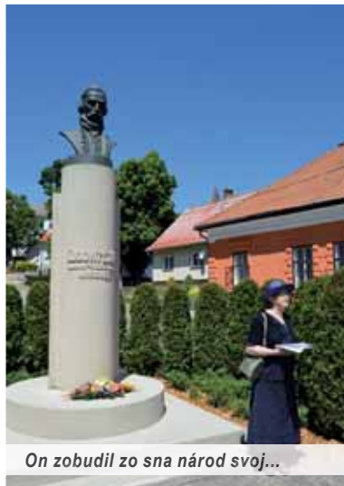
On zobudil zo sna národ svoj...