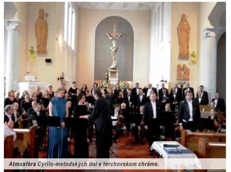
Atmosféra Cyrilo-metodských dní v terchovskom chráme.

V globalizujúcom sa svete a v zjednocujúcej sa Európe (zmientaných nebezpečných turbulencií, ktorých následky môžu byť až nedejné) neustále rastie potreba silného regiónu v národnom celku, aby aj ten mal silu a hodnotu. Opretú o piliere tradícií, ktoré sú minimálne také živé a silné, ako sú Cyrilo-metodské dni v Terchovej. Tým rastie zmysel podujatia a som presvedčený, že sa bude stupňovať. Ostáva nám organizátorom zaželať veľa síl, sponzorov – bez nich by to v nijakom prípade nešlo! – veľa pochopenia a Slovákom pevné srdcia a čisté duše. Aby sa stretli v Terchovej 5. júla 2016 na 27. ročníku Cyrilo-metodských dní.