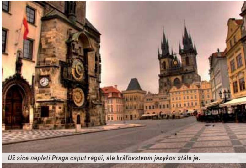
Už síce neplatí Praga caput regni, ale kráľovstvom jazykov stále je.

Jednotný československý jazyk nikdy neexistoval, aj keď tu boli kedysi snahy o jeho vytvorenie a zavedenie do života. Neujalo sa to aj preto, že čeština a slovenčina sú originálne jazyky dvoch národov. Akýsi moderný hybrid česko-slovenčiny však môžeme počuť aj dnes. Kedysi sa hovorilo, že keď pošlete Slováka do Prahy, po troch týždňoch nebude rozprávať, ale začne „mluviť“ s otrasným prízvukom. Nie spisovne po česky, ale pražským dialektom, ktorý za spisovnú češtinu nepovažujú ani Česi. Takto „mluvících“ úradníkov v Prahe označoval pojem „federálni Slováci“. Kto si spomenie na prejavy posledného socialistického a zároveň jediného prezidenta so slovenskou národnosťou v Prahe, normalizátora Gustáva Husáka, vie, o čom je reč. Po česky sa nikdy nenaučil, ale po slovensky zabudol. To isté platilo aj o popre-