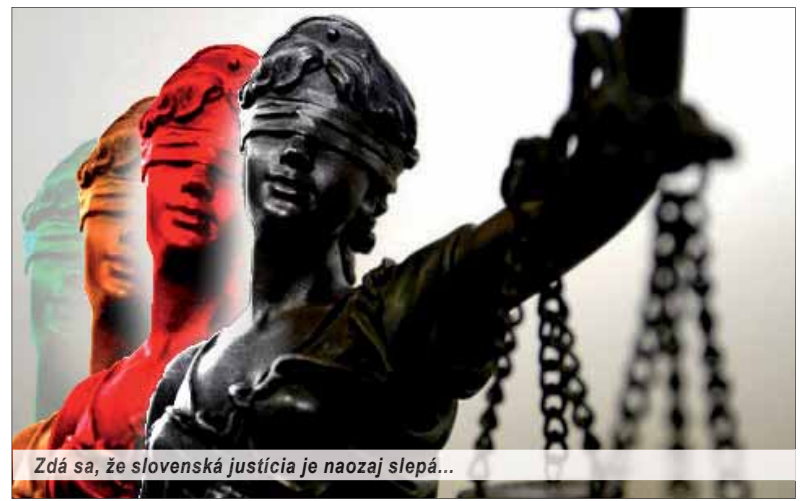
Zdá sa, že slovenská justícia je naozaj slepá...