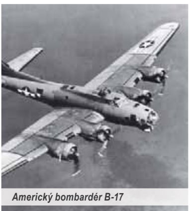
Americký bombardér B-17

Odbor Mladej Matice Veľké Hoste v spolupráci s Obecným úradom, Dobrovoľným hasičským zborom a Ozbrojenými silami Slovenskej republiky a občania tejto obce v okrese Bánovce nad Bebravou si uprostred júna uctili pamiatku mŕtvych členov posádky zostrelého amerického lietadla B-17 v jej katastri pri 70. výročí od tejto udalosti.