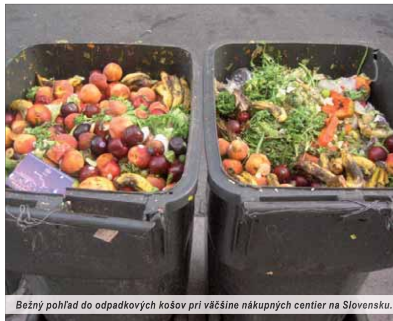
Bežný pohľad do odpadkových košov pri väčšine nákupných centier na Slovensku.

V Európe sa podľa odhadov zlikviduje osemdesiatdeväť milio-