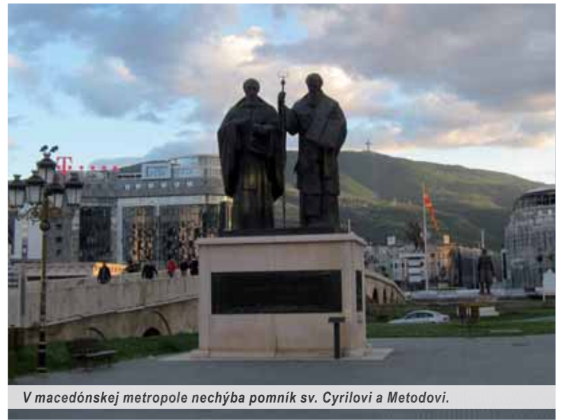
V macedónskej metropole nechýba pomník sv. Cyrilovi a Metodovi.

niť sa na moskovskej vojenskej prehliadke 9. mája 2015. Všetky tieto kroky mohli rozrušiť strážcov správnej cesty Macedónska do EÚ a NATO.