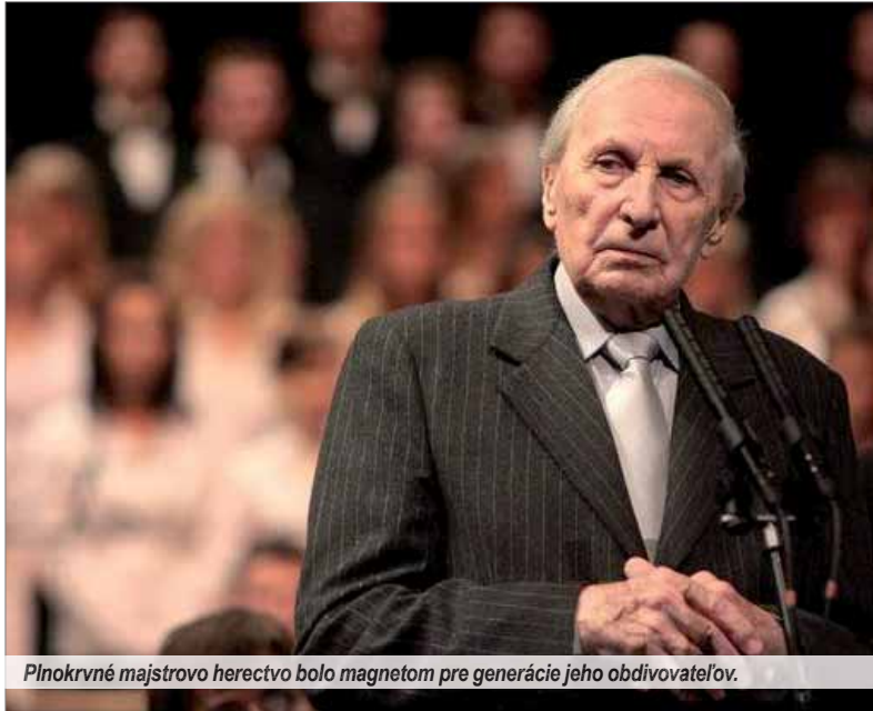
Plnokrvné majstrovo herectvo bolo magnetom pre generácie jeho obdivovateľov.

Dvaja legendárni českí režiséri, divadelný režisér Otomar Krejča a po ňom filmový režisér Otakar Vávra, nazvali Ladislava Chudíka „kniežatom herectva“. Krejča to povedal pri hodnotení Chudíkovej postavy Quentina v Millerovej hre Po páde (premiéra 1964) a Vávra po tom, čo Chudík v dvoch jeho filmoch – Sokolovo (1974) a Oslobodenie Prahy (1976) – stvárnil postavu vtedy ešte žijúceho Ludvíka Svobodu. Generála Svobodu hral Chudík aj vo filme Jurija Ozerova Vojaci slobody (1975). Neskôr stvárnil vo filme Otakara Vávru Putování Jána Amose (1983) titulnú postavu – Jána Amosa Komenského. Jaroslav Dietl, autor doteraz najúspešnejšieho televízneho seriálu Nemocnica na okraji mesta , v ktorom postavu doktora Sovu prevzal Chudík po náhlejši smrti Karla Högra, vyjadril sa o hercovom stvárnení doktora Sovu v tom zmysle, že v plnom rozsahu naplnil jeho predstavu o tejto postave.