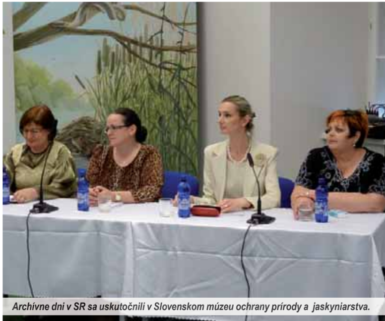
Archívne dni v SR sa uskutočnili v Slovenskom múzeu ochrany prírody a jaskyniarstva.