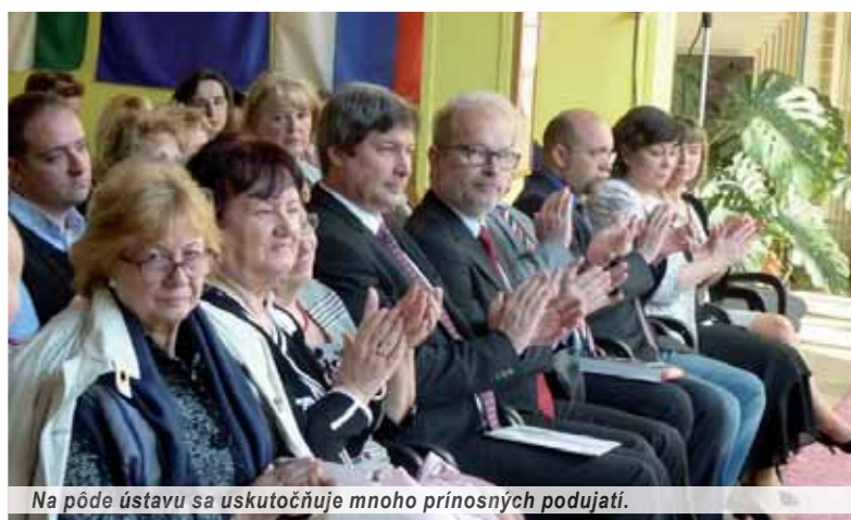
Na pôde ústavu sa uskutočňuje mnoho prínosných podujatí.