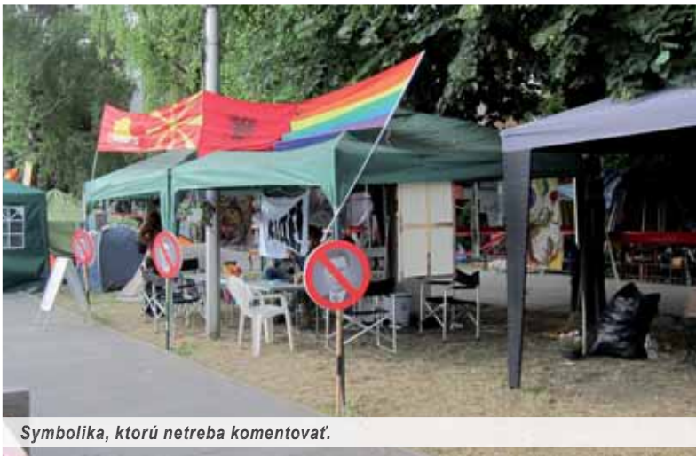
Symbolika, ktorú netreba komentovať.