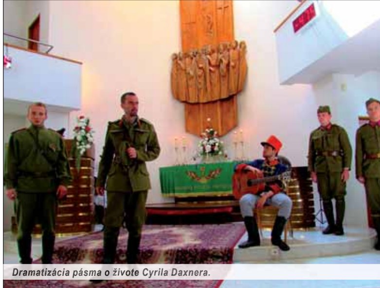
Dramatizácia pásma o živote Cyrila Daxnera.

To, že slovenský národ prežil v dramatickom a neraz aj krvavom virvare Európy najmä v posledných dvesto rokoch, nie je iba výsledkom historickej náhody. V každej dejinnej etape sa našla silná a početná národná generácia, ktorá uchopila kormidlo osudu do vlastných rúk a previedla slovenský ľud cez nastražené pasce a nejasné križovatky európskeho dejinného pohybu. Bolo to však iba preto, že bernolákovci, štúrovci, slovenskí legionári z prvej svetovej vojny a ostatní zakladatelia Česko-Slovenska z roku 1918, nasledovníci M. R. Štefánika, Andreja Hlinku, Martina Rázusa, slovenskí autonomisti, bojovníci Malej vojny 1939, účastníci Slovenského národného povstania z roku 1944, neskôr vlastenecká generácia ľavicových intelektuálov reprezentovaná davistami, predstaviteľom politickej jari Alexandrom Dubčekom a mnohí ďalší národovci rôznej politickej orientácie vo svojej práci a činnosti mohli budovať na základoch a skúsenostiach svojich predchodcov, čo niesli a živili sen o svojom národnej budúcnosti. Nevyhnutne musíme pokračovať vo vytváraní podmienok, aby sme mali aj v súčasnosti vedomosťami vyzreté a rozhladené osobnosti, ktoré nás prevedú cez rozporupnosť súčasnej doby.