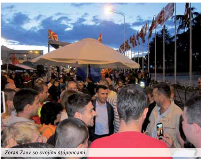
Zoran Zaev so svojimi stúpenkami.