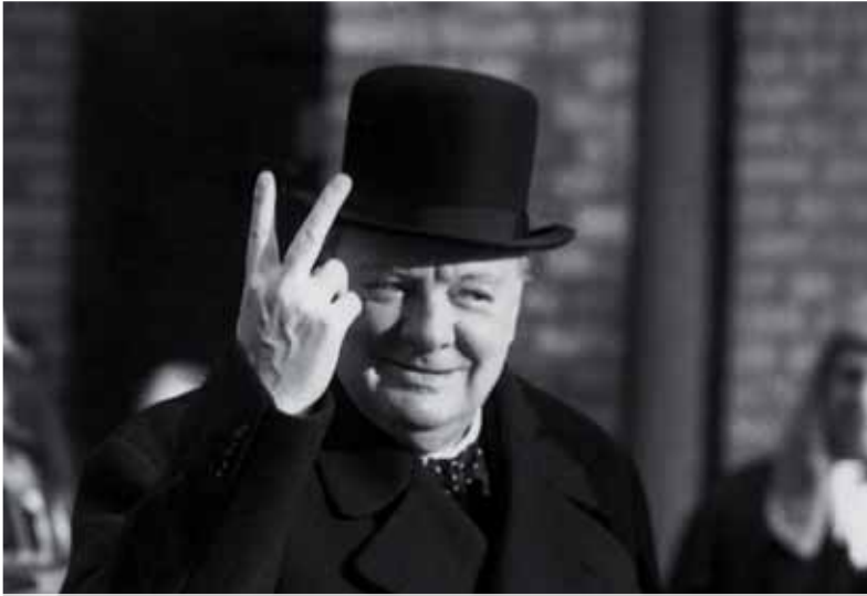
Winston Churchill so svojim povestným gestom.

Dvadsiateho štvrtého januára si vystúpeniami popredných politikov prinajmenšom celá Európa pripomenula päťdesiate výročie úmrtia významného britského štátnika sira Winstona Leonarda Spencera CHURCHILLA. Vo všetkých spomienkových rečiach na tohto významného britského politika sa kládol dôraz najmä na jeho pôsobenie vo funkcii predsedu vlády Veľkej Británie v čase druhej svetovej vojny a na jeho osobné zásluhy na vojnovéj porážke nacistického Nemecka. Česká televízia dokonca opakovane odvysielala veľmi podrobný francúzsky životopisný film o Churchillovi z dielne Roche Production v trvaní takmer hodiny, ktorý sa niesol v rovnakom oslavnom duchu.