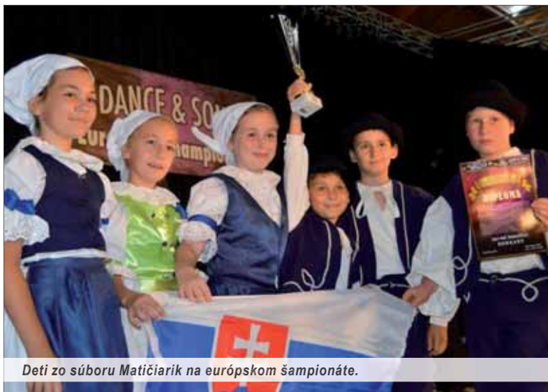
Deti zo súboru Matičiariar na európskom šampionáte.