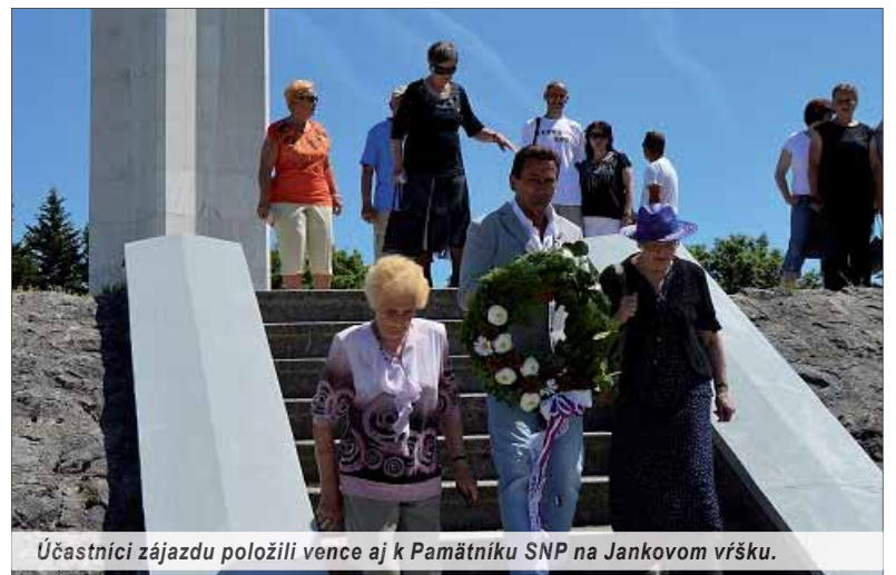
Účastníci zájazdu položili vence aj k Pamätníku SNP na Jankovom vršku.