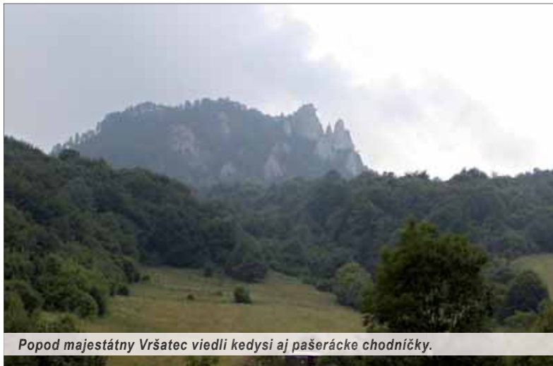
Popod majestátny Vršatec viedli kedysi aj pašerácke chodníčky.