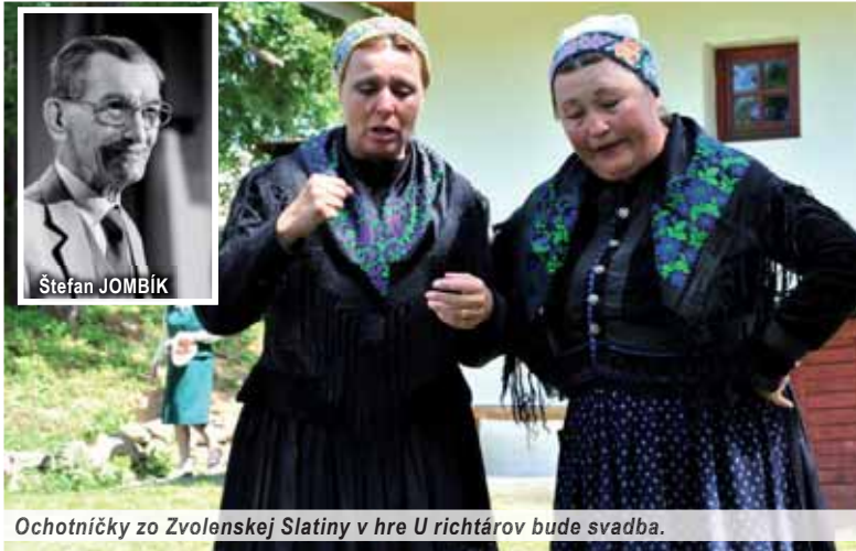
Ochotníčky zo Zvolenskej Slatiny v hre U richtárov bude svadba.