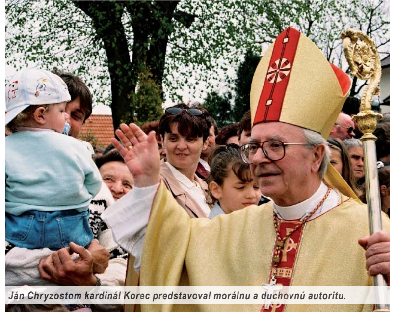
Ján Chryzostom kardinál Korec predstavoval morálnu a duchovnú autoritu.

Azda najznámejším národne uvedomelým kardinálom slovenského pôvodu bol Alexander Štefan Rudnay de Rudnó et Divékuj-