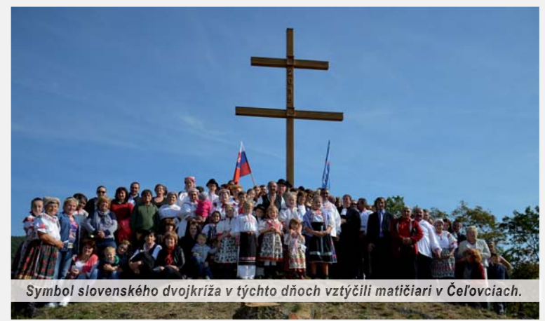
Symbol slovenského dvojkríža v týchto dňoch vztýčili matičiari v Čelovciach.