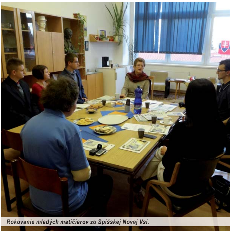
Rokovanie mladých matičiarov zo Spišskej Novej Vsi.