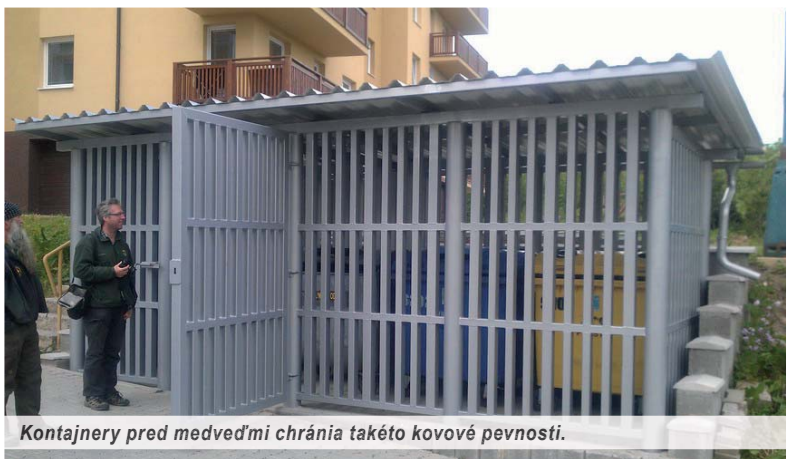
Kontajnery pred medvedmi chránia takéto kovové pevnosti.

medvedmi. Mestská polícia Vysoké Tatry eviduje aj niekoľko sťažností od podnikateľov a hotelierov, ktorí tiež žiadajú problémy s medvedmi riešiť. Každú chvíľu môže dôjsť k stretu medveďa s človekom. Ľudia sú obmedzovaní vo voľnom pohybe, keďže sa obávajú o svoje zdravie a životy, obyvatelia tatranských osád po zotmení radšej nevychádzajú z bytov a domov.