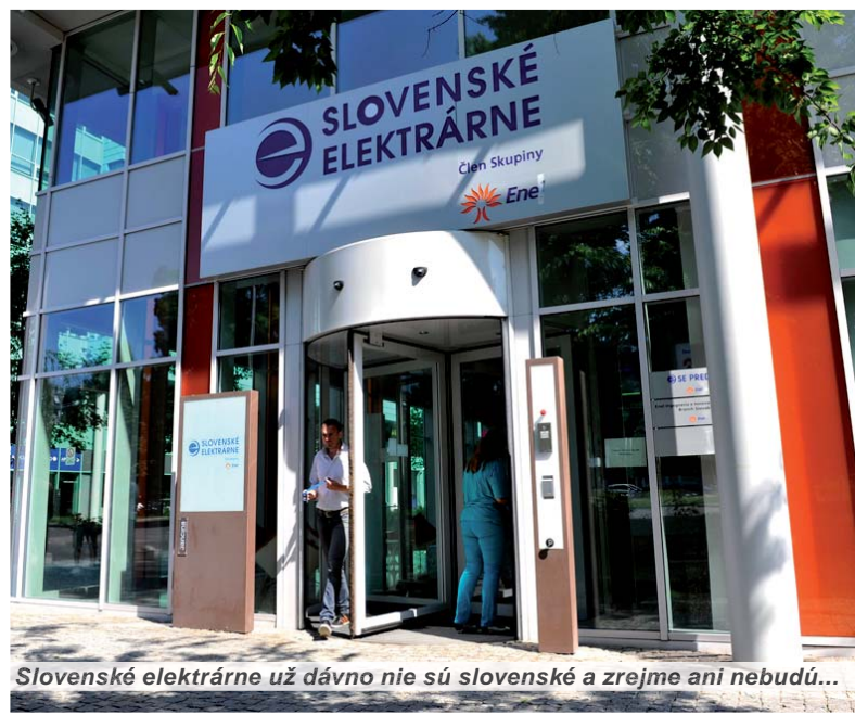
Slovenské elektrárne už dávno nie sú slovenské a zrejme ani nebudú...

„Mám informáciu, že taliansky Enel chce predat' svoj podiel v dvoch fázach. Našou prioritou je iba dostavba Mochoviec, všetko ostatné je interná záležitosť Enelu. Ak však dôjde k prvej etape predaja tridsiatich troch percent akcií zo strany Enelu, tak určite budeme chcieť mať opciu na sedemdesiat percent akcií, pokiaľ bude dostavaný tretí a štvrtý blok,“ povedal na tlačovej besede predseda vlády Robert Fico. Tým by sa navýšil podiel štátu v Slovenských elektrárnach na krehkých, ale rozhodujúcich päťdesiatjeden percent.