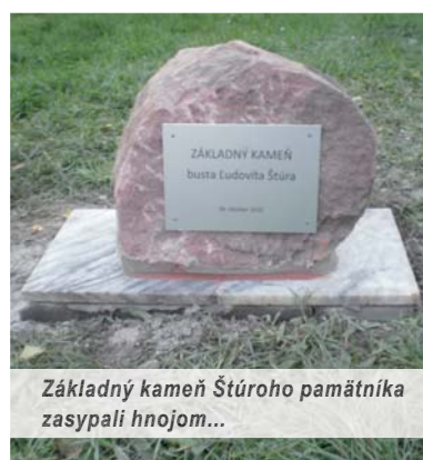
Základný kameň Štúroho pamätníka zasypali hnojom...

„Matica slovenská protestuje proti takejto netolerancii príslušníkov maďarskej národnosti, keďže je za spoluprácu a priateľské spolužitie Slovákov a všetkých občanov našej vlasti. Protestujeme aj proti zrejmemu nekonaniu si povinností zo strany príslušníkov štátnej i mestskej polície. Osobitne nás mrzí, že to všetko sa udialo presne v deň dvojstého výročia narodenia veľikána slovenského národa Ľudovíta Štúra v Roku Ľudovíta Štúra vyhláseného vládou Slovenskej republiky. Matica slovenská sa v tejto veci obráti na príslušné štátne