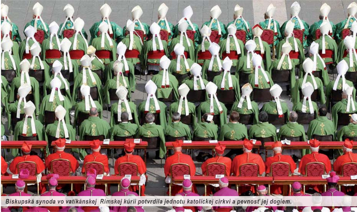
Biskupská synoda vo vatikánskej Rímskej kúrii potvrdila jednotu katolíckej cirkvi a pevnosť jej dogiem.

Biskupská synoda o rodine sa začala vlni na jeseň a pokračovala po ročnej prestávke. Prijatím záverečnej správy sa skončila aj polemika predovšetkým mimo cirkvi. Živil ju niektorí liberálne orientovaní cirkevní hodnostári, najmä z Nemecka a Talianska. Tí požadovali nový prístup k rozvedeným a znovu zosobášeným manželom. Kardinál Reinhard Marx sa vyjadril, že je nerealistické, aby sa znovu zosobášeni rozvedení zdržali sexuálnej aktivity. Podľa neho je nutné posudzovať túto aktivitu v kontexte doby, v ktorej žijeme.