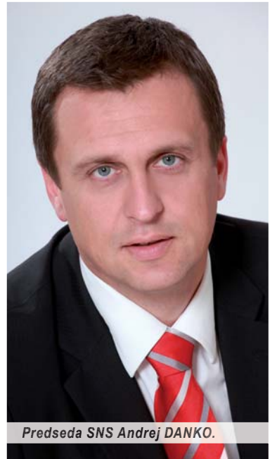
Predseda SNS Andrej DANKO.

Nechcem urážať spoločnosť Energetický a priemyslový holding (EPH), ale myslím si, že nemajú také skúsenosti, personálne a riadiace ani štrukturálne, aby mohli zodpovedať za päť miliónov ľudí na území Slovenska v energetike. Nemôžu riadiť aj plynárenstvo, aj energetiku, aj distribúciu, aj výrobu energií, pretože sú tu aj iné spoločnosti, ktoré potrebujú ochranu. Bude totiž dochádzať k zvyhodňovaniu ich spoločností na trhu. Ak niekto ovládne výrobu energie, distribúciu a ešte ovládol plynárenský