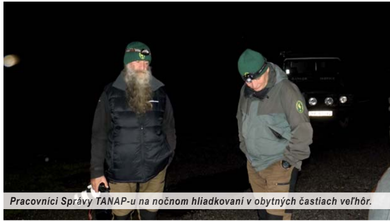
Pracovníci Správy TANAP-u na nočnom hliadkovaní v obytných častiach veľhór.

Medvede robia najväčšie problémy v Tatranskej Kotline a vo vedľajšej Tatranskej Lomnici, kde sa pohybujú prakticky všade po svojich vlastných naučených trasách. V Smokovcoch sa pohybujú takisto po všetkých osadách od jedného objektu k druhému. Ďalšou lokalitou sú Vyšné Hágy. Na jedno miesto sa počas noci dostavia na lumpovanie aj viaceré skupinky „macíkov“. Obyvatelia Tatranskej Lomnice a Horného Smokovca už spísali petície na riešenie problému s premnoženými