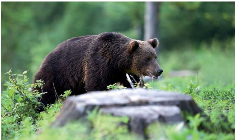
Legislatívna ochrana medveďa hnedého prináša aj množstvo problémov.