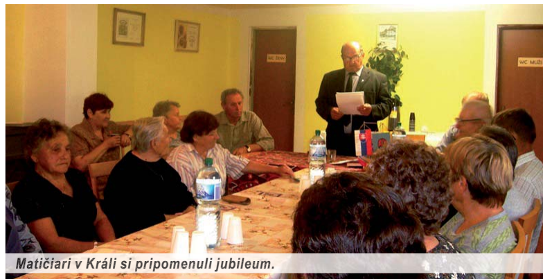
Matičari v Králi si pripomenuli jubileum.

Jubileu organizácie bola venovaná aj prehliadka spevokolov Rimavského seniorátu Evanjelickej cirkvi a. v. na Slovensku začiatkom októbra v miestnom evanjelickom kostole. Na prehliadke vystúpilo osem telies, v ktorých účinkovali speváci a speváčky z obcí Budikovany-Drienčany, Gemer, Hnúšťa, Hrachovo, Klenovec, Kokava nad Rimavicou, z Rimavskej Soboty a domáci spevokol.