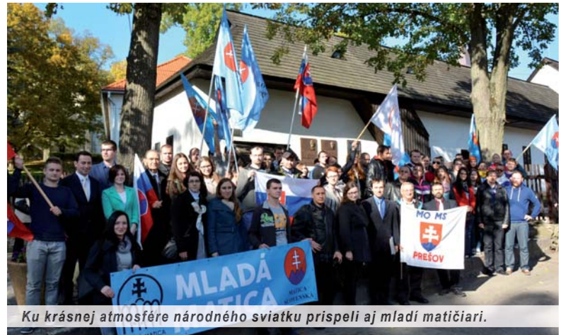
Ku krásnej atmosfére národného sviatku prispeli aj mladí maticári.

„Keď bolo treba, aby si ľudia na území Uhorska, ktorí boli Slovákmi, porozumeli, tak sa postavil za spisovnú slovenčinu. Keď chcel dať dohromady roztratené ostrovy Slovákov, prišiel so Slovenskými národnými novinami. Ak to bolo málo, išiel do uhorského snemu a tam bojoval ako významný politik. A ak aj to bolo málo, zobral do ruky zbraň a bol jedným z vodcov v meru smych rokoch 1848 – 1849.“