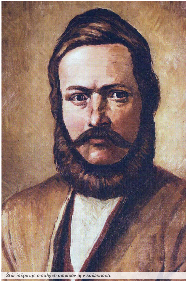
Štúr inšpiruje mnohých umelcov aj v súčasnosti.

V septembri v roku 1838 odišiel na dva roky na univerzitu do Halle. Doplniť si vzdelanie. Cestou do Nemecka sa zastavil v Prahe. Bol hosťom u Pavla Jozefa Šafárika, ktorý mu dal odporúčanie jazykovedcovi Augustovi Fridrichovi Pottovi. Štúr v Nemecku podnikol i cestu územím Lužických Srbov, počas ktorej nadviazal styky s predstaviteľmi malého