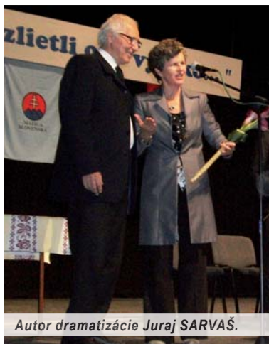
Autor dramatiky Juraj SARVAŠ.