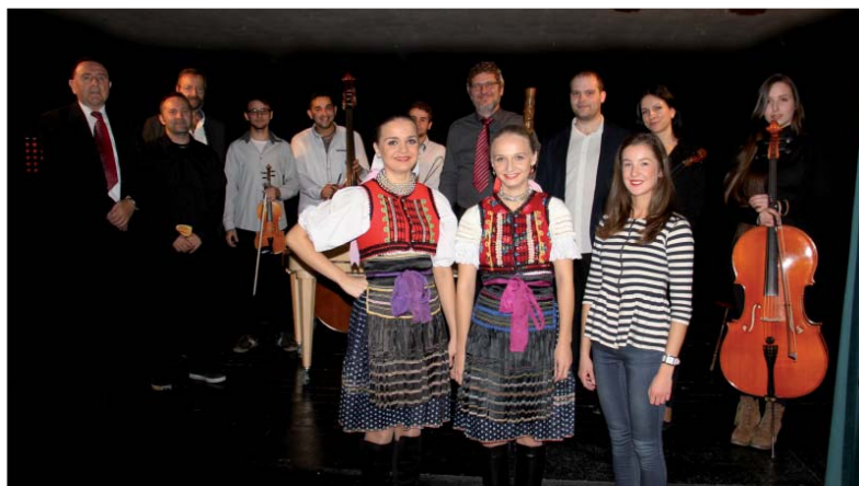
Predstavitelia Matice slovenskej v Konzervatóriu J. Adamoviča v Košiciach.