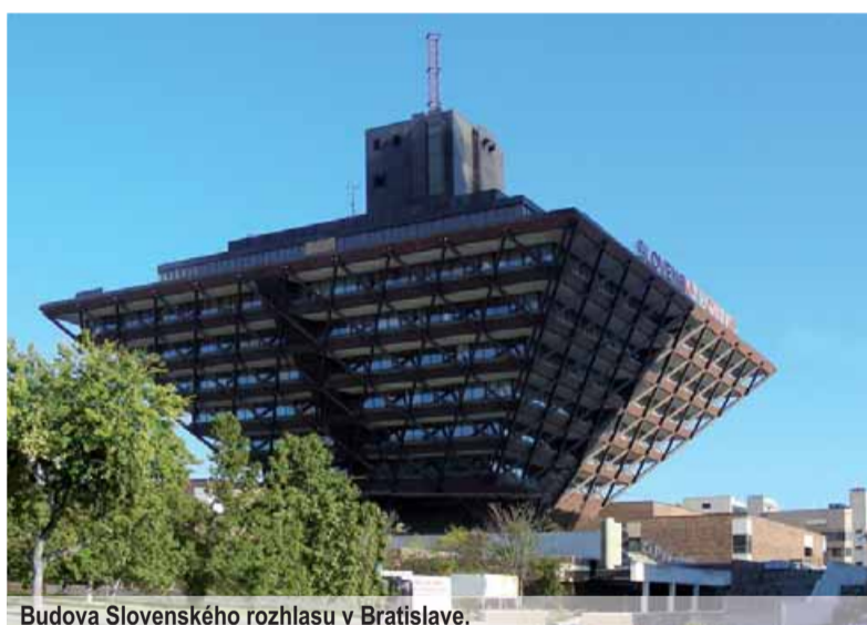
Budova Slovenského rozhlasu v Bratislave.