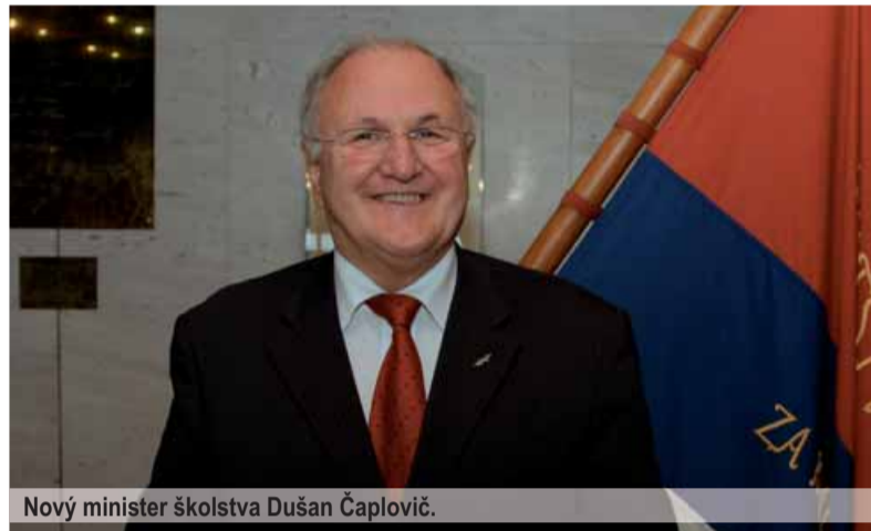
Nový minister školstva Dušan Čaplovič.

„Nebude to ľahká úloha, pripomínam, ak by sa tento cieľ dostal opäť na druhý koľaj, tak nie je možné urobiť v školstve, vo vede, vo výskume a v športe profesionálnu modernizáciu s jasným pozitívnym dosahom na zmeny v našej spoločnosti,“ uzavrel D. Čaplovič.