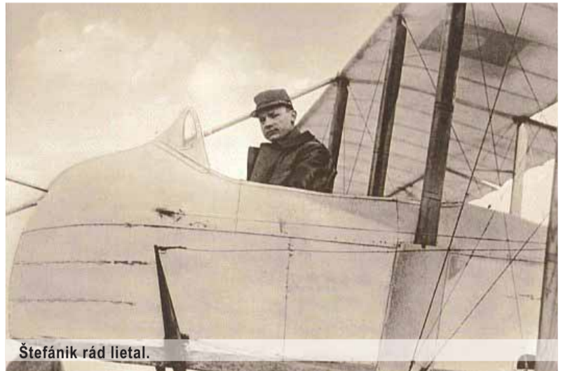
Štefánik rád lietal.

Lenže USA v čase zasadania v novembri 1919 už neboli členom Ligy národov, takže žiadne námietky nemohli na rokovaniach nadniesť. Navyše, náš generál už nebol medzi živými. Stephen Bonsal vo svojom svedectve dodal: „V závere chcem zdôrazniť, že manželstvo na skúšku vstúpilo do platnosti iba na naliehanie americkej delegácie, ktorá verila, že organizovanie federálneho Česko-Slovenska v skutočnosti už prebiehalo a všetky prípadné nezrovnalosti sa budú korigovať počas budúceho zasadania mierovej konferencie v Paríži. Nádejám sa, že Slovákom svitne deň vypočutia a všetky prisľuby im dané v Paríži a zaručené prezidentom Wilsonom sa uskutočnia.“