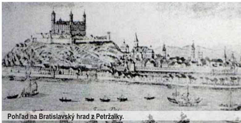
Pohľad na Bratislavský hrad z Petržalky.

V posledných desaťročiach 19. storočia sa významy slov Uhor a Maďar definitívne odlišili a v súčasnej slovenčine sa slová Uhor, Uhry, Uhorsko, uhorský používajú iba ako historizmy súvisiace s existenciou štátneho útvaru do roku 1918. Naopak slová Maďar, Maďarsko, maďarský a celá bohatá čelaď odvodovaných slov sa spájajú s etnicitou novodobého maďarského národa a existenciou maďarského štátneho útvaru po roku 1918.