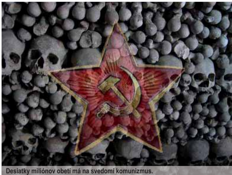
Desiatky miliónov obetí má na svedomí komunizmus.

Nepochybne sú to významné pojmy. Označujú najvýraznejšie politické štruktúry a ich ideologické základy, ktoré charakterizovali najmä v Európe uplynulé 20. storočie. No v ich bežnom používaní aj v našom slovenskom jazyku sa odráža nejasnosť, nepresnosť a popletenosť, ktorá neraz zapríčiňuje až myšlienkový a hodnotiaci chaos.