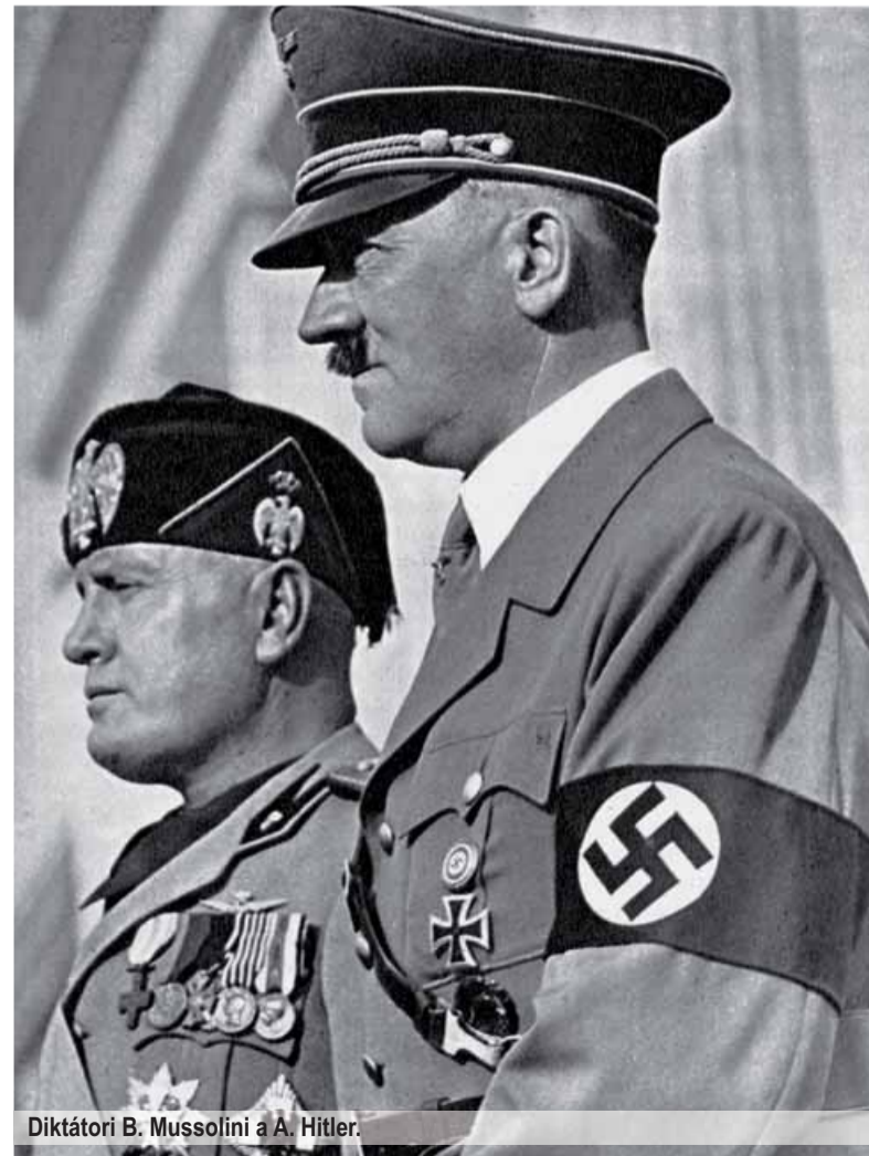
Diktatóri B. Mussolini a A. Hitler.