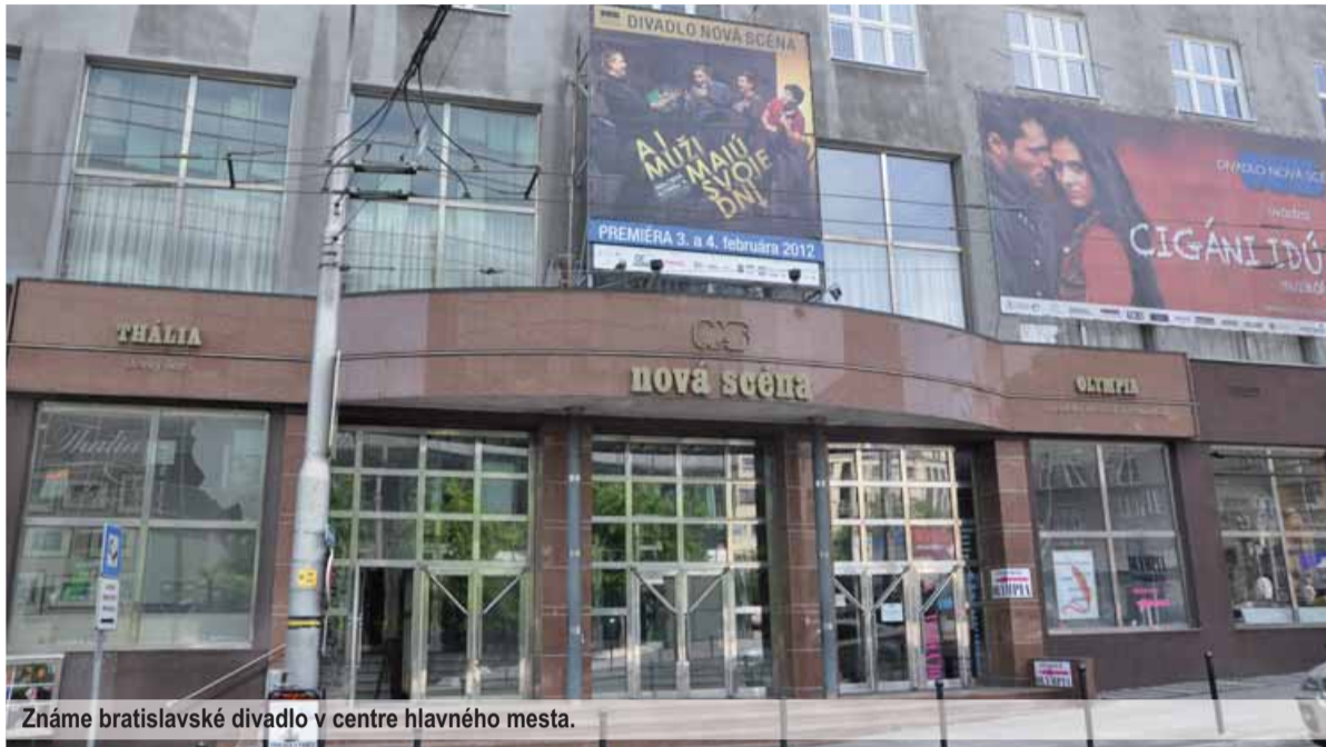
Známe bratislavské divadlo v centre hlavného mesta.

Bratislavské Divadlo Nová scéna zažilo hviezdne časy aj obdobia tápania. Keď sme nedávno v SNN písali o výstave k jeho 65. výročiu založenia, končil sa článok priánim, aby nadviazalo na svoju slávnú tradíciu z čias prvých pôvodných slovenských muzikálov, rozšantených operiet a spevohier, v ktorých okrem iných hercov excelovali aj Július Satinský a Milan Lasica.