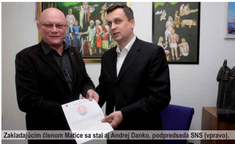
Zakladajúcim členom Maticy sa stal aj Andrej Danko, podpredseda SNS (vpravo).