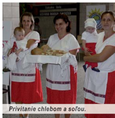
Privítanie chlebom a soľou.

Podnetom na uskutočnenie tohto podujatia bola a je pre Maticu slovenskú skutočnosť, že najmladšia generácia veľmi málo pozná zvyky a tradície našich predkov. Treba dúfať, že žiaci si z tohto dňa niečo zapamätali