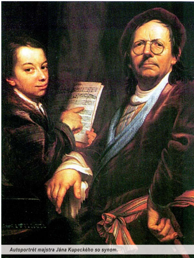
Autoportrét majstra Jána Kupeckého so synom.

– Začal počítať od deväťadvadsiatich nahor. Dvadsaťdeväť, tridsať, tridsaťjeden... a ďalej, vyššie a vyššie. Keď bol pri päťdesiatke, zastal a zronene zašepkal: „Nevládzem ďalej... Nemôžem to spočítať.“ Bolo ich vyše tisíc... dobre vyše tisíc. A tí, čo sledo-