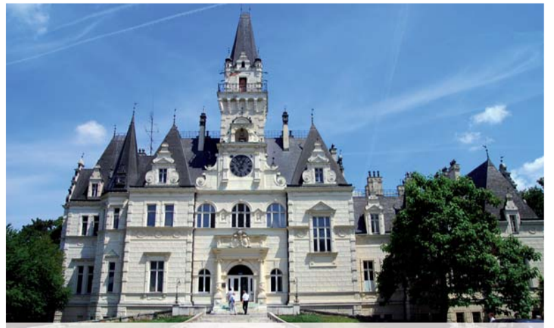
Romantizujúci kaštieľ v Budmericiach roky slúžil slovenským spisovateľom.