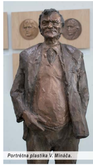
Portrétna plastika V. Mináča.

Kým sami vojdete do Galérie Jána Kulicha vo Zvolenskej Slatine, ktorá býva otvorená s výnimkou pondelkov celú popoludnia, ostanem na jej nádvorí. Na okraji galerijného priestoru (ale bytostne rovno zo srdca autora) je súsošie jeho otca a matky. Pravda, aj tento motív sa dá mediálne spochybníť, rodina v súdobých globalizačných stratégiách sa dostáva na vedľajšiu koľaj. Ale stačí si vybaviť chlapeckú postavu sochára sediaceho v charakteristickom klobúku na lavici pred pódium detvianskeho amfiteátra a usilovne skicujúceho dynamické výjavy zo života ľudí v Podpoľaní a iných častiach Slovenska. Vyjavia sa nám všeludské hodnoty, podporované životaschopnou silou mužov a žien, a sebavedomie ich súčasných potomkov. Teraz je výsostne na nich, či sa budú aktívne starať o pretrvávanie toho, čo sa dlhodobo označuje ako tradícia, alebo ľahostajne zveria svoju budúcnosť virtuálnym prísľubom krytým (nateraz) povrchnými konzumnými ponukami.