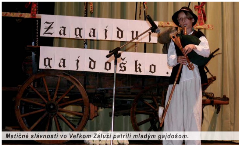
Matichné slávnosti vo Veľkom Záluží patrili mladým gajdošom.