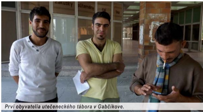
Prví obyvatelia utečeneckého tábora v Gabčíkove.

Potom migranti začali prúdiť do Chorvátska, lebo Maďarsko jednostranne uzavrelo južnú časť svojich hraníc, kadiaľ sa dovtedy utečenci hromadne cez Srbsko presúvali na západ. Chorvátska polícia v stredu 16. septembra oznámila, že do krajiny vstúpilo