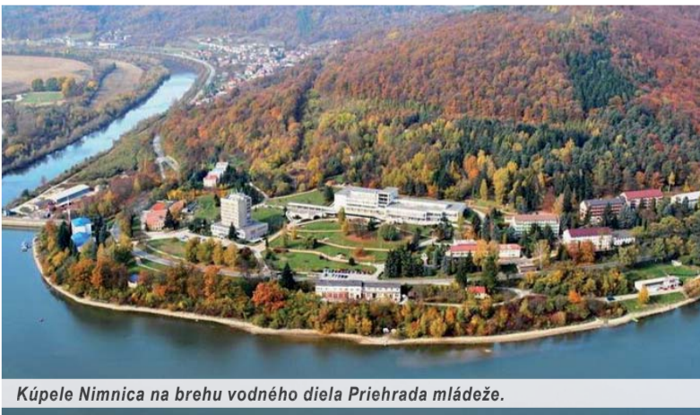
Kúpele Nimnica na brehu vodného diela Priehrada mládeže.

Text a foto: (se) – Z podkladov Ladislava FÁBRYHO