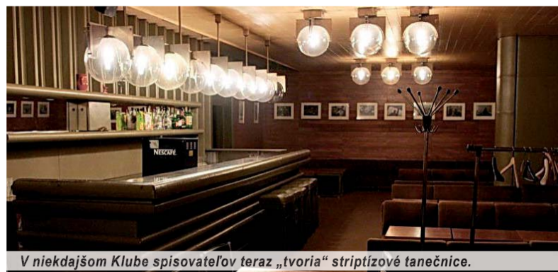
V niekdajšom Klube spisovateľov teraz „tvoria“ striptízové tanečnice.

Keď sme spomenuli problematický kredit slovenských spisovateľov, tak ten vznikol aj pre neustále úsilie istých médií vykresliť našu spisovateľskú scénu ako požívačnú kompá-