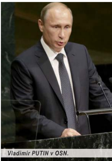
Vladimír PUTIN v OSN.

Pod zástavami takzvaného Islamského štátu už bojujú desiatky tisíc bojovníkov. Medzi nimi sú bývalí irackí vojaci, ktorí po invázii do Iraku v roku