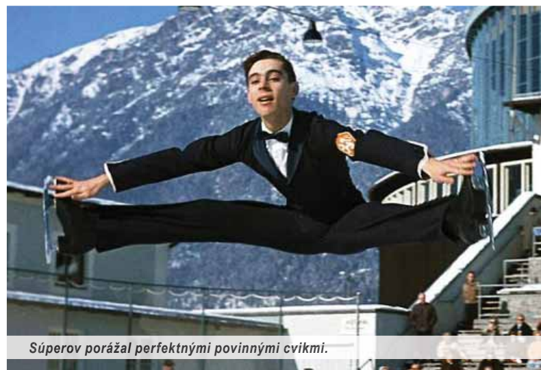
Súperov porážal perfektnými povinnými cvikmi.

Bol to vyslovene športový chalan, s nedostatkom improvizácie, jeho telo akoby nemalo dosť citu pre rytmus, akoby v ňom chýbalo trochu „Brazilčana“, Róma či tanečníka niekde z Burundi. O to viac si zasvätení odborníci cenili jeho výkony.