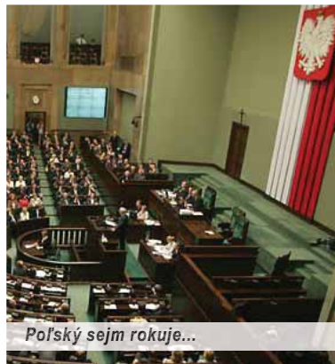
Poľský sejm rokuje...

Preto na jednej strane rastie tlak na otvorenie možností skúmať na európskej úrovni dodržiavanie zásad právneho štátu. Na druhej sa množia mediálne tvrdenia, že „mocipáni vo Varšave sa dostali do podozrenia,