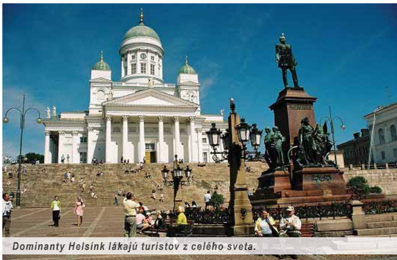
Dominanty Helsínk lákajú turistov z celého sveta.

Kaviareň prevádzkujú starší ľudia, podľa nášho odhadu aspoň šesťdesiatroční a viac. Ešte aj robotníci, ktorí sem s rebrikom na pleciach zamierili čosi opravovať,