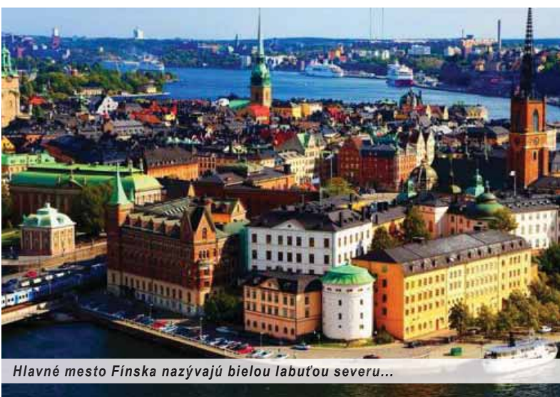
Hlavné mesto Fínska nazývajú bielou labuťou severu...

vať, mali hlavy pokryté sniežikom. A verte mi, títo kaviarenski oldies mali neveriteľný šarm a v päťach im kráčať obrat a úspech! A to v čase našej návštevy koncom leta nemali v prevádzke ešte ani len registračnú pokladňu, a už vôbec nie terminál na kreditky, ktorý vo Fínsku nájdete naozaj všade. Zato sa im však neustále plnili priestory hosťami a prostý linajkový zošitok na bočnom stolíku chválami a uznaním!