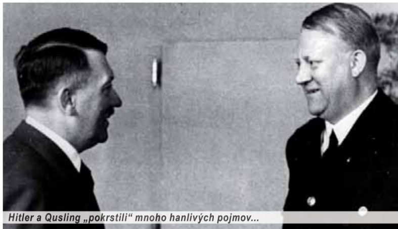
Hitler a Quisling „pokrstili“ mnoho hanlivých pojmov...

Nesmieme však všetkých hádzat do jedného vreca. Malý štát vždy patril do nejakej veľmocenskej sféry ako jej vazal, a teda aj nemnohí prezidenti a predsedovia vlád nášho mladého