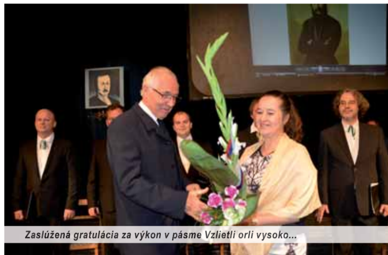
Zaslúžená gratulácia za výkon v pásme Vzlietli orli vysoko...