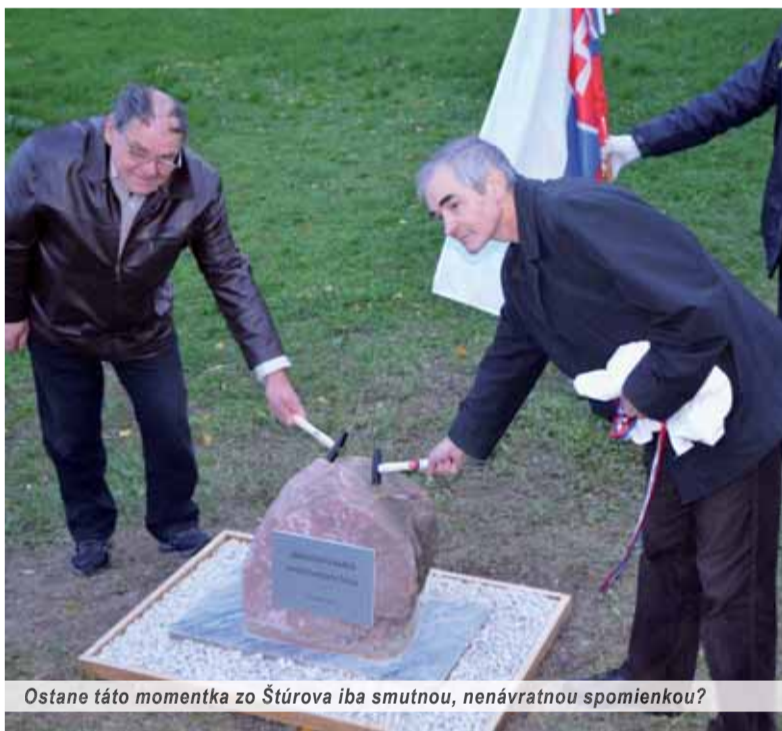
Ostane táto momentka zo Štúrova iba smutnou, nenávratnou spomienkou?

„Pri príležitosti Roku Ľudovíta Štúra, v čase dvojstého výročia jeho narodenia, ale aj vo vzťahu k výtvarnému stvárneniu rôznych podôb a života tejto pokrokovej, neobjanej slovenskej osobnosti žiada sa mi vyjadriť vlastný postoj k tomuto