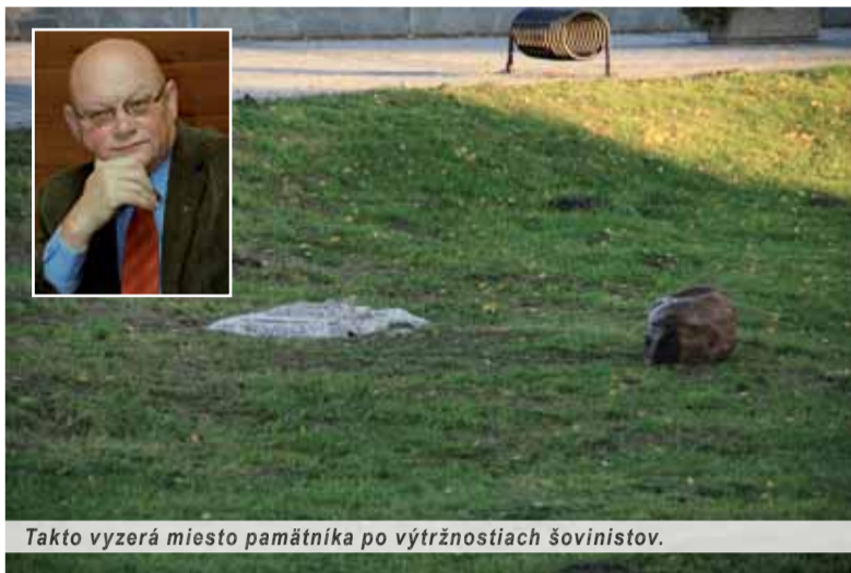
Takto vyzerá miesto pamätníka po výtržnostiach šovinistov.

Nuž typický nerozumný stranícky postoj, ktorý zďaleka nepatrí na pôdu samosprávy! Každý primátor by predsa mal – a to bez ohľadu na stranické tričko – obhajovať záujmy všetkých svojich občanov! Ale zásadná otázka: to