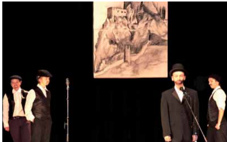
Dramtizácia o Štúrovom živote v programe Matičného večera v Žarnovici.