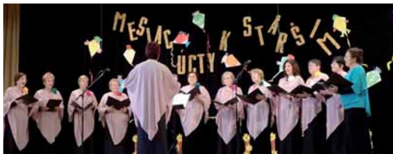
Kysačanka pri slávnostnom koncerte k štyridsiemu výročiu vzniku zboru.

Som vďačný osudu, že mi dožičil pred rokmi stretnúť sa s nezvyčajným amatérskym umeleckým telesom a hneď na prvých koncertoch sa natrvalo zaľúbiť do krásy ženského zborového spevu Kysačanky z malebnej obce Kysak v Hornádskej doline neďaleko Košíc.