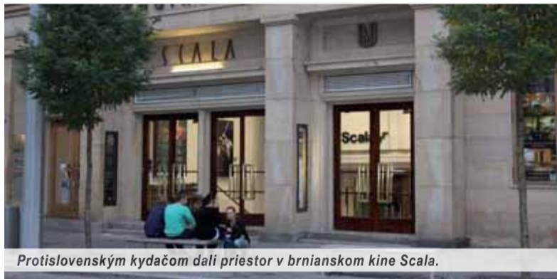
Protislovenským kydačom dali priestor v brnianskom kine Scala.