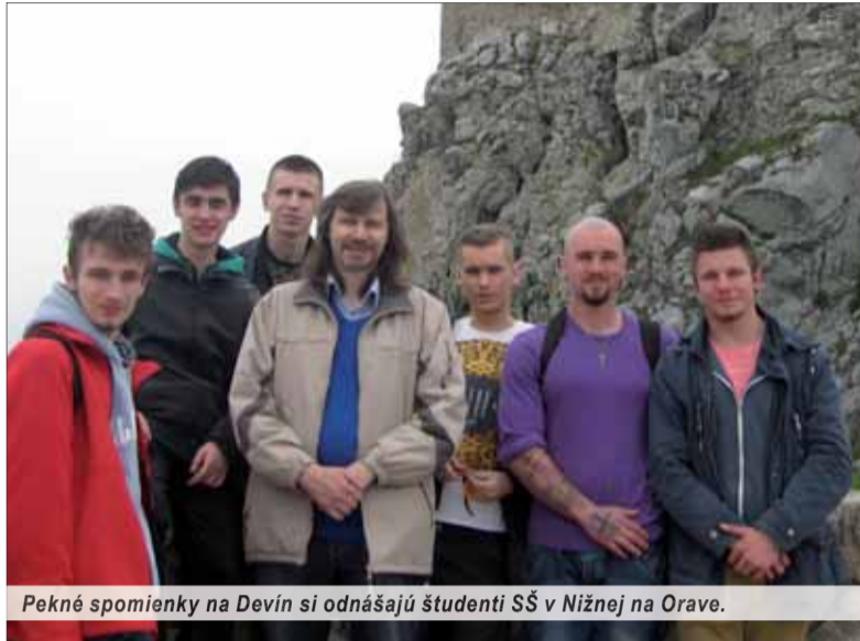
Pekné spomienky na Devín si odnášajú študenti SŠ v Nižnej na Orave.