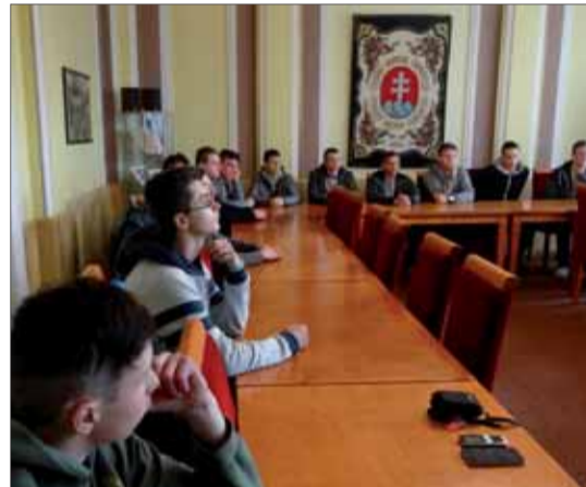
Mladí Popradčania na historickej pôde Matice.