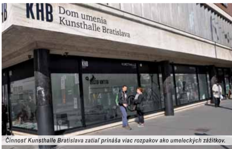
Činnosť Kunsthalle Bratislava zatiaľ prináša viac rozpakov ako umeleckých zážitkov.

Z laického hľadiska je tento presun logickým krokom. Kunsthalle má určite bližšie ku kamen-