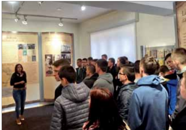
Študentov zaujal aj výklad v Dome Jozefa Cigera Hronského.

Popradskí študenti začali exkurziu návštevou druhej budovy Matice slovenskej, kde ich privítal riaditeľ