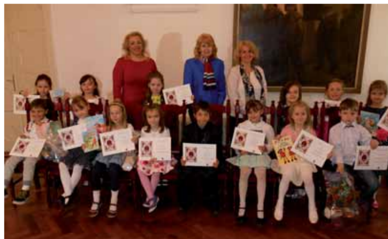
Účastníci a organizátori krajského matičného podujatia – jediného na celom Slovensku.