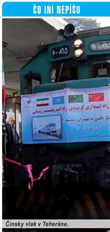
Čínsky vlak v Teheráne.

Zainteresovaní môžu namietat, že podobné železničné spojenie v podstate existuje už roky. Ibaže je tu jeden veľký rozdiel. Nová trať má jednotný železničný rozchod, nie je potrebná prekládka na hranici štátov ani prepriahanie trakčných lokomotív. Nie náhodou sa z Číny niekedy v decembri minulého roka začali šíriť správy o novom železničnom spojení s Európou. Partnerom zámeru už je aj Turecko. Expressné dodávky po železnici by tak z krajiny vychádzajúceho slnka putovali k európskym odberateľom osem až dvanásť dní. Prítom Čína už dávnejšie vypravila nákladný vlak až do Hamburgu, ale jeho jazda trvala až šesťnásť dní, viedla severskou traťou s využitím siete Ruských železníc. Zdá sa, že od tohto