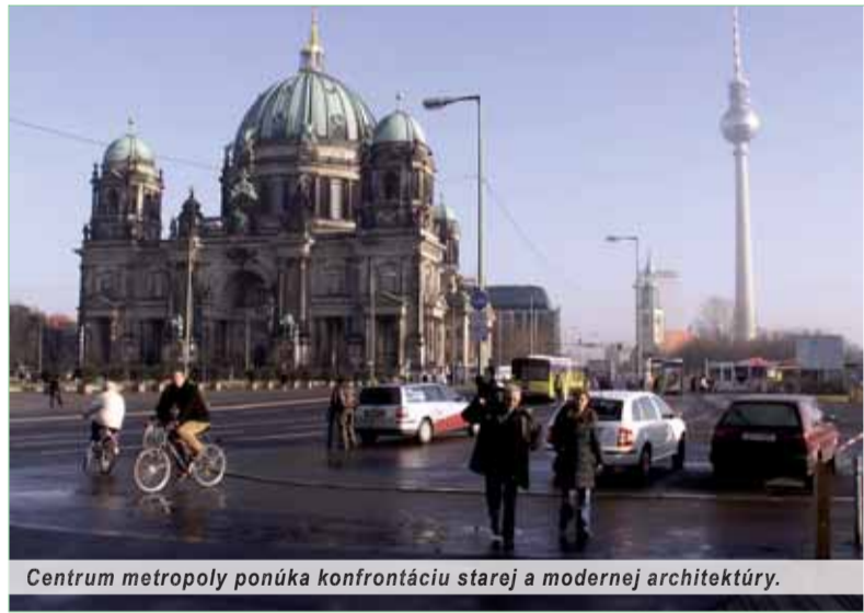
Centrum metropoly ponúka konfrontáciu starej a modernej architektúry.

Pred pár týždňami malo byť práve toto námestie, vedľa ktorého sídli berlínska radnica, cieľom útoku teroristov. Nemecká tajná služba však ich zámyery prekazila. Od radnice je kúsok na centrálny bulvár Unter den Linden, čo doslova znamená „pod lipami“. Bulvár vedie až k Brandenburskej bráne. Od radnice cez rieku Sprévu a po bulvár Pod lipami (kde lipy akosi chýbajú) lemujú priestor rôznofarebné kovové potrubia a trvá to už šestnásť rokov. Súvisí to s výstavbou metra, ktorú komplikujú tekuté podzemné riečne piesky.