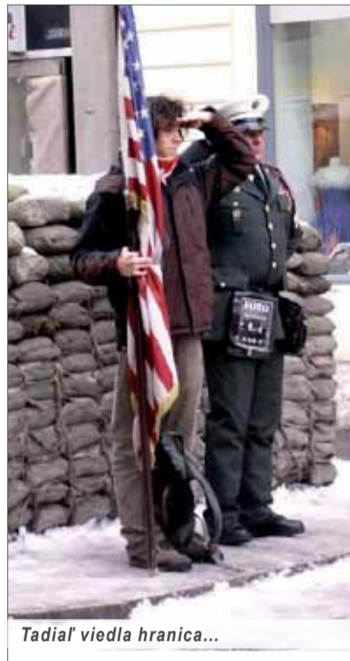
Tadiaľ viedla hranica...

Najznámejšou obchodnou ulicou v meste je Kurfürstendamm, bývalé „západné“ centrum mesta, ktorú lemujú veľké množstvo obchodov, hotelov a reštaurácií. Ulica, ktorú miestni nazývajú skrátene Ku'damm, býva porovnávaná s podobnými exkluzívnymi mestskými triedami v iných veľkomestách sveta. Centru mesta dominuje architektonicky zaujímavé Postupimské námestie, teda Potsdamer Platz, ktoré je súčasťou a symbolom modernej časti metropoly. Počas intenzívnej prestavby námestia v rokoch 1997 a 1998 to bolo najväčšie stavenisko na svete,