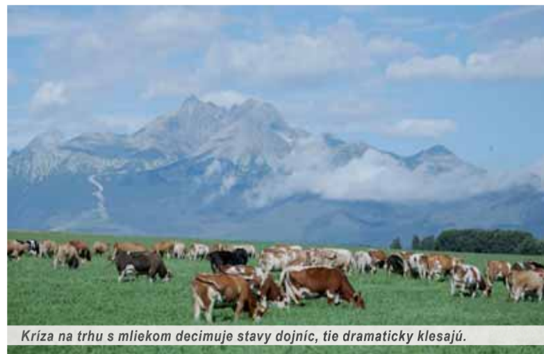
Križa na trhu s mliekom decimuje stavy dojníc, tie dramaticky klesajú.

Pripomenula tiež, že pokračovať v rokovaniach o tejto agende bude od 1. júla aj slovenské predsedníctvo v EÚ. Podľa jej slov sa k celkovej situácii holandské predsedníctvo v EÚ vráti na júrovej Rade ministrov. Dovtedy by Európska komisia mala zhodnotiť doterajšie opatrenia a tiež doterajší balíček v podobe priamej finančnej podpory na zmiernenie krízy vo výške štyristodvadsať miliónov eur, ktorý vlni predstavil eurokomisár Hogan.