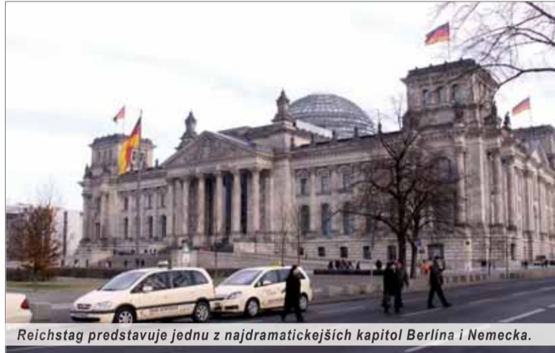
Reichstag predstavuje jednu z najdramatickejších kapitol Berlína i Nemecka.

To miesto, kde sa pred kapituláciou schovával a nakoniec aj zabil Hitler, bolo samozrejme pod zemou, ale malo svoju nadstavbu, na mieste ktorej je dnes parkovisko. Len vývesná tabuľa informuje o obrovských sieti bunkrov, technických parametroch a o povojnovoj histórii objektu. Po Hitlerovi však v prenesenom význame slova v meste ostalo toho dosť, aj keď všetky budovy, ktoré priamo súviseli s diktátorovou činnosťou, boli zničené alebo kompletne zmenili svoje „fasády“.