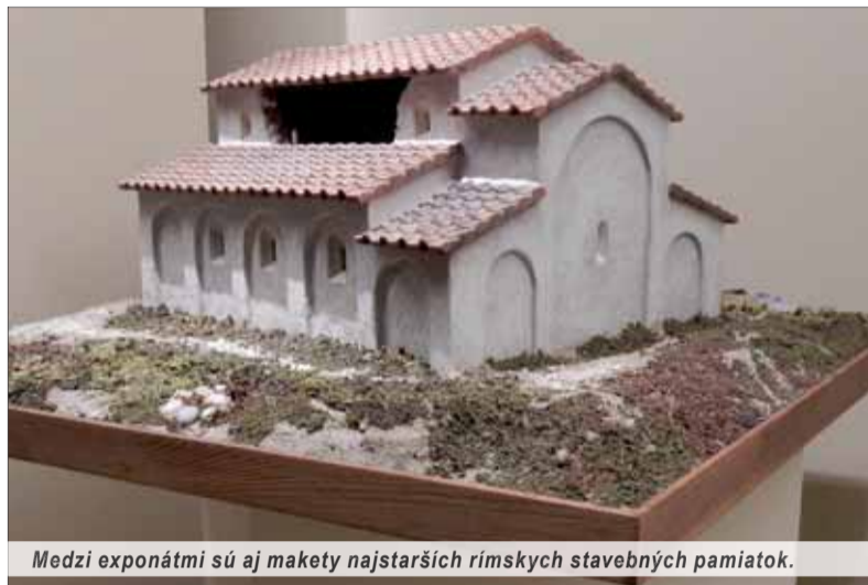
Medzi exponátmi sú aj makety najstarších rímskych stavebných pamiatok.

V podmanivej atmosfére tajomna tmy vystupujú z čierneho plátna výrazne osvetlené panely a medzi nimi ďalšie vitríny, všetko zaplnené skvostmi, aké dokáže ponúknuť len história objavená vďaka archeológii odkliňajúcej diela tvorcov dávnych čias. No a po nich najskôr súkromní zberatelia a mecenáši, po nich zas archeológovia (pravdaže aj súčasné profesionálne inštitúcie), ktorí nás vďaka výsledkom svojej práce dokážu preniesť v čase. Priam neuveriteľne cez zdánlivo nekonečne dlhé mosty, oddeľujúce súčasnosť od mnohovrstvej minulosti stojacej na druhej strane hlbokého údolia času.