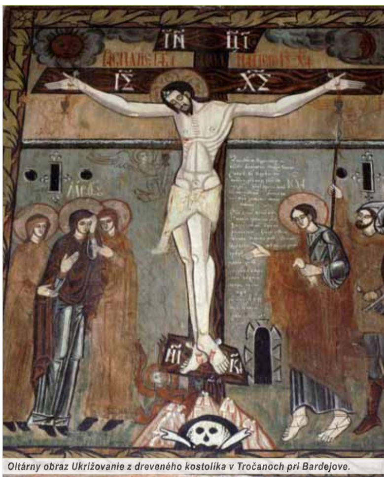
Oltárny obraz Ukrižovanie z dreveného kostolika v Tročanoch pri Bardejove.