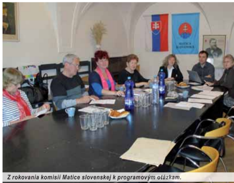
Z rokovaní komisií Matice slovenskej k programovým otázkam.

Rokovanie so zástupcami ZMOS-u je jednou z možností,