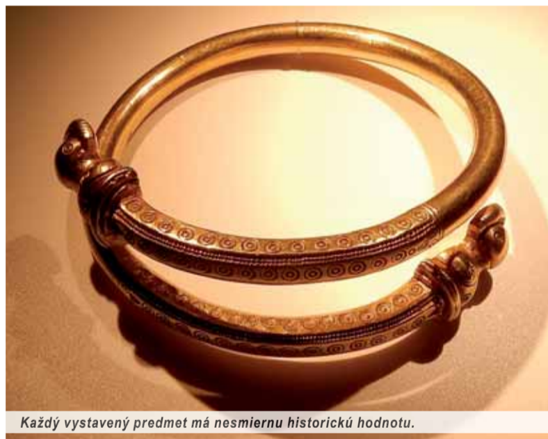
Každý vystavený predmet má nesmiernu historickú hodnotu.

Takmer celé Slovensko je veľkou archeologickou lokalitou s množstvom zaujímavých nálezisk,