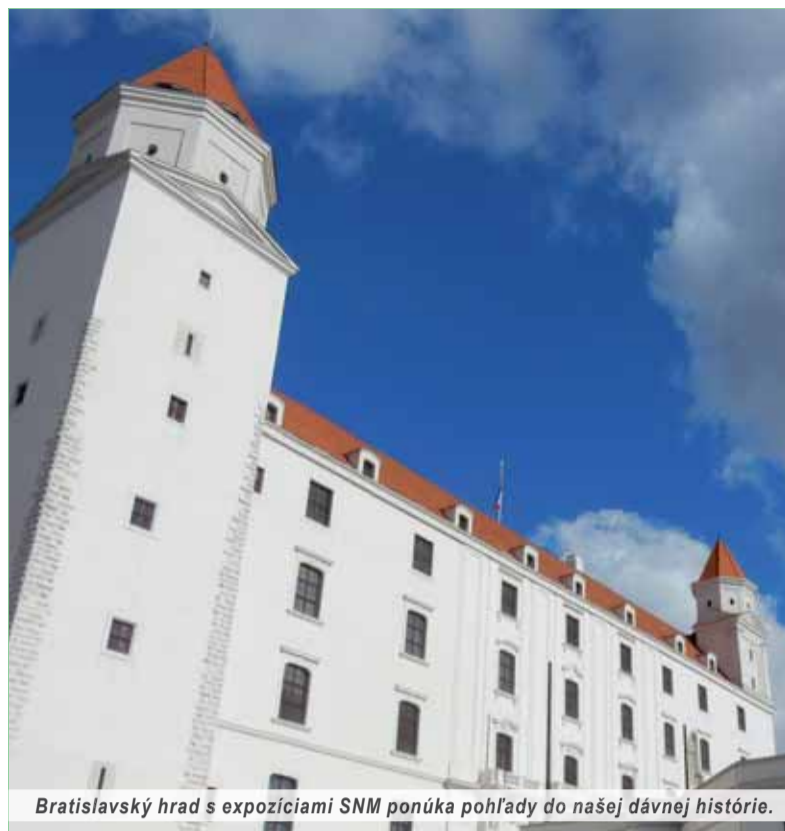
Bratislavský hrad s expozíciami SNM ponúka pohľady do našej dávnej histórie.

z ktorých je v expozícii urobený výber. Z mnohých spomenieme napríklad jaskyňu Domica, Čaku, Dunajskú Lužnú, Zohor, Bratislavský hrad, Barcu, Bojnú ...“