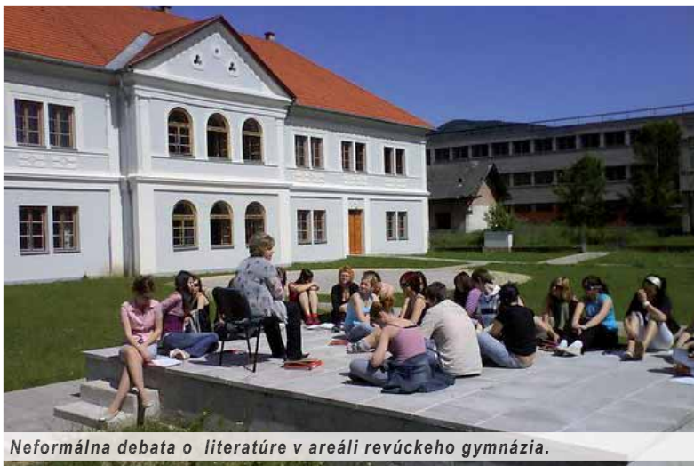
Neformálna debata o literatúre v areáli revúckeho gymnázia.