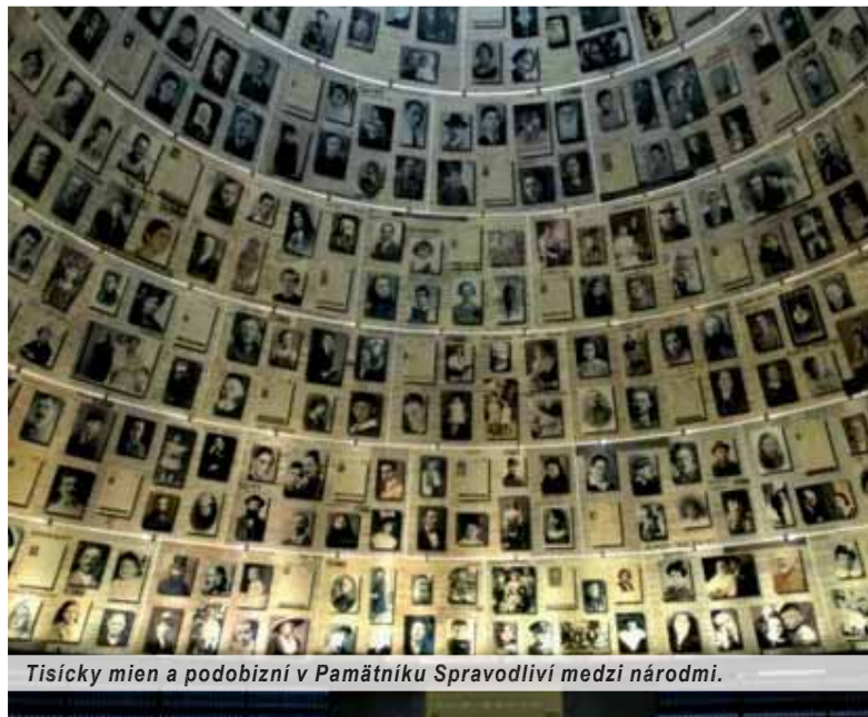
Tisícny mien a podobizni v Pamätníku Spravidliví medzi národmi.

V médiách – a to väčšinou len v ich internetových vydaniach