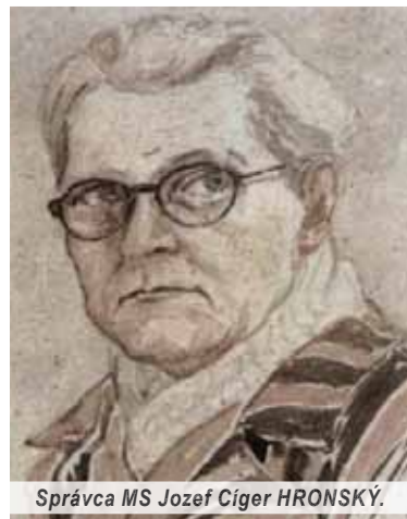
Správca MS Jozef Cíger HRONSKÝ.