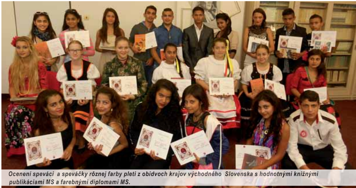
Ocenení speváci a speváčky rôznej farby pleti z obidvoch krajov východného Slovenska s hodnotnými knižnými publikáciami MS a farebnými diplomami MS.

Už piaty ročník krajského matičného festivalu Jasovský zlatý slávik sa uskutočnil v tejto malebnej obci juhozápadne od Košíc. Hlavnými organizátormi podujatia, ktoré je od svojho založenia zamerané na odsúdenie prejavov rasovej diskriminácie, sú Matica slovenská, zastúpená svojimi miestnymi odbormi v Jasove a Košiciach-Myslave, domáca ZŠ Jasov, Obecný úrad v Jasove a odbor školstva Okresného úradu v Košiciach.