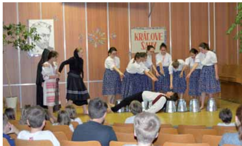
Od roku 1996 sa stali Kráľove Šahy renomovanou súťažou recitátorov a divadelníkov.

Prvé Kráľove Šahy, celoslovenská súťaž v prednese poézie a prózy štúrovcov, sa uskutočnili v roku 1996. Organizátori sa už vtedy neobávali, že sa nepodari vytvoriť tradíciu. Dúfali, že podmaňujúca poézia veľkánov našej krásnej literatúry a poézie sa „ujme“ aj u súčasnej mladej generácie a budú v ich stopách pokračovať. A nesklamali sa. Na Základnej škole Janka Kráľa v Šahách sa 10. júna tohto roku opäť otvárali brány recitátorom zo všetkých kútov Slovenska – deviatykrát za dvadsať rokov.