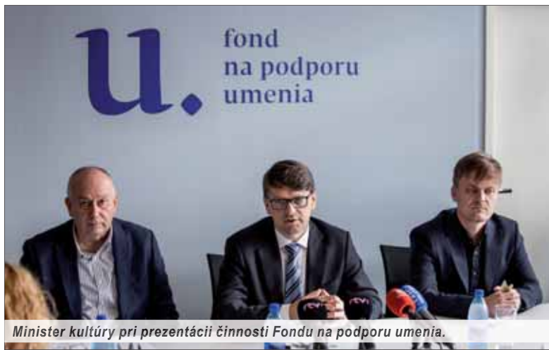
Minister kultúry pri prezentácii činnosti Fondu na podporu umenia.

Definícia nového subjektu je pomerne stručná: Fond na podporu umenia je verejnoprávna inštitúcia zabezpečujúca podporu umeleckých aktivít, kultúry a kreatívneho priemyslu, ktorá vznikla na základe zákona č. 284/2014 Z. z. Fond nahrádza podstatnú časť dotáčného systému ministerstva kultúry a je nezávislý od ústredných orgánov štátnej správy, pričom jeho hlavným poslaním je podpora „živého“ umenia a kultúry. Poskytuje finančné prostriedky najmä na tvorbu, šírenie a prezentáciu