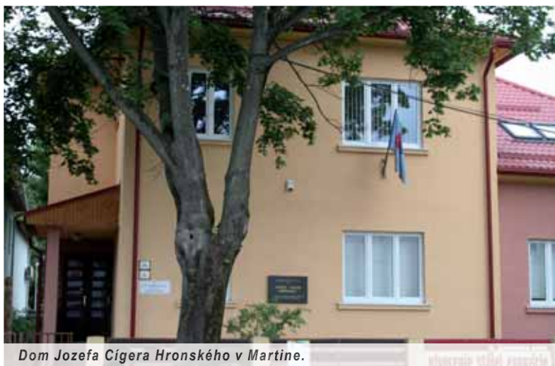
Dom Jozefa Cígera Hronského v Martine.

- Cyrilo-metodské matičné slávnosti, 5. 7. 2016 16 h Košice, pri pamätníku biskupa Š. Moyzesa v parku pri budove Gymnázia na Šrobárovej ul. Po skončení programu sa uskutoční matičná pochádzka k pamätníku Karola Kuzmányho.