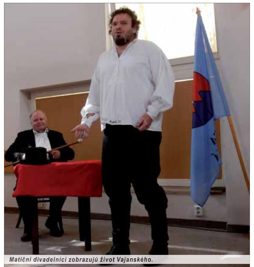
Matiční divadelníci zobrazujú život Vajanského.