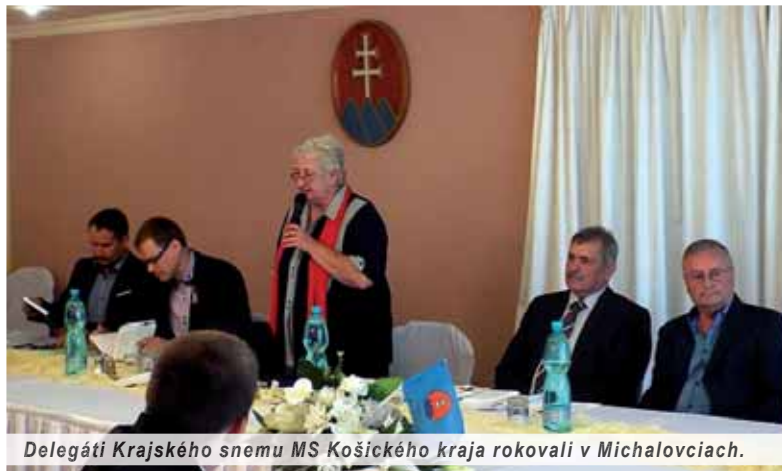
Delegáti Krajského snemu MS Košického kraja rokovali v Michalovciach.