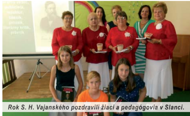
Rok S. H. Vajanského pozdravili žiaci a pedagógovia v Slanci.