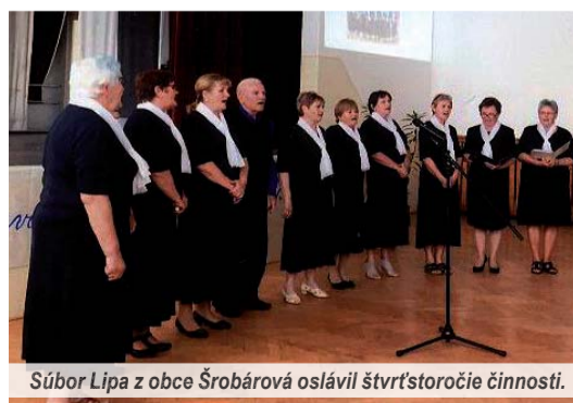
Súbor Lipa z obce Šrobárová oslávila štvrtstoročie činnosti.