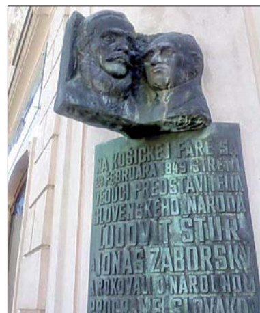
Pamätný reliéf na Záborského fare v Košiciach.