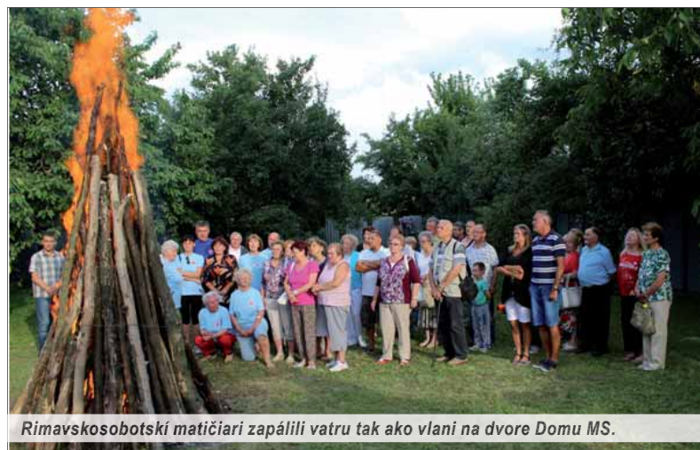
Rimavskosobotskí matičiari zapálili vatru tak ako vlni na dvore Domu MS.