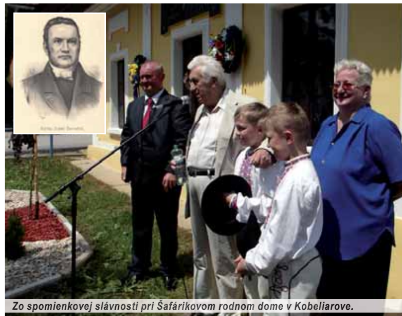
Zo spomienkovej slávnosti pri Šafárikovom rodnom dome v Kobeliarove.

Po slávnosti nasledovala prehliadka pamätného domu aj dobré pohostenie, kde sa domáci uká-