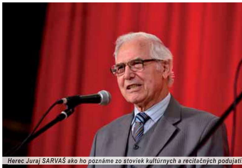
Herec Juraj SARVAŠ ako ho poznáme zo stoviek kultúrnych a recitačných podujatí.

v televíznych Chvilčkach poézie, ktoré sú už, bohužiaľ, iba nostalgickou spomienkou na časy, keď sa básnické slovo dostalo aj na obrazovky. Samozrejme že popri divadle a filme mal Juraj Sarvaš aj množstvo ďalších aktivít. V rozhlase pôsobil nielen ako herec, ale aj ako autor scenárov, venoval sa dabingu, bol tiež účinkujúcim režisérom v mnohých kultúrno-spoločenských podujatiach a, samozrejme, aj pedagógom na svojej alma mater VŠMU. Za tieto svoje aktivity okrem