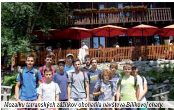
Mozaiku tatranských zážitkov obohatila návšteva Bilíkovej chaty.