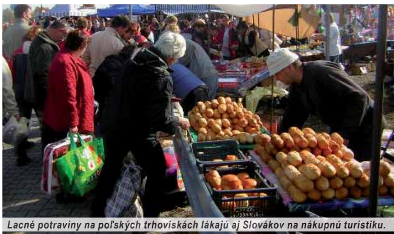
Lacné potraviny na poľských trhoviskách lákajú aj Slovákov na nákupnú turistiku.

produkty, ale niektoré druhy potravín a nealkoholických nápojov sú dokonca až o tridsať percent lacnejšie ako na Slovensku. Je teda zrejme, že Slovákom z prihraničných oblastí sa nákupy u susedov naozaj opláti. To znamená, že náš štátny rozpočet je ochudobnený o značnú časť DPH z potravín. Keď k tomu pripočítame, že pri každom rodinnom nákupe v zahraničí ešte naplníme až po hrdlo palivovú nádrž v aute, ide určite o obrovské ekonomické straty, čo zrejme u nás asi nikomu neprekáža.