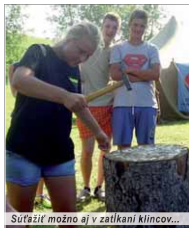
Súťažil možno aj v zatkaní klinec...

Na obecnom športovisku, ako to už tradične býva v ostatných rokoch, pripravili organizátori bohatý program, na ktorom sa zúčastnila takmer celá obec, ale aj návštevníci z blízkeho okolia. Deti od tým najmenších cez staršie, ako i mládežníci súťažili v najrôznejších púťavých podujatiach, vo vedomostných, športových súťažiach a zápoleniach, ktoré zaujali občanov rôznych vekových kategórií. Vari najviac priaznivcov malo zatkanie klinec do klátu či súťaž mladých hasičov i ukážky hasičskej a záchranej pomoci, hasičské auto a ostatná záchrannárska technika, pričom sa tí mladší horúcom júlovom dňom schladili a osviežili v štedro poskytnutej hasiacej pene. K dobrej nálade prispel vynikajúci guláš, živánska a grilované slovenské domáce