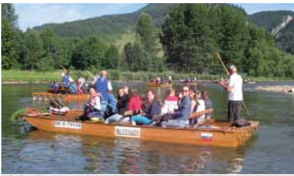
Splav Dunajca priniesol nezabudnuteľné zážitky.