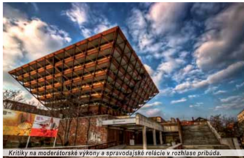
Kritiky na moderátorské výkony a spravodajské relácie v rozhlase pribúda.

Islam je priamym ohrozením našej civilizácie, tvrdí Sulík. Ale nedokáže povedať, či ide o vojnu medzi náboženstvami, alebo nie. Zala neprípúšťa