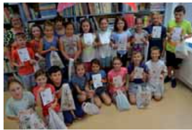
nice si všetci požičiavali knihy domov. Súčasťou boli literárne hry, súťaže,

V Hornonitrianskej knižnici v Prievidzi v septembri minulého roka vyhlásili už 15. ročník súťaže pre triedne kolektívy 1. – 4. ročníka ZŠ Čítajme spolu, ktorej cieľom je hravou formou priviesť deti k čítaniu, zároveň si osvojiť čitateľské zručnosti a rozvíjať vzťah ku knihe. Žiaci po celý rok čítali básničky, rozprávky, náučnú literatúru. Naučili sa orientovať v knižnici, poznávať slovenských autorov i vyberať si knižky podľa ich mien. Pri každej návšteve kniž-