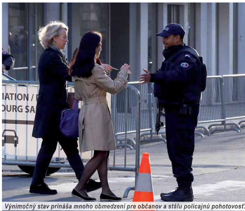
Výnimočný stav prináša mnoho obmedzení pre občanov a stálu policajnú pohotovosť.

Projekt nedvojzmyselne hovoriaci o „zodpovednosti Francúzska a Nemecka posilniť súdržnosť v Európskej únii“ bol prednesený v Prahe na stretnutí nemeckého ministra zahraničných vecí s predstaviteľmi Vyšehradskej štvorky. České ministerstvo zahraničných