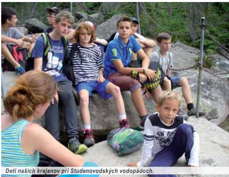
Deti našich krajanov pri Studenovodských vodopádoch.