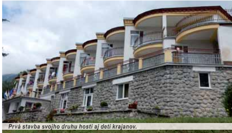
Prvá stavba svojho druhu hostí aj deti krajanov.

Na druhý deň zas dobre padla termálna vodička v Aquacity Poprad. Niet nad kúpalisko po namáhanom dni – navyše v sparnom lete, ktoré objalo celé Slovensko. Zážitkami nabitý kolotoč programov sa krútil ďalej a pokračoval splavom na tenoraz o poznanie divokejších vodách Dunajca. Z trochu iného súdka bolo inšpiratívne – najmä pre tých manuálne zručnejších – stretnutie s remeselníkmi na Európskom ľudovom remesle v Kežmarku. Hlavným programom sobotňajšieho dňa bola prehliadka umu, šikovnosti, zručnosti detí pod priliehavým názvom Detský raj má talent. V priebehu dňa deti ešte skúšali, precvičovali, dotvárali choreografie a učili sa texty. V prestávkach privítali psyky z výcvikovej školy a v neďalekej Tatranskej Lomnici si poobzerali elegantné veterány (autá), ktoré sa tu zišli z celého Slovenska. Samotný večer bol výnimočný.