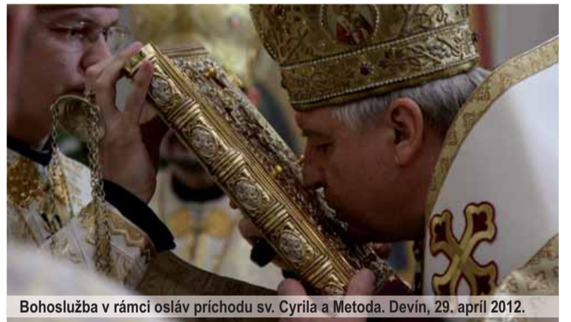
Bohoslužba v rámci osláv príchodu sv. Cyrila a Metoda. Devín, 29. apríl 2012.