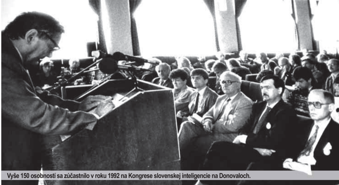
Vyššie 150 osobností sa zúčastnilo v roku 1992 na Kongrese slovenskej inteligencie na Donovaloch.

Text a foto: Drahoslav MACHALA, autor bol prvým hovorcom KSI.