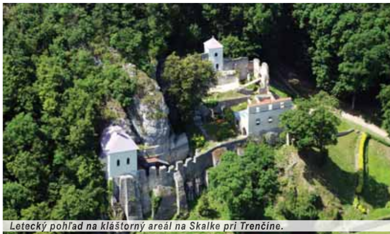
Letecký pohľad na kláštorný areál na Skalke pri Trenčíne.

Za „trojkrížim“ na druhej strane cesty, priamo vo svahu naproti kostolu sa nachádza Kalvária, krížová cesta so svojimi štrnástimi zastaveniami. Pochádza z roku 1696. Keď jezuiti opustili Skalku niekedy v roku 1773, krížová cesta začala pútnúť