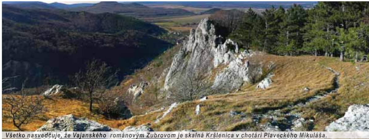
Všetko nasvedčuje, že Vajanského románovým Zubrovom je skalná Kršlenica v chotári Plaveckého Mikuláša.