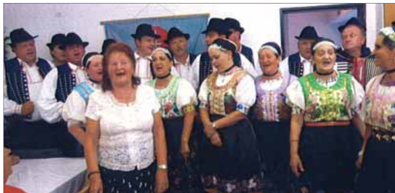
Matičné dni v Malom Šariši mali napriek nepriazni počasia výbornú atmosféru aj vďaka domácim folkloristom.