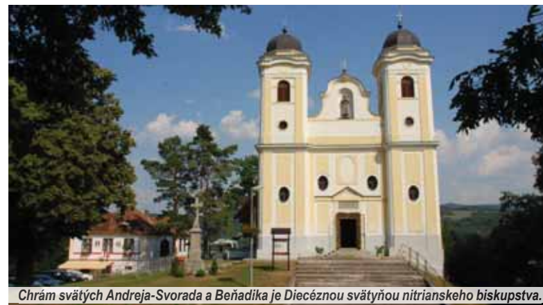
Chrám svätých Andreja-Svorada a Beňadika je Diecéznou svätynou nitrianskeho biskupstva.

a postupne takmer zanikla. Až v roku 1990 bola pričinením pátra Emila Prokopa, SVD (Societas Verbi Divini – Spoločnosť Božieho Slova), opravená a takmer znovuvybudovaná. Mimochodom, aj maľba svätcov na stenách kostola je dielom tohto pátra. Na základe iniciatívy duchovných, veriacich a viacerých umelcov z trenčianskeho regiónu bola v roku 2012 spracovaná úplne nová podoba Krížovej cesty, ktorá je koncipovaná na základe výjavov zo života svätého Svorada-Andreja a svätého Beňadika. Celková dĺžka cesty až po Golgotu je asi dvestopäťdesiat metrov a prevýšenie na nej je tridsaťšesť metrov. Čoskoro má pribudnúť aj zaujímavý lesný chodník, ktorý spojí návršie Golgoty na Malej Skalke s kláštorom na Veľkej či Starej Skalke.