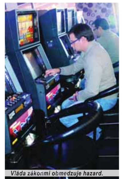
Vláda zákonmi obmedzuje hazard.

Ak novely prejdú bez úpravy, budú poisťovne štátu platiť aj odvod osem percent z neživotného poistenia – tu ide o poistenie domácností, nehnuteľností, úrazové, cestovné poistenie, poistenie zodpovednosti a pod., to znamená, že možno očakávať, že poisťovne túto ťarchu prenesú v podobe zvýšených cien poistiek na svojich klientov. Dnes takýto odvod platia iba z povinného poistenia áut. Ďalšie zmeny sú pripra-