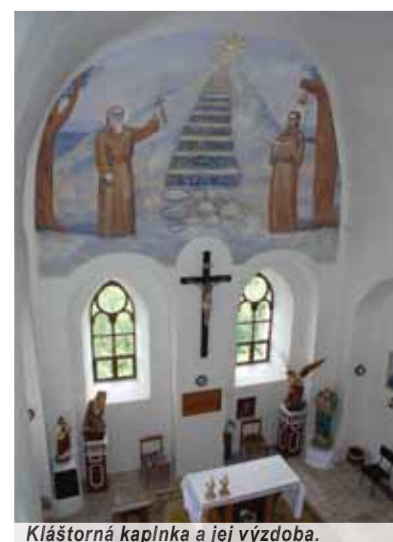
Kláštorná kaplnka a jej výzdoba.