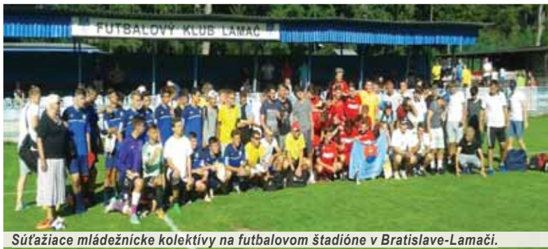
Súťažiaci mládežnícke kolektívy na futbalovom štadióne v Bratislave-Lamači.

Prostriedky na to, aby sa mohla takáto náročná akcia uskutočniť, zabezpečil MO MS Bratislava I-Staré Mesto a FKM Karlova Ves Bratislava, ktorý bol organizačným garantom turnaja.