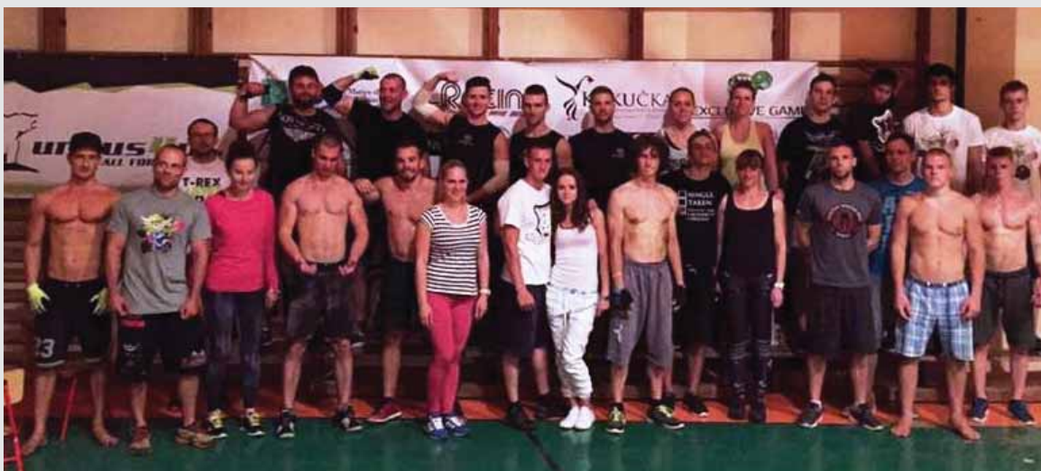
Účastníci rožňavského Dňa zhybov, počas ktorého tamojší siláci a najmä siláčky dosiahli neuveriteľné výkony, ktoré im vynesli miesto medzi najlepšími.