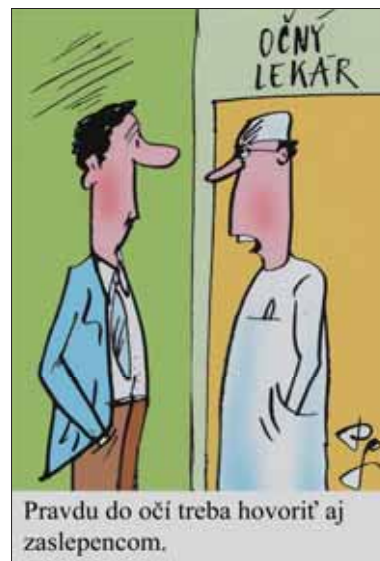
Pravdu do oči treba hovoriť aj zaslepencom.