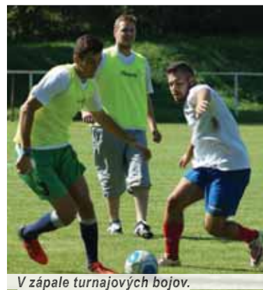
V zápale turnajových bojov.

Záverečné oceňovanie sa odohrávalo za prítomnosti poslancu NR SR, bývalého futbalového