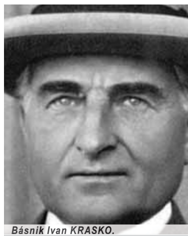
Básnik Ivan KRASKO.

od sivej slovenskej hlavy starušky preletí i v dušu poetu.“