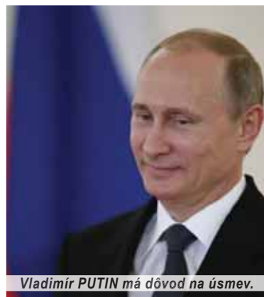
Vladimír PUTIN má dôvod na úsmev.

A prečo zvíťazilo Jednotné Rusko vysoko na body? Podľa politológa Vitalija Tretjakova to bola podpora Vladimíra Putina, ktorý je symbolom ruského vlastenectva aj znovu nadobudnutého sebavedomia a po jelcinovskom chaose je dôsledným zástancom národných záujmov. Dôležitým faktorom bolo aj to, že táto strana, podobne ako samotný Putin, dokázali oživiť svoju personálnu poli-