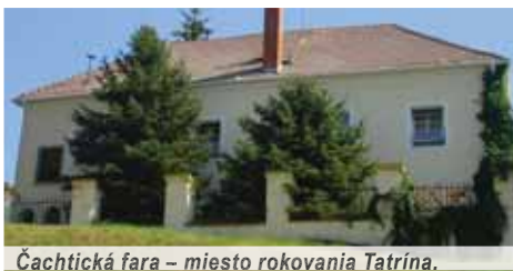
Čachtická fara – miesto rokovania Tatrína.

Čachtice tiež majú zaujímavé a podnetné dejiny. Preslávil ich nielen hrad a krvavá gróška Alžbeta Bátoriová. Čachtická fara je všeobecne známa štvrtou sednicou Tatrína, na ktorej sa pred 169 rokmi uzákonnila spisovná slovenčina. Tieto slávne historické udalosti, ale