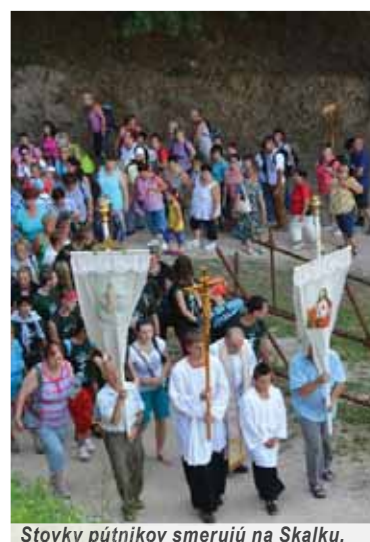
Stovky pútnikov smerujú na Skalku.