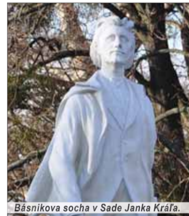
Básnikova socha v Sade Janka Kráľa.