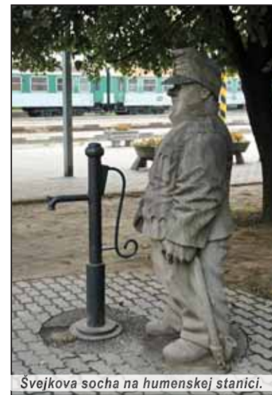
Švejkova socha na humenskej stanici.

„Brigáda dostala rozkaz premiestniť sa zo Sanoka smerom na Sambor. Na porade dôstojníkov bataliónu chýbal iba poručík Dub, ktorého mal podľa rozkazu vyhľadať Švejk. Zatiaľ nadporučík Lukáš kopíroval príkaz, aby sa poručík Dub ihneď dostavil na poradu. Po stretnutí s poľskou madam, ktorá Švejkovi bránila, aby sa vybral na poschodie hľadať poručíka, objavil sa aj majiteľ nevestinca, ktorý ho ťahal a kričal, že hore vojaci nesmú, že to je miesto iba pre pánov dôstojníkov. Švejk ho pritom rázne upozornil, že prichádza v záujme celej c. k. armády a že hľadá jedného pána poručíka, bez ktorého sa nemôže armáda vydať na front, a keď si ten počínal stále vybojnejšie, Švejk ho zrazil dolu zo schodov a vybral sa splniť rozkaz. V jednej z miestností ležal na