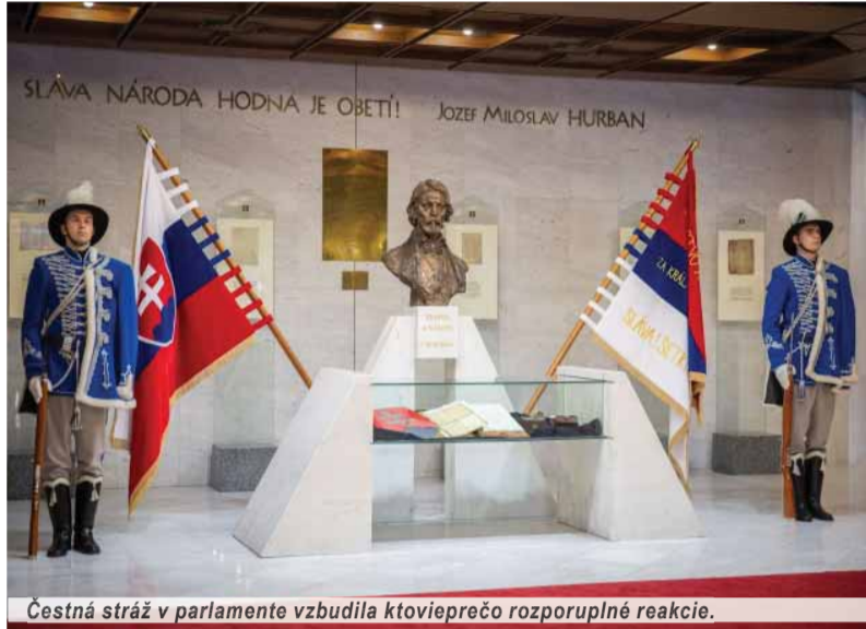
Čestná stráž v parlamente vzbudila ktovieprečo rozporuplné reakcie.

Z iniciatívy predsedu parlamentu Andreja Danka od septembra tohto roka počas rokovania Národnej rady Slovenskej republiky strážia v jej priestoroch vojaci Čestnej stráže v historických uniformách naše štátne symboly – štátnu vlajku, štátny znak a štátnu pečať a tiež zástavu slovenských dobrovoľníkov z roku 1848.