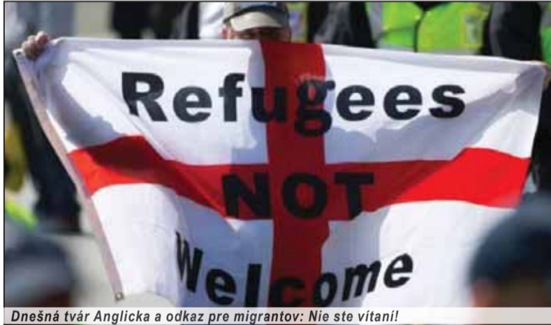
Dnešná tvár Anglicka a odkaz pre migrantov: Nie ste vítaní!

slobodu pohybu. Slovensko v tej súvislosti oznámilo, že ak bude obmedzená sloboda pohybu, potom musí Británia rátať s obmedzením jej obchodných a hospodárskych aktivít v Únii.