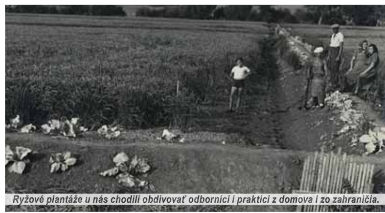
Ryžové plantáže u nás chodili obdivovať odborníci i praktici z domova i zo zahraničia.

Pestovaniu tejto plodiny na Slovensku potichu odtrúbili na konci päťdesiatych rokov minulého storočia. Aj keď tento pokus skončil ináč, ako si to jeho odhodlaní aktéri predstavovali, pred slovenskými ryžiarimi hodno sňať klobúk. Veď napriek početným ťažkostiam úspešne zvládli náročnú technológiu pestovania tejto rastliny a dokázali, že naši ľudia sú v záujme dobrej veci ochotní a schopní zmobilizovať srdce, rozum aj ruky. Ostatne, história nás pouča, že nie každý hľadačský počín sa končí medailami či čestnými uznávaniami. Pritom však zámer ako taký nenačím zatracovať.