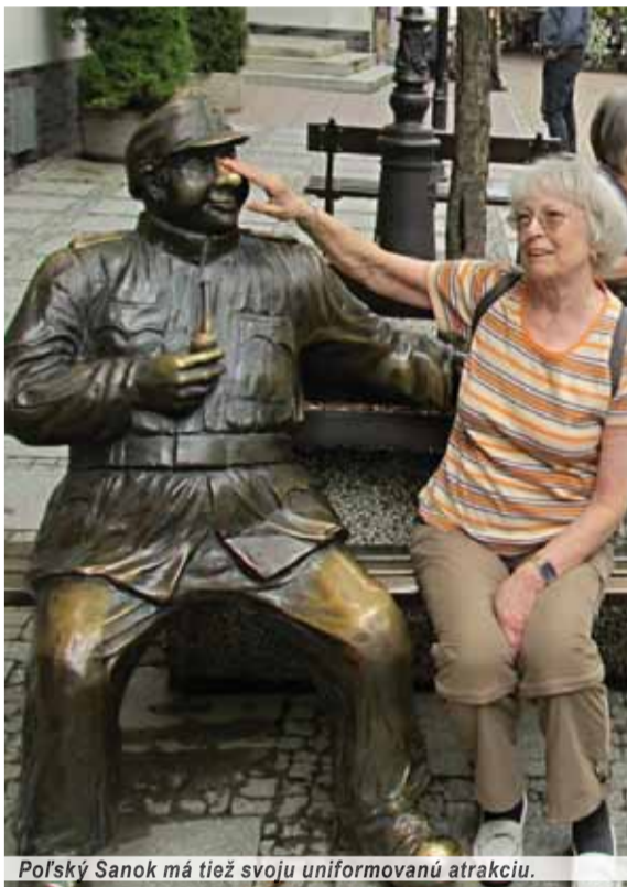
Poľský Sanok má tiež svoju uniformovanú atrakciu.