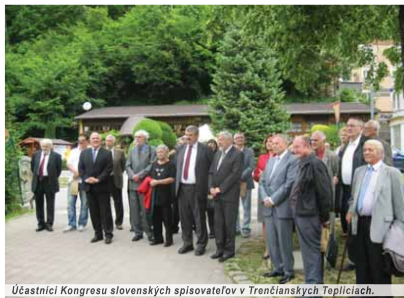
Účastníci Kongresu slovenských spisovateľov v Trenčianskych Tepliciach.

Spolupráca by mala prebiehať jednak po línii literárno-vedného a historického výskumu, jednak pri propagácii našej literatúry najmä v zahraničí. Tak ako účastníci trenčianskoteplického kongresu v roku 1936 vyslovili v záverečnom Spoločnom prejave nezabudnuteľné slová: „Slovenskí spisovatelia a všetci zúčastnení zostávajú verní borbe za slobodu a veľké ideály ľudstva, ktoré pomáhali tvorcom našej kultúry zabezpečiť národný dnešok. Sme odhodlaní brániť vydobyté hodnoty slobody, nech by už na ne siahali barbarský nepriateľ alebo jeho spojenci tu či v zahraničí,“ aj účastníci kongresu v roku 2016 sa hlásia na obranu kultúry a humanizmu všade tam, kde sú základné európske civilizačné hodnoty v ohrození. Na záver spiso-