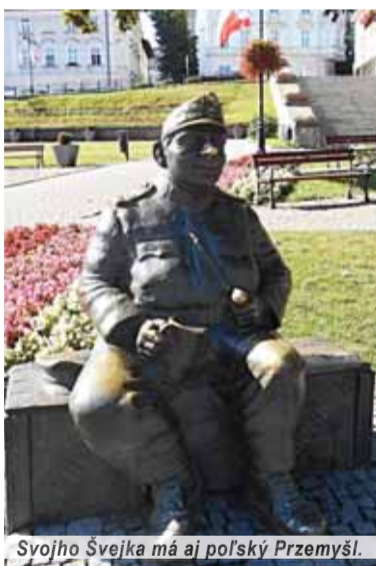
Svojho Švejka má aj poľský Przemysl.

Členovia humenského Českého spolku, ktorí sa tiež zapojili do projektu, od čias inštalovania sochy pätnásť rokov organizovali umývanie Švejka, keďže každý rok sa na vzhľade sochy podpísalo počasie, životné prostredie i návštevníci neďalekej krčmy. Zároveň touto neskorou jesennou spoločenskou akciou odštartovali aj sprievodné podujatia projektu: semi-