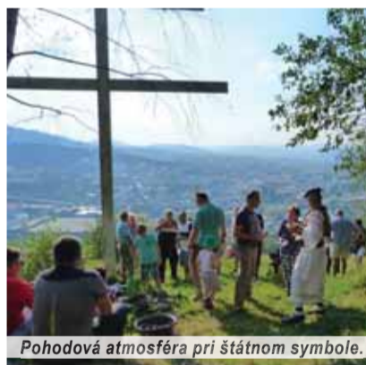
Pohodová atmosféra pri štátnom symbole.

Už tradične na sviatok Sedembolestnej Panny Márie patrónky Slovenska, sa uskutočňuje výstup k slovenskému dvojkrížu v Čadci na Capkovom vrchu. V Bukove pri kaplnke sa najprv slúži svätá omša. Aj toho roku za pekného slnečného počasia vystúpili prítomní z rôznych, najmä kysuckých obcí a miest k dvojkrížu, odkiaľ sa im naskytl pekný pohľad na okresné mesto. V programe účinkoval majster ľudovo-ume-