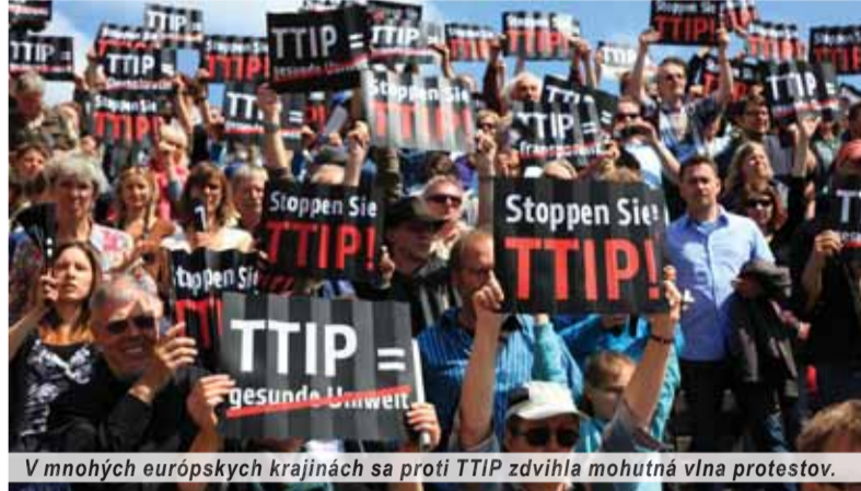
V mnohých európskych krajinách sa proti TTIP zdvihla mohutná vlna protestov.

Pod pojmom liberalizácia obchodu sa rozumie odstránenie akýchkoľvek administratívnych prekážok v obchodovaní medzi zmluvnými stranami. Ide teda o vytvorenie spoločného trhu bez cla, ktorý viac vyhovuje exportným štátom, a tým vytvára nové pracovné príležitosti. Samozrejme, v našom prípade sa ráta s dodržaním európskych štandardov v oblasti ochrany zdravia a bezpečnosti občanov vrátane ochrany osobných údajov a stability v sociálnej oblasti. Pravdepodobne problémy v týchto oblastiach spôsobili, že za tri roky nebola doteraz uzavretá ani jedna z tridsiatich kapitol tejto obchodnej dohody, a keďže doterajšie výstupy boli pred verejnosťou viac