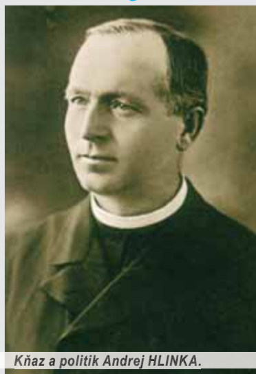
Kňaz a politik Andrej HLINKA.

venského štátu v roku 1918. V Slovenskej ľudovej strane od roku 1905 dokázal zmobilizovať širšie ľudové vrstvy v zápase za všeobecné volebné právo a základné kultúrne práva Slovákov. Ako predseda Slovenskej ľudovej strany, najsilnejšej politickej strany Slovákov, viedol boj za autonómiu Slovenska v rámci Česko-Slovenskej republiky a stal sa symbolom autonomistického hnutia. Jeho politická činnosť bola vždy zameraná na duchovné pozdvihnutie a sociálne zabezpečenie všetkých členov národa. V novej Česko-Slovenskej republike bol členom výboru