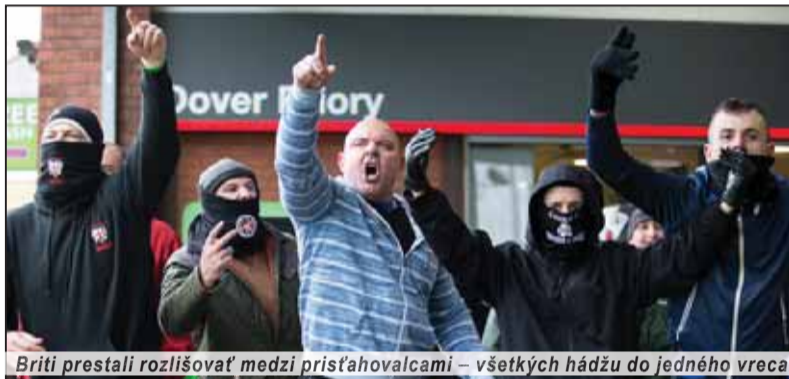
Briti prestali rozlišovať medzi prisťahovalcami – všetkých hádžu do jedného vreca.

Premiér Robert Fico požiadal britskú premiérku o osobitnú mieru starostlivosti o Slovákov, ktorí pracujú v Británii. Mayová prisľúbila, že sa v budúcnosti bude snažiť o to, aby mohla práva približne deväťdesiat tisíc Slovákov ochrániť. No ako podmienku si dala reciprocitu – bude to možné iba vtedy, ak rovnako budú chránené i práva Britov, ktorí budú žiť či pracovať v krajinách EÚ. Zároveň upozornila, že Briti nepodporujú úplnú