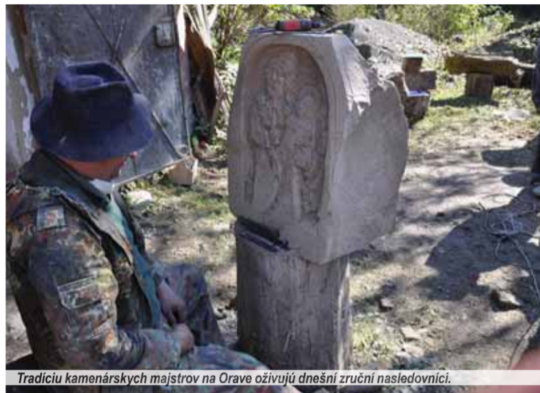
Tradíciu kamenárskych majstrov na Orave oživujú dnešní zruční nasledovníci.