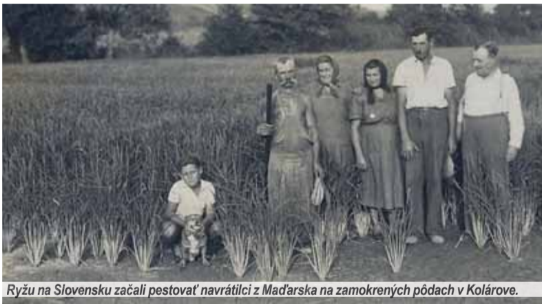
Ryžu na Slovensku začali pestovať návratilci z Maďarska na zamokrených pôdach v Kolárove.

V polovici minulého storočia boli toho plné noviny. Ešte aj taká vážna publikácia, akou bol Matičný kalendár na rok 1950, venovala téme tri a pol strany. Takmer senzácia sa dala zhrnúť do niekoľkých slov: na poliach okolo dolného toku Váhu sa urodila prvá slovenská ryža.