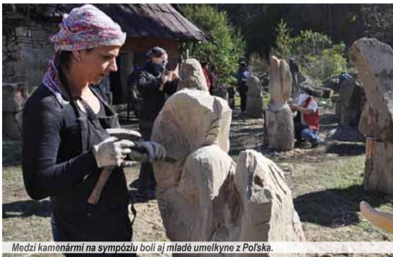
Medzi kamenármi na sympóziu boli aj mladé umelkyne z Poľska.

Téma tvorivého stretnutia bola sakrálna. Kamenári pracovali nad zastaveniami z krížovej cesty a vytvorili i niekoľko plastik pripravovaných kamenného Betlehema, ktorý by mal byť v budúcnosti nainštalovaný vo farskej záhrade. Plenér poskytol tvorcom možnosť konfrontovať svoju umeleckú prácu a ovládať remeselnú zručnosť navzájom, na stretnutí sa výtvarne a remeselné zdokonalili a spoznali technické a výtvarné možnosti kameňa. Už viac ako šesťdesiat diel vytvorených na predchádzajúcich ročníkoch je nainštalovaných pri obecnej úrade a farskom kostole v obci. Sú tak stárou prezentáciou bohatej kamenárskej histórie. Oravský Biely Potok bol v minulosti