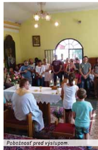
Pobožnosť pred výstupom.

vacía exkurzia – určite rozšíri vedomosti dúbavských matičiarov o stále ešte záhadnom Jankovi Kráľovi.