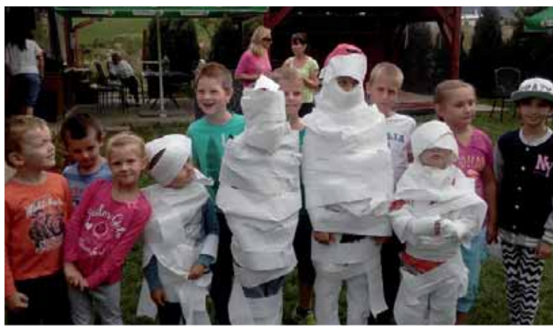
Papierové figúry boli jednou zo zábavných činností na Prázdninách bez nudy v Diakovej.

Celodenné, športovo-rekreačné podujatie je určené najmä pre deti predškolského a mladšieho školského veku, ale aj ich rodičom, starým rodičom, aby spoločne zmysluplne a hravou formou vo voľnej prírode strávili časť prázdnin. Organizátori pre nich pripravili skutočne pestré tvorivé dielne, kde tí najmenší mali možnosť vystrihnúť si zaujímavé zvieratko, vymalovať pripravené predlohy, okoštovať čerstvo napečené koláčiky a rôznymi spôsobmi cibriť pamäť aj motoriku. Staršie deti sa s chuťou zapojili do tradičných i netradičných hier a súťaží, akými napríklad boli beh v gumáoch, slalom s tanierom na hlave,