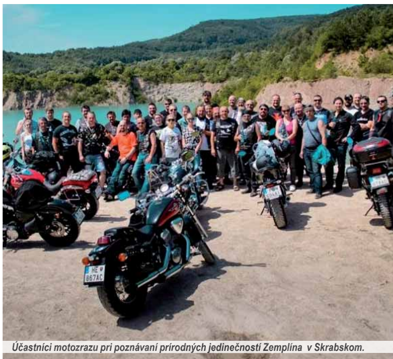
Účastníci motozrazu pri poznávaní prírodných jedinečností Zemplína v Skrabskom.