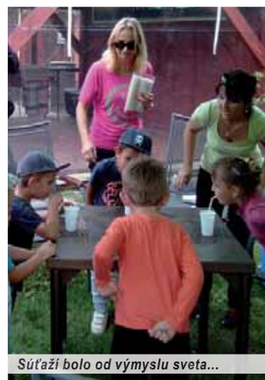
Súťaží bolo od výmyslu sveta...

triatvanie vodou na terč či vyrábanie figúrok z papiera.