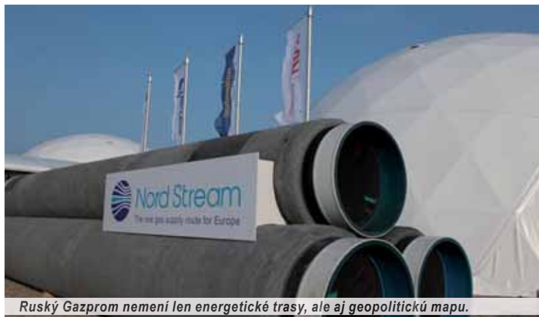
Ruský Gazprom nemení len energetické trasy, ale aj geopolitickú mapu.

V prípade Nordstream II ide v podstate o paralelné potrubie z Ruska, ktoré na severe obchádza Ukrajinu a smeruje ponad územie Poľska (Baltom) do Nemecka