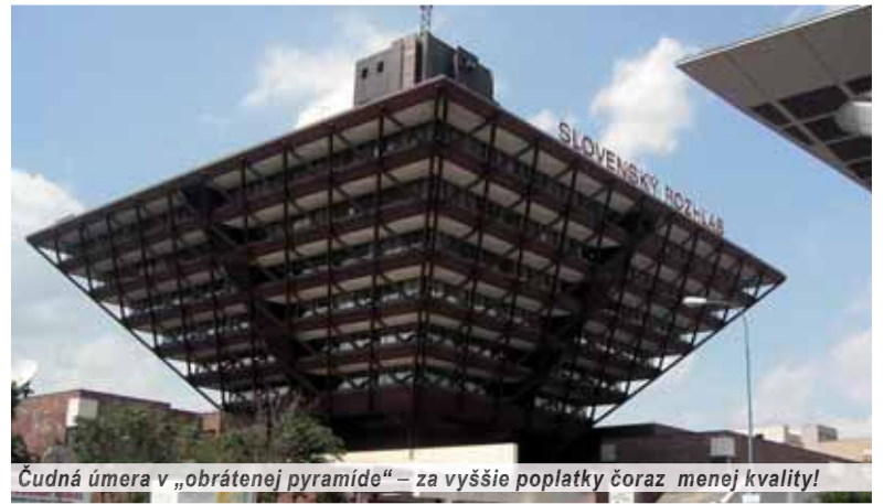
Čudná úmera v „obrátenej pyramide“ – za vyššie poplatky čoraz menej kvality!

Je chvályhodný, zaslúži si uznanie. Verejnoprávny telerozhlas už musí konečne začať vyrábať, nie kšeftovať systémom nákup programov a ich predaj. Musí vyrábať to, čo mu prika-