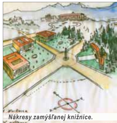
Nákresy zamýšľanej knižnice.

Národnej knižnice slovenskej stala sa skutkom v ústredne položenom, prírodnom, horskom venci Turca, v tradičnom „meste slovenskej národnej kultúry a knihy“ – v Turčianskom Sv. Martine.“