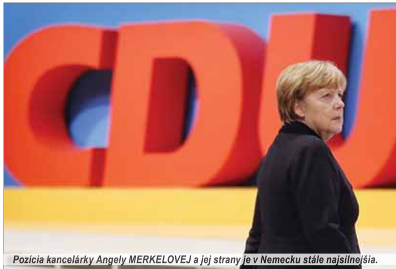
Pozícia kancelárky Angely MERKELOVEJ a jej strany je v Nemecku stále najsilnejšia.

Ako bude vyzerat' nemecká kampaň? Ako sa bude správať nemecký volič? Bude Nemecko, jeho politika a médiá, schopné udržať európsky štandard a naplniť postaviť hrádzu