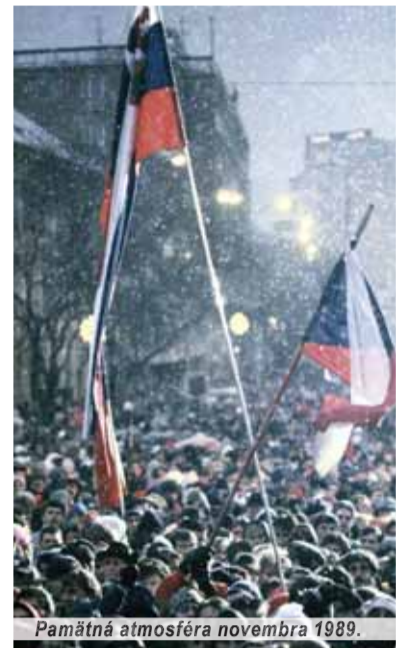
Pamätná atmosféra novembra 1989.

Tohto roku sa stala zvláštna vec. Tak premiér republiky, ako aj jej prezident štátny sviatok oslavovali so študentmi, nie s politickými väzňami. Faktom je, že tak ako sa kedysi českí študenti postavili na odpor proti nacizmu, tak sa tisíce ľudí na