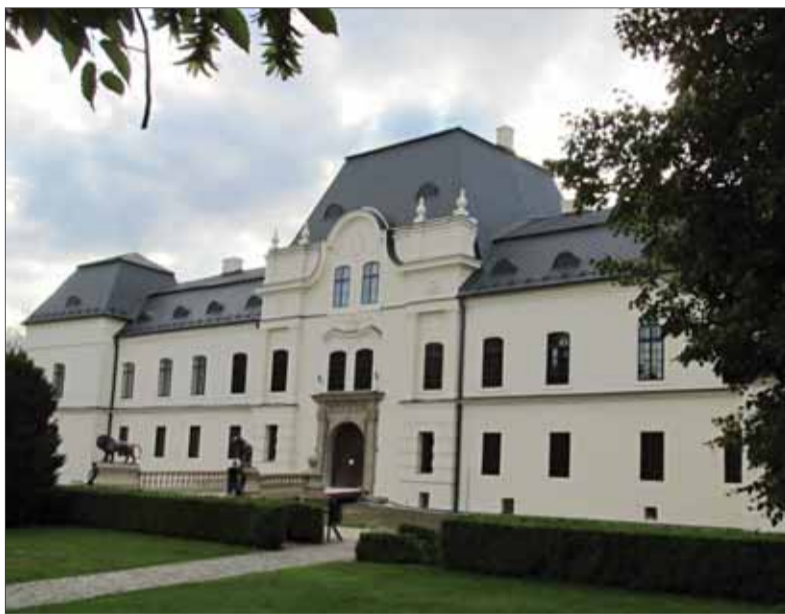
Kaštieľ v Humennom dostal po rekonštrukcii ešte príťažlivejší vzhľad.