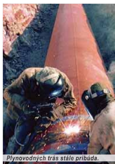
Plynovodných trás stále pribúda.

a podzemných zásobníkov na poľskom území so sústavou tranzitných plynovodov na území Slovenska, čím sa vytvorí možnosť prepravy plynu prakticky až z pobrežia Baltického mora na územie Slovenska a ďalej cez existujúce plyno-