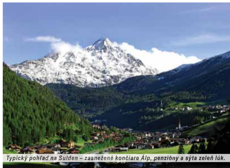
Typický pohľad na Sulden – zasnežené končiare Álp, penzióny a sýta zeleň lúk.