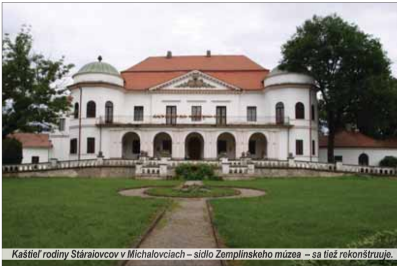
Kaštieľ rodiny Stáraiovcov v Michalovciach – sídlo Zemplínskeho múzea – sa tiež rekonštruuje.

Expozície Zemplínskeho múzea v Michalovciach v priestoroch barokovo-klasicistického kaštieľa, bývalého sídla rodiny Stáraiovcov, sú pre plánovanú rekonštrukciu národnej kultúrnej pamiatky zatiaľ pre verejnosť uzavreté. Rekonštrukcia v hodnote vyše dvoch miliónov eur bude financovaná z prostriedkov, ktoré Košický samosprávny kraj získal z Regionálneho operačného programu v rámci prioritnej osi zacieľenej na posilnenie kultúrneho potenciálu regiónov. Pracovníci múzea po dokončení stavby a kolaudácii chcú pracovať