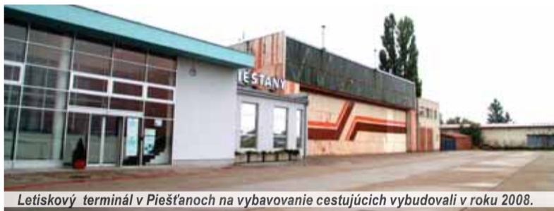
Letiskový terminál v Piešťanoch na vybavovanie cestujúcich vybudovali v roku 2008.

Je všeobecne známe, že existencia letiska v blízkosti Žiliny podporila príchod zásadných investícií posledných rokov, akými sú povedzme KIA Teplička nad Váhom, INA Kysuce,