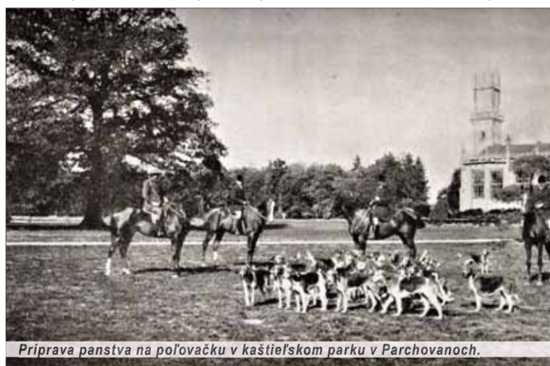
Príprava panstva na poľovačku v kaštieľskom parku v Parchovanoch.

Dve svetové vojny a nástup komunizmu sa negatívne odrazili na zachovaní historických kaštieľov ako objektov, kde kedysi sídlila šľachta. Zvlášť nástup komunizmu s jeho ostrým triednym bojom proti „nepriateľom socializmu“, ako bola označovaná šľachta a všetko s ňou spojené, dal kaštieli rôzne úžitkové až znevažujúce funkcie a poslanie – premenil ich na sklady poľnohospodárskych a iných podnikov, obchodných spoločností, zeleniny, ale aj hnojív, zmenil ich na zariadenia na prevýchovu či psychiatrické zariadenia. V lepšom prípade sa zmenili na školy a múzeá. Niektoré mali výhodu, že ich vtedajší majitelia stihli rekonštruovať. Málokedy s vísáčkou zachovania pôvodného vzhľadu, no aspoň sa tým zabrá-