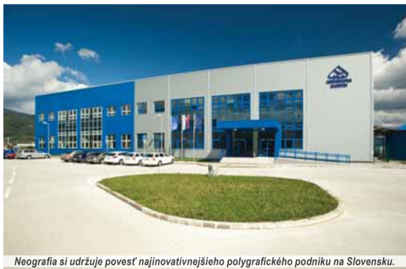
Neografia si udržuje povest' najinovatívnejšieho polygrafického podniku na Slovensku.

Tržby Neografie oproti vlaňajšku klesnú zhruba o 5,5 percenta. Citeľný je výpadok spolupráce so zákazníkom Spoločnosť 7 Plus, ktorý po akvizícii spoločnosťou Penta presunul výrobu po vyše dvadsiatich rokoch spolupráce do