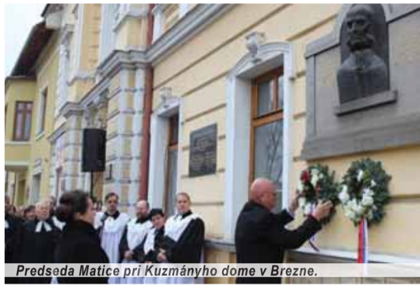
Predseda Matice pri Kuzmányho dome v Brezne.