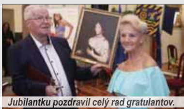
Jubilantku pozdravil celý rad gratulantov.

Jubilantka je osvietenou dušou trnavského kultúrneho života a neúnavnou organizátorkou množstva významných spoločenských podujatí, ktoré obetavo zabezpečuje dlhé roky. Spomeňme len Nočné