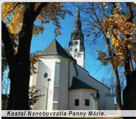
Kostol Nanebovzatia Panny Márie.

K tomuto zápisu pribudol nedávno ďalší. Spišská Nová Ves zvíťazila v ankete Slovač región o najkrajšie mesto a obec na Slovensku v roku 2016. Na ďalších priečkach sa umiestnili Levoča a Bardejov.