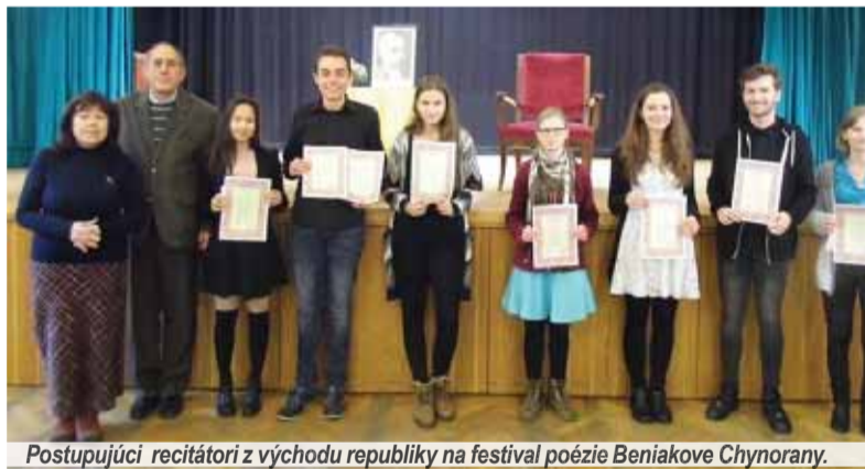
Postupujúci recitátori z východu republiky na festival poézie Beniakové Chynorany.

Organizátori podujatia z OZ Beniakové Chynorany, MO MS Dargovských hrdinov v Košiciach, D MS v Košiciach a zo ZUŠ v spomínaného košickej mestskej časti vybrali spo-