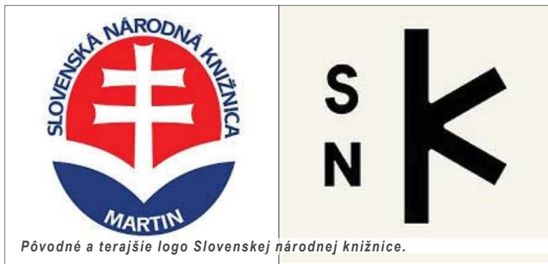
Pôvodné a terajšie logo Slovenskej národnej knižnice.