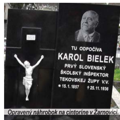
Opravený náhrobok na cintoríne v Žarnovici.

ich teóriu tvorivo aplikoval na konkrétne domáce pomery, pričom využíval osobné skúsenosti skvelého učiteľa. Aj neskôr jeho tvorivosť