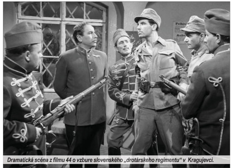
Dramatická scéna z filmu 44 o vzbure slovenského „drotárskeho regimentu“ v Kragujevci.

koprodukcije Plukovník Redl so svetoznámy hercom Klausom Mariom Brandauerom. Tento príbeh je podľa skutočnej udalosti z roku 1913 o náčelníkovi rakúsko-uhorskej rozviadky Alfredovi Redlovi, ktorý prezrádza mobilizačné plány ruskej strane. V roku 1984 z neho urobil maďarský režisér, dnes filmový klasik István Szabó príbeh nielen o rozpade ľudskej osobnosti, ale aj mnohonárodnostnej ríše.