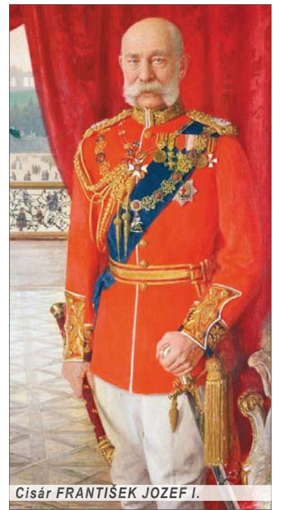
Cisár FRANTIŠEK JOZEF I.

Treba si uvedomiť, čo sa vlastne v Moskve odohralo. Ďalší najstarší film bol z roku 1981! Bol to pamätný Tajomný zámok v Karpatoch režiséra Oldřicha Lipského v hlavných úlohách s Michalom Dočolomanským a Vlastimilom Brodským, potom to bol nový česko-slovenský film Vilsonovo z roku 2015, kde hrá Slovenka Táňa Pauhofová. Na plátne kina 35 milimetrov sa odvinula aj snímka maďarsko-juhoslovansko-rakúska-nemeckej