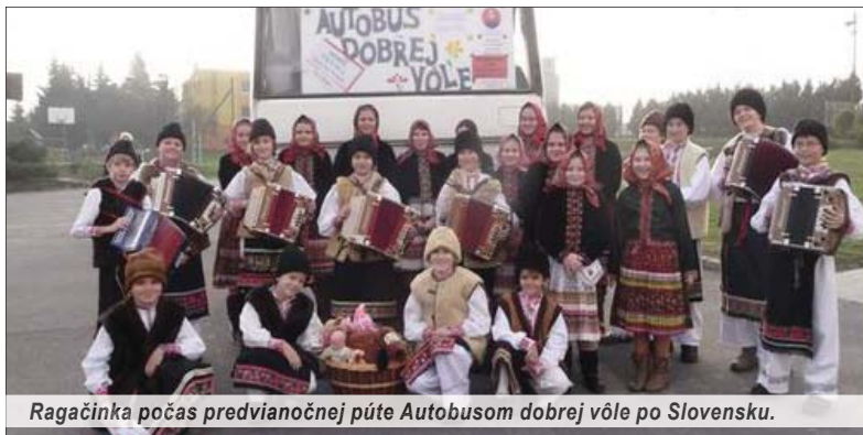
Ragačinka počas predvianočnej púte Autobusom dobrej vôle po Slovensku.