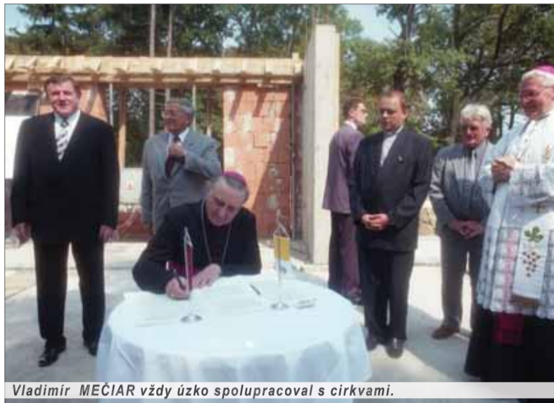
Vladimír MEČIAR vždy úzko spolupracoval s cirkvami.

Základný problém dnešnej doby je v katastrofálnom hospodárení s ľudskými zdrojmi. Vláda sa chváli percentom nezamestnaných, ale to sú len tí, čo sú evidovaní na štatistických úradoch. Vláda uznáva, že tristo- až štyristotisíc ľudí máme zamestnaných v zahraničí. To znamená, že nezamestnaných, ktorí nemajú na Slovensku prácu a sú v produktívnom veku, máme minimálne sedemstotisíc. Aké to má dôsledky, keď toľko ľudí Slovensko nevie uživiť, dať im prácu? Náklady má štát aj rodiny s deťmi. Tým, že vzdelaní ľudia odídu do zahraničia, sú tieto náklady v ekonomickom slova zmysle stratené. Financujeme prípravu pracovnej sily