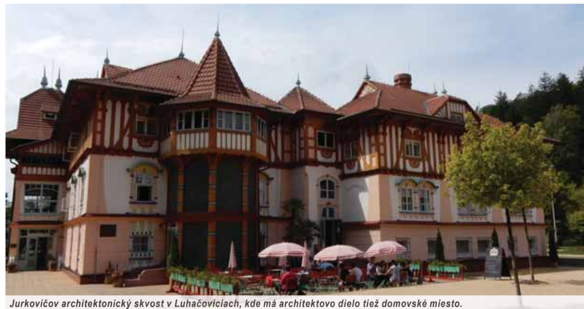
Jurkovičov architektonický skvost v Luhačoviciach, kde má architektovo dielo tiež domovské miesto.

Dodávame ešte, že vystavené pôvodné predmety dopĺňajú reprodukcie Jurkovičových plánov a náčrtov. Už sme hovorili o nutnosti priťahovať k takýmto živým odkazom veľikánov najmä mladých. Aj preto je dobré, že zobrazovanú minulosť pamätná izba približuje nielen prostredníctvom pôvodných predmetov a reprodukcii. Kvôli názornej predstave je tu model Mohyly M. R. Štefánika na Bradle, ktorý sa roztvára, aby ukázal jej vnútro s hrobkou. Zároveň popri klasickej časti expozície pamätná izba ponúka aj modernú techniku. Veľkoplášňá obrazovka umožňuje virtuálnu prehliadku tvorby Dušana Jurkoviča. Návštevníkom, ktorí majú o tematiku hlbší záujem a chcú sa dozvedieť viac údajov o vystavených predmetoch a ich širších súvislostiach, sú údaje k dispozícii prostredníctvom interaktívnej dotykovej obrazovky. Ostáva len dodať, že ak chcete lepšie spoznať a pochopiť život a dielo významného slovenského architekta Dušana Jurkoviča, navštívte počas jedného dňa moravské Luhačovice aj myjavskú Brezovú pod Bradlom. Oplatí sa!