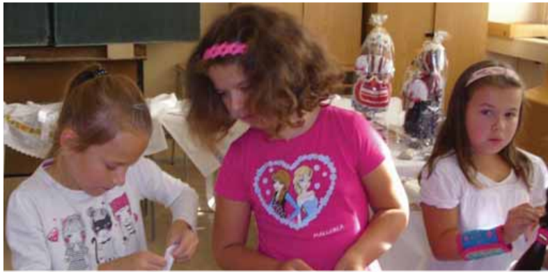
V tvorivých dielnach našli školáci mnoho zaujímavých podnetov a inšpirácií.