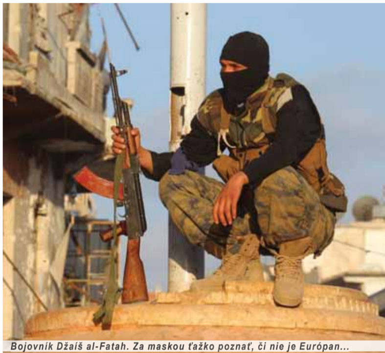
Bojovník Džaiš al-Fatah. Za maskou ťažko poznať, či nie je Európan...