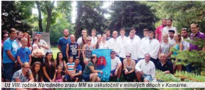
Už VIII. ročník Národného zrazu MM sa uskutočnil v minulých dňoch v Komárne.

Dvojďňový zraz sa uskutočnil v Komárne nadväzujúc na úspech Národných matičných slávností a tiež aj preto, lebo výbor MM sa rozhodol rozložiť sily mladých matičiarov na viacero významných podujatí organizovaných do konca roka 2016. Zraz sa začal už tradičným predstavením prítomných zástupcov OMM, čo je potrebné najmä vo vzťahu k novým členom MM. Vyhodnotili sa už zrealizované spoločné podujatia za prvý polrok a odzneli návrhy na aktivity do najbližších mesiacov. Na zasadnutí sa stručne predostrel životné osudy Vajanského a Dulu so sústredením na ich mladé roky. Ukázalo sa, že aj