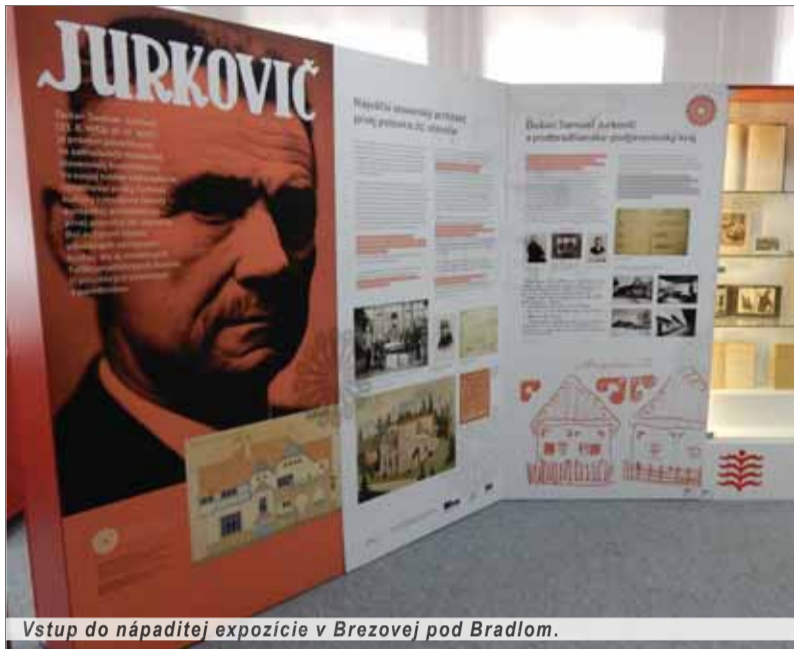
Vstup do nápaditej expozície v Brezovej pod Bradlom.

Stavby Dušana Jurkoviča, vytvorené pre Luhačovice, zarážajú len v priebehu troch rokov!, spájajú motívy regionálnej karpatskej ľudovej tvorby s dekoratívnymi princípmi secesie. Treba si uvedomiť, že architektúra kúpeľov korešponduje aj s vrcholiacim emancipačným hnutím stredoeurópskych slovanských národov, usilujúcich o sebaidentifikáciu. Okrem iného aj prostredníctvom ľudovej kultúry predstavujúce hmatateľné korene spájajúce s generáciami predkov. Touto syntézou sa luhačovické kúpele skutočne líšia od dlhého radu významných európskych kúpeľov. Architektonický výraz týchto je totiž často doslova mdlý, viac či menej unifikovaný až únavne