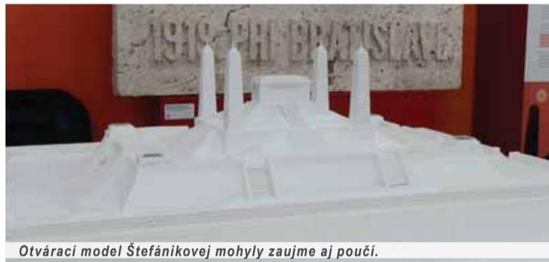
Otvárací model Štefánikovej mohyly zaujme aj poučí.

československej jednoty. Na konci dvadsiatich rokov minulého storočia, v čase, keď väčšina kúpeľných miest na západe Čiech bola prakticky