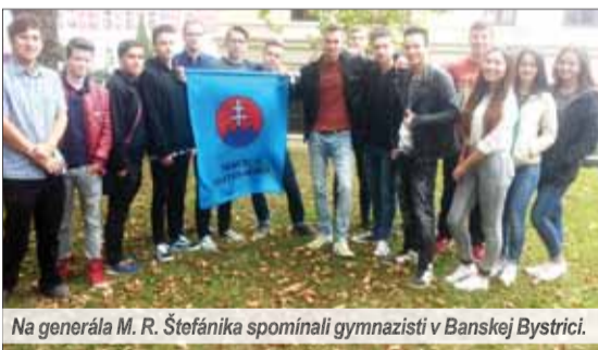
Na generála M. R. Štefánika spomínali gymnazisti v Banskej Bystrici.

Aj tieto myšlienky patria jednej z najvýznamnejších a najpopulárnejších osobností slovenských dejín – hrdinovi a generálovi Milanovi Rastislavovi Štefánikovi. Rámcovali stretnutie na pôde Evanjelického gymnázia v Banskej Bystrici, kde sa pri príležitosti stého výročia založenia Česko-slovenskej národnej rady v Paríži, ktorej bol M. R. Štefánik podpredsedom, uskutočnila 26. septembra 2016 prednáška o živote