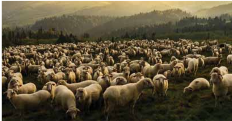
Aj chovy našich roľníkov potrebujú starostlivosť štátu a finančné injekcie.

Slovenská poľnohospodárska a potravinárska komora (SPPK) zorganizovala následne stretnutie zástupcov poľnohospodárskych komôr krajín V4 v Modre. Spoločne vyzvali Európsku komisiu na prijatie skutočných opatrení, ktoré budú viesť k stabilizácii v sektore rastlinných a živočíšnych