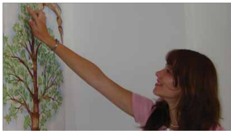
Rodostromy môžu veľa napovedať o rodinách a ich členoch aj v niekoľkých pokoleniach.

So sídlom v Prahe bola zriadená Platforma európskej pamäti a svedomia, ktorá má kanceláriu v Bruseli. Vydala čítanku pre študujúcu mládež Aby sme nezabudli. Informuje o totalitných režimoch v Európe, a keďže je na Sloven-