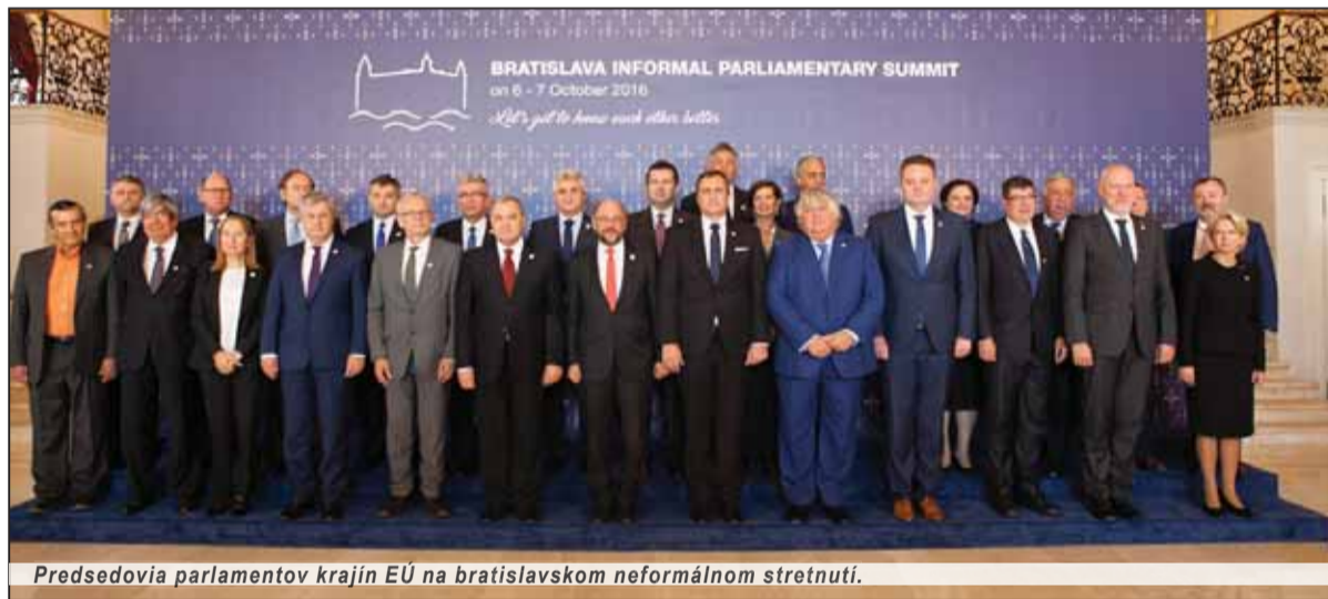
Predsedovia parlamentov krajín EÚ na bratislavskom neformálnom stretnutí.

„V Bratislave vznikol projekt, ktorý pomôže Európskej únii prekonávať problémy.“ Oznámil to po skončení podujatia predseda Národnej rady Slovenskej republiky a pozývateľ Andrej Danko. „Samit je veľmi dôležitý. Po bratislavskom samite lídrov EÚ je dôležité, aby aj predsedovia parlamentov diskutovali o budúcnosti EÚ po rozhodnutí Británie opustiť Úniu,“ potvrdil hodnotenie samitu aj predseda Európskeho parlamentu Martin Schulz.