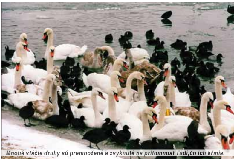
Mnohé vtácie druhy sú premožené a zvyknuté na prítomnosť ľudí, čo ich kŕmia.