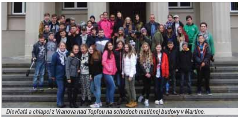
Dievčatá a chlapci z Vranova nad Topľou na schodoch matičnej budovy v Martine.

žiakom venovali skúsení matiční odborníci, ktorí im zaujímavým a pútavým spôsobom priblížili nielen život významných osobností, ale aj dôležité udalosti dejín Slovenska, o ktorých poznatky žiaci nadobúdajú v školskom prostredí. Vedomosti spojené s bezprostrednou skúsenosťou a poznaním sú tým najlepším stavebným kameňom vzdelania. Matiári chcú na tejto osobnostnej stavbe našej mladej generácie ďalej intenzívne pracovať.