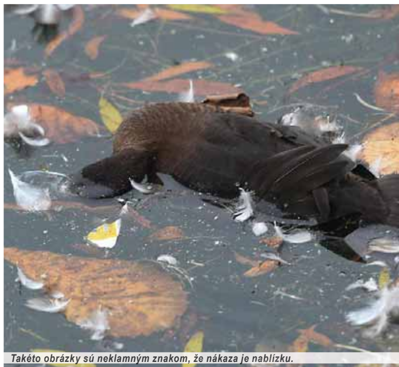
Takéto obrázky sú neklanným znakom, že nákaza je nablízku.

Prípady výskytu vtácej chrípky hlásili v uplynulých týždňoch nielen z viacerých oblastí Rakúska, ale aj z Nemecka, zo Švajčiarska, z Chorvátska, zo Slovinska, z Francúzska, Rumunska, Maďarska, Poľska, Dánska či Holandska. Dá sa povedať, že vtáčia chrípka je všade, Slovensko nie je nijaká výnimka.