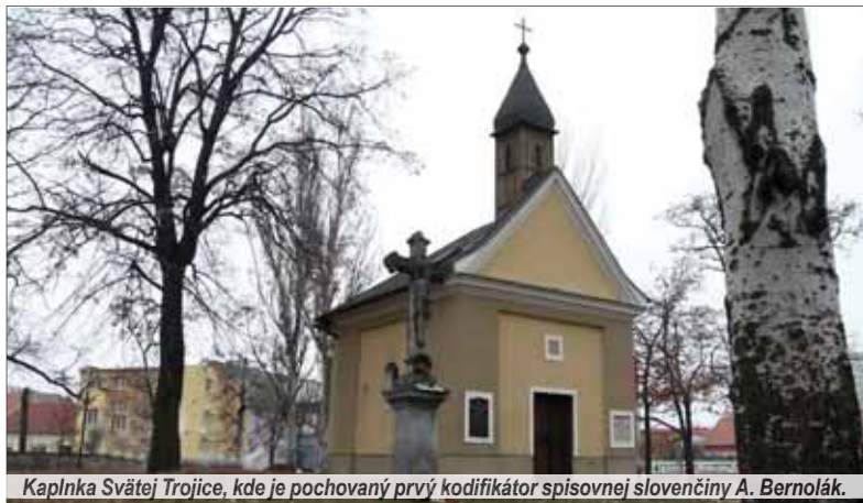
Kaplnka Svätej Trojice, kde je pochovaný prvý kodifikátor spisovnej slovenčiny A. Bernolák.

Pri príležitosti 110. výročia úmrtia Antona Bernoláka na priečelí tejto kaplnky Československá osvetová jednota odhalila v roku 1923 pamätnú tabuľu na jeho počesť. Túto udalosť zaznamenáva aj kronika prvej slovenskej ľudovej školy v Nových Zámkoch, ktorá bola otvorená v roku 1919, takto: „Slávnosť bola skvele zriadená, ale, žiaľbohu, špatné počasie pokazilo i ten najkrajší úmysel. Taký dážď sa lial od rána do polednia, že ťažko bolo aj na ulicu vyjsť. Voda tiekla potokmi. Čo to malo znamenať? Snáď aj nebo nám chcelo ukázať svoju štedrosť pri oslávení jeho pamiatky?