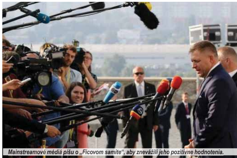
Mainstreamové médiá píšú o „Ficovom samite“, aby znevážili jeho pozitívne hodnotenia.

bolo výrazne viac, ako bol priemer EÚ a eurozóny. Najväčší podiel na jeho raste mala však domáca spotreba pre klesajúcu nezamestnanosť