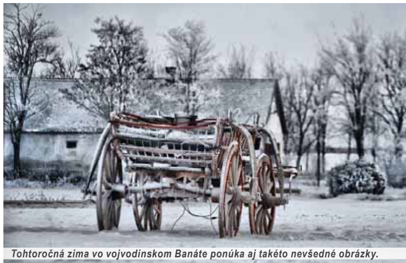
Tohtoročná zima vo vojvodinskom Banáte ponúka aj takéto nevšedné obrázky.

Žiaľ, skutočnosť je taká. Finančná situácia je zložitá, budúcnosť závisí od profesijného uplatnenia sa, preto potrebujeme občianstvo EÚ, t. j. ktoréhokoľvek jej členského štátu. No slovenskosť