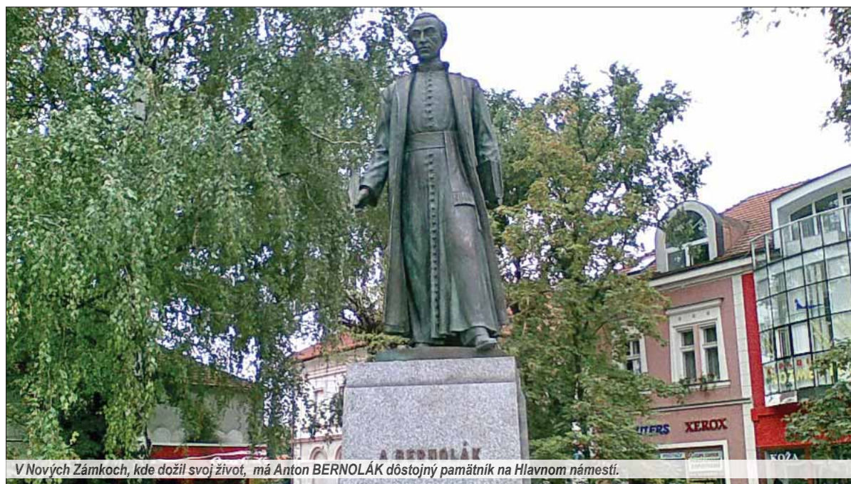
V Nových Zámkoch, kde dožil svoj život, má Anton BERNOLÁK dôstojný pamätník na Hlavnom námestí.