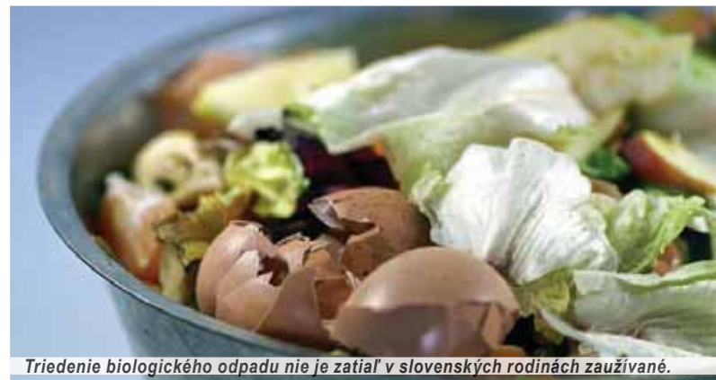
Triedenie biologického odpadu nie je zatiaľ v slovenských rodinách zaužívané.

Dodržiavanie zákona o odpadoch sú oprávnené kontrolovať pris-