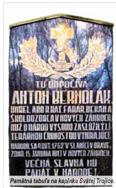
Pamätná tabuľa na kaplnke Svätej Trojice.

Toľko historický zápis. Dodajme, že Anton Bernolák pochádzal z oravského prostredia; narodil sa v zemian-