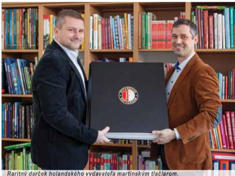
Raritný darček holandského vydavateľa martinským tlačiarom.