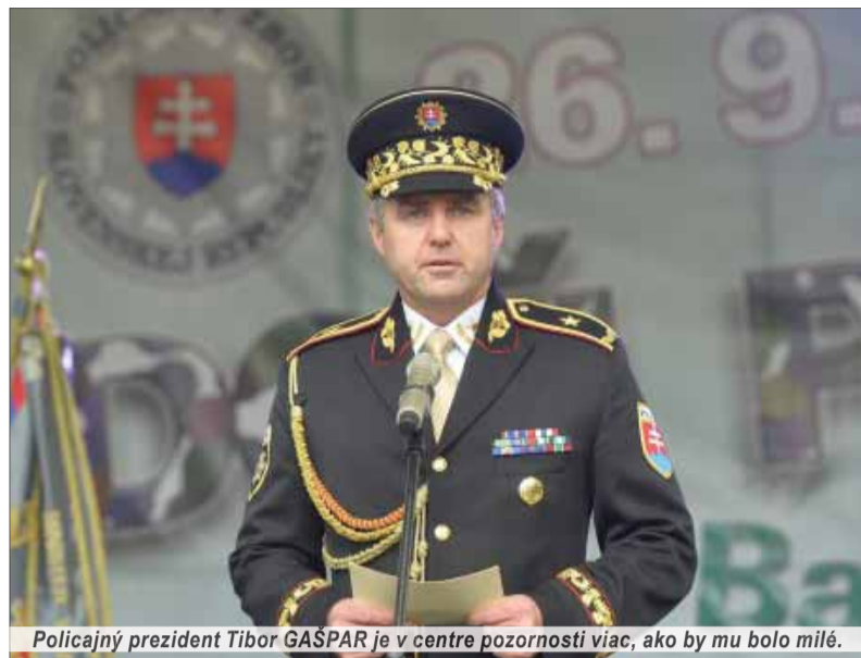
Policajný prezident Tibor GAŠPAR je v centre pozornosti viac, ako by mu bolo milé.