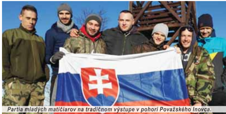
Partia mladých matičiarov na tradičnom výstupe v pohorí Považského Inovca.

Počas podujatia tiež rekapitulovali činnosť v uplynulom roku a pripomenuli si športové a spoločensko-kultúrne akcie a národovecké aktivity, ktoré zaujali nielen obyvateľov obce Veľké Hoste, ale aj širší región. Mladí matičiari sa ubezpečili, že pracovať pre národ sa dá v rôznych podmienkach a zaujať širokú verejnosť národnou ideou aj v súčasnosti, najmä ak sa za vzájomnú spoluprácu oduševnia aj obecné samosprávne orgány, spoločenské a kultúrne organizácie v regióne. Ako pri tejto príležitosti odznelo, v nastolenom kurze treba pokračovať, matičné podujatia