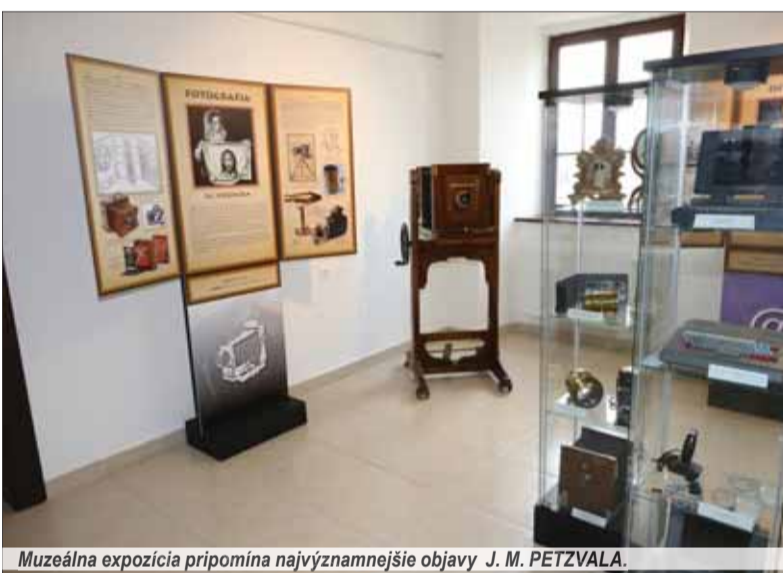
Muzeálna expozícia pripomína najvýznamnejšie objavy J. M. PETZVALA.