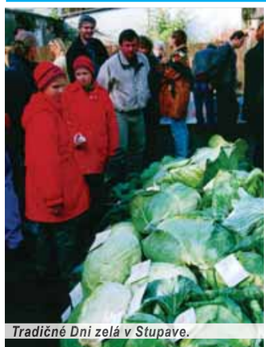
Tradičné Dni zelá v Stupave.

a teplá klíma vyhovujú pestovaniu kapusty, a zabezpečujú jej osobitnú chuť. Stupavské „zelé“ – kyslá kapusta, je unikátna špecialita, na ktorej výrobe sa používajú neskoré odrody bielej hlávkovej kapusty dopestované vo vymedzenom území, jedlá soľ a v primeranom množstve