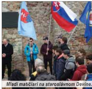
Mladí matičiari na staroslávnom Devíne.

sa už mladí matičiari vybrali po stopách štúrovcov na Devín. Na úvod výstupu sa konalo slávnostné kladenie vencov k pamätnej tabuli, ktorá bola osadená v roku 1936 na počesť stého výročia výletu štúrovcov na Devín. Na tomto mieste zaspievali spoločne pieseň Smieť žiť pre Krista. Mladí matičiari prispeli aj aktívne k slávnostiam na Devíne, keďže časť z nich mala na starosti stanovište s propagáciou Matice slovenskej určenej mládeži