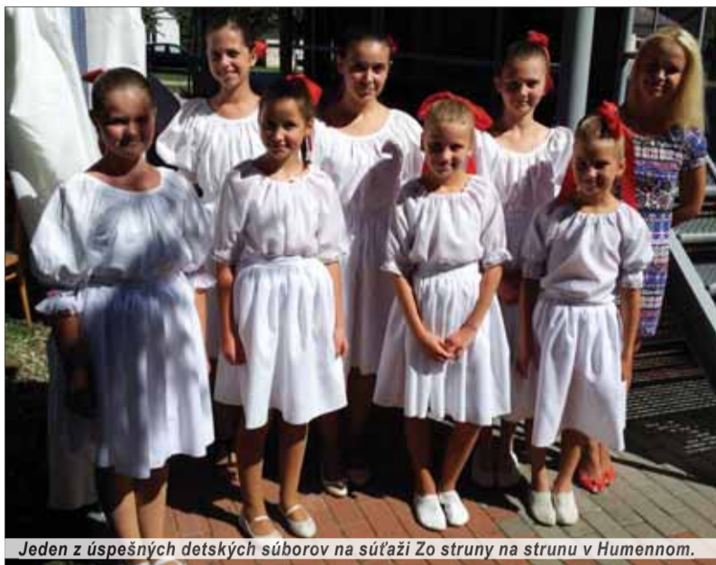
Jeden z úspešných detských súborov na súťaži Zo struny na strunu v Humennom.

Tieto hodnoty najmä (aj) v oblasti folklórneho umenia úspešne udržujú a zveľaďujú ich potomkovia aj dnes.