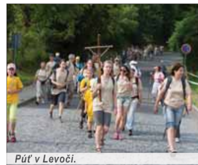
Púť v Levoči.

Pútnické hnutie je dnes v cirkvi veľmi živé. V roku 2000 sa uskutočnil Svetový Deň Mládeže v Ríme a my sme dostali pozvanie talianskych jezuitov zúčastniť sa na ňom v medzinárodnom programe Horizont 2000. Na podujatie zo Slovenska odišli štyri autobusy mladých ľudí a organizá-