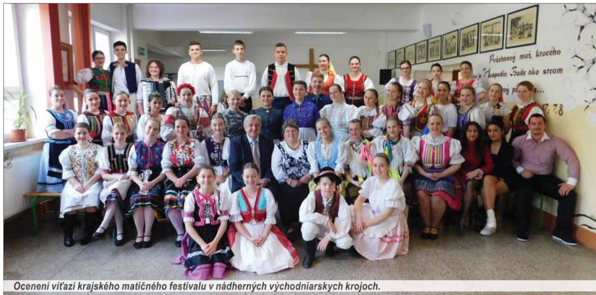
Ocenení víťazi krajského matičného festivalu v nádherných východniarskych krojoch.

Na Evanjelickom gymnáziu J. A. Komenského v Košiciach sa nedávno uskutočnil už 13. ročník krajského matičného festivalu Ludová pieseň košickej mládeže. Hlavnými usporiadateľmi tejto ľudovej parády boli Matica slovenská zastúpená MO MS v Košiciach-Myslave, mesto Košice, odbor školstva OÚ v Košiciach a v Prešove a spoluosporiadateľské Evanjelické gymnázium.