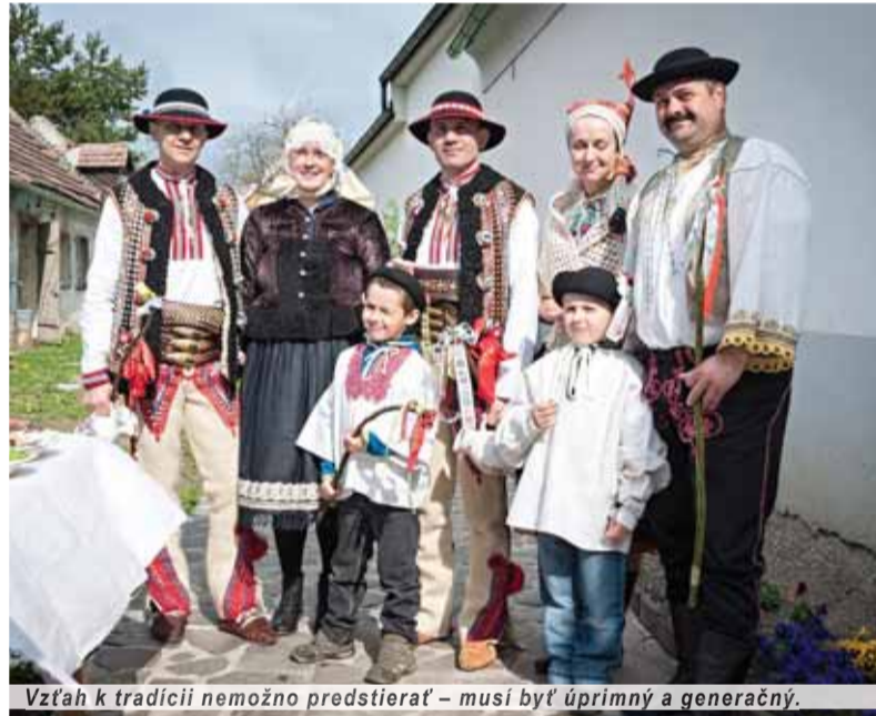
Vzťah k tradícii nemožno predstierať – musí byť úprimný a generačný.

to bez obáv dať aj svojim deťom. Dnes však každú chvíľu vychádzajú na povrch rôzne potravinové aféry. Tu pokazené mäso, tam striekaná zelenina i ovocie a nikto nevie čím a koľko. Ale ľudia to kupujú, lebo je to „lacné“. Naučili nás krmiť sa odpadom, ktorý k nám dovážajú obchodné reťazce, no i médiá nás krmia tým, že je to pre nás výhodné, lebo je to lacné. Nechcú, aby sa ľudia opäť vrátili k svojmu hospodáreniu na pôde, k svojmu pestovaniu – a to nehovorím o mestách, lebo tam nie je kde, ale aj na takom balkóne sa dá dnes dopestovať čo-to. Ale v obciach, kde majú dnes záhrady zatravnené, ktoré musia furt kosiť, aby mali ideálny trávnik – a na čo im je? Niektorí našich ľudí pekne roky nabáda k lenivosti. Ale nájdú sa aj takí, čo si radi priplatia za zdravé potraviny, a tu je priestor