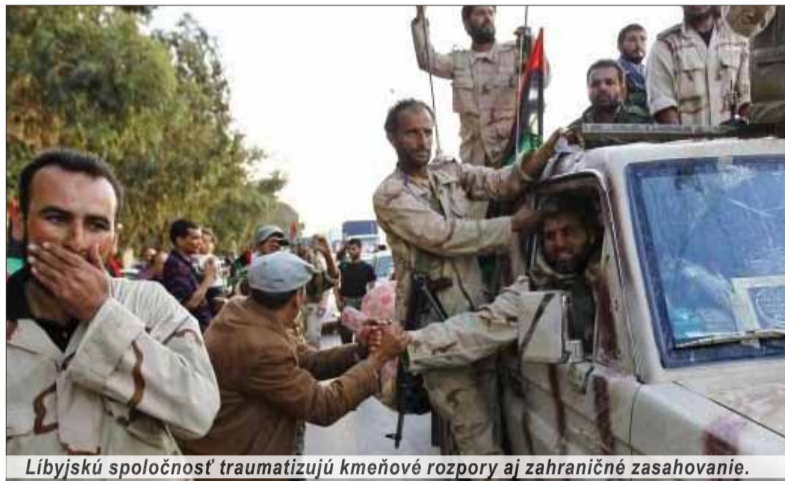
Líbyjskú spoločnosť traumatizujú kmeňové rozpory aj zahraničné zasahovanie.

Slovník Maltúskej deklarácie jasne hovorí o tom, že EÚ si uvedomuje realitu: „Tam, kde je to možné, EÚ a členské štáty tiež posilnia spoluprácu a asistenciu líbyjským regionálnym a lokálnym komunitám a medzinárodným organizáciám, ktoré pôsobia v krajine.“ Priznal to aj maltský predseda vlády Joseph Muscat, keď povedal: „Čaká nás ešte veľa práce s kmeňmi na juhu Líbye, ktoré si budujú biznis na prevádzaní, čo im samým nie je príliš po chuti, a hľadajú cestu von. S tým by im mala pomôcť práve Európa, podľa niektorých odha-