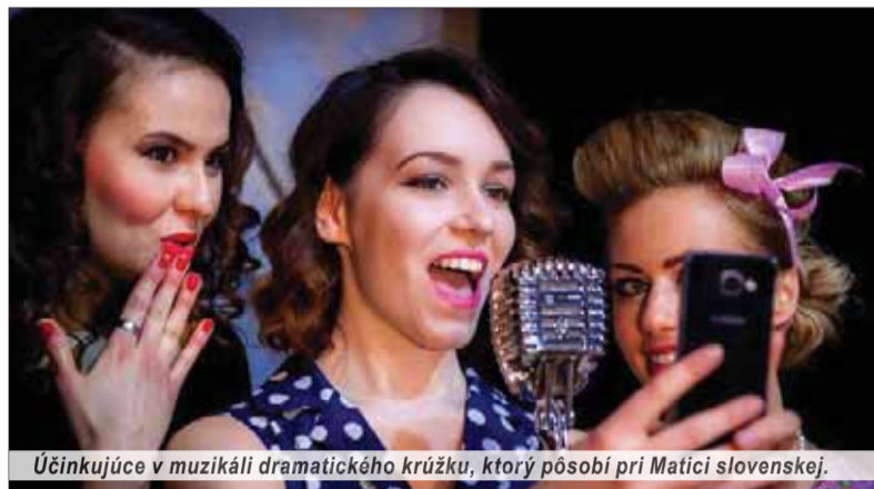
Účinkujúce v muzikáli dramatického krúžku, ktorý pôsobí pri Matici slovenskej.