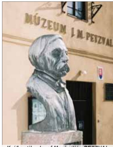
Kráľ optiky Jozef Maximilián PETZVAL.