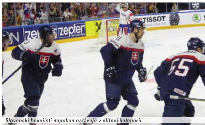
Slovenskí hokejisti napokon ostávajú v elitnej kategórii.

Naši reprezentanti prehrou definitívne prišli o šancu postúpiť do štvrtfinále a zároveň stále nemali istotu udržania sa v A-skupine. Slovenskí fanúšikovia sa v zápase prvýkrát tešili v tridsiatej prvej minúte, keď padol prvý slovenský gól od zápasu s Nemeckom. Slováci sa ho dočkali po viac ako sto tridsia-