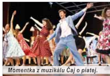
Momentka z muzikálu Čaj o piatej.