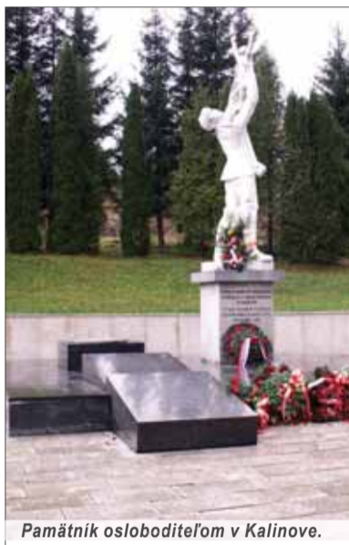
Pamätník osloboditeľom v Kalinove.

„V čase, keď sa náš zbor priblížil ku kóte 534, prenikal ku slovenským hraniciam medzerou v nepriateľskej obrane 1. gardový jazdecký zbor. Pätnásteho septembra dosiahli jeho predsunuté sily slovenské hranice. Nepriateľ však vyvíjal všetko úsilie, aby nedovolil ďalším jednotkám nasledovať“ sovietske jazdecké, spomínal armádny generál Ludvík Svoboda. Uvedené skutočnosti potvr-