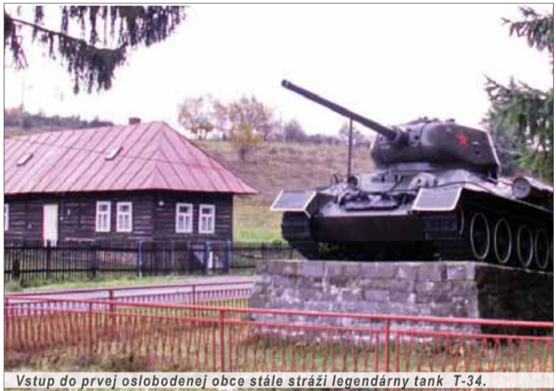
Vstup do prvej oslobodenej obce stále stráži legendárny tank T-34.