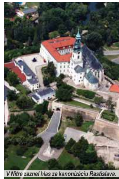
V Nitre zaznel hlas za kanonizáciu Rastislava.