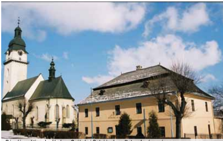
Bývalá meštianska škola v Spišskej Belej je dnes Petzvalovým múzeom.