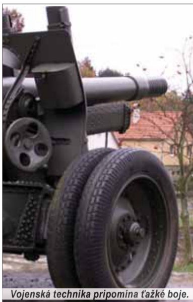
Vojská technika pripomína ťažké boje.