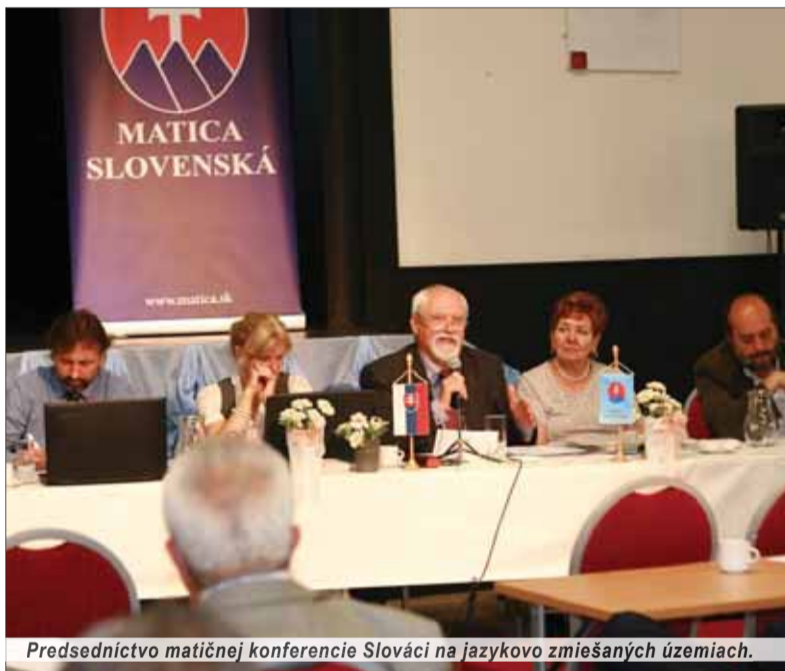
Predsedníctvo matickej konferencie Slováci na jazykovo zmiešaných územiach.