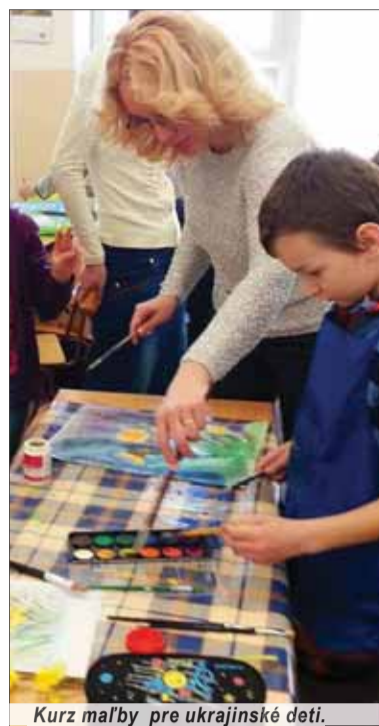
Kurz maľby pre ukrajinské deti.

Prvé dotačné výzvy by mala inštitúcia naformulovať už na začiatku roka