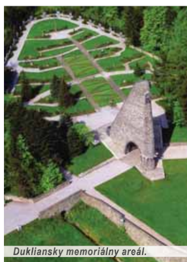
Duklianský memoriálny areál.

bol spoločenský program, ktorý sa sústredil najmä v priestoroch Vyhliadkovej veže na Dukle vo Vyšnom Komárniku a v okolí. Okrem panorámy slovensko-poľského územia, ktoré bolo dejiskom bojov počas prvej svetovej