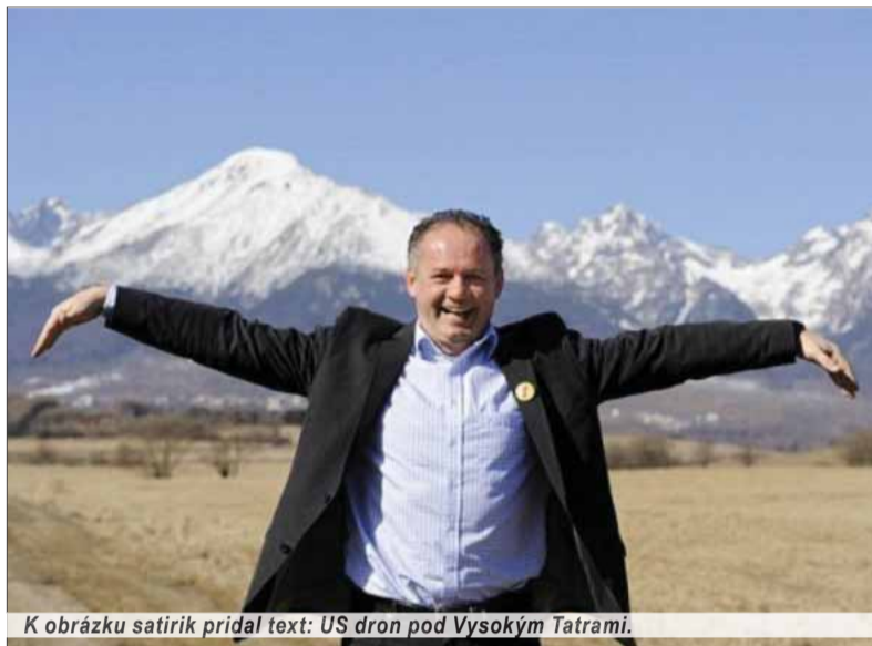
K obrázku satirik pridal text: US dron pod Vysokým Tatrami.

Konanie Andreja Kisku však nie je v rozpore len s ústavou, ale