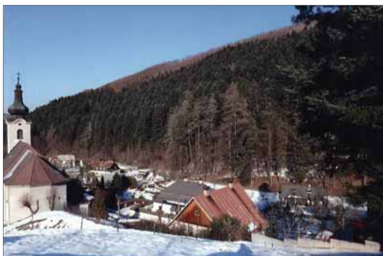
Pekný, takmer storočný jedľový porast obklopuje abovskú horskú dedinku Opátka vo Volovských vrchoch. Vznikol umelým zalesnením obecných pastvín v roku 1919. V obecnej kronike stojí, že do výsádzania stromčekov sa vtedy brigádnicke zapojili všetci obyvatelia obce.

Dosť chodím, a tak vidím, že na mnohých miestach Slovenska sa jej darí. Na východnom Slovensku, napríklad v Čergovskom pohorí v hornom Šariši i v Hnileckej doline, pekné jedľové porasty