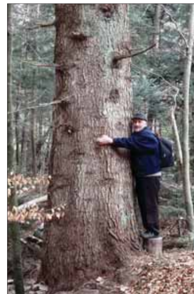
Táto 140-ročná jedľa je ozdobou lesa v masive Kojšovskej hole vo východnej časti Slovenského rudohoria. Je stále zdravá a bohatá plodí.

Múdry svoje zdravie, výživu, výchovu a bezpečnosť... nezveruje cudzím, nepreberá cudzorodé ideológie a koncepcie, nepredáva vlastnú zem a jej zdroje, nevyháňa svoje deti – svoj najväčší rozvojový potenciál – slúžiť vlasti, keď doma po stáročných zápasoch v konečne už slobodnej vlasti je práca „ako na kostole“, a uvedomuje si, že každá závislosť či dokonca odkázanosť vždy znamenajú aj stratu slobody a neraz i dôstojnosti. Pretože celospoločenské zdravie je výsostne komplexný jav, vyžaduje si zásadné riešenia a systémové opatrenia. Pri jeho ozdravení je účinná výhradne podľa spoločne prijatých a záväzných pravidiel centrálna riadená a štátom garantovaná spolupráca všetkých zainteresovaných subjektov, čiže fakticky celého národa. Akékoľvek izolované čiastkové individuálne iniciatívy sú iba „nosením vody v koši“. V tejto súvislosti vyzývame všetkých občanov Slovenskej republiky, aby prekonal svoju pohodlnosť, ľahostajnosť a pasivitu