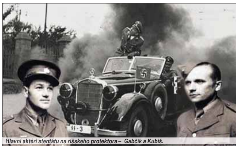
Hlavní aktéri atentátu na ríšskeho protektora – Gabčík a Kubiš.

Možnosť realizovať atentát sa objavila už 3. októbra 1941 na