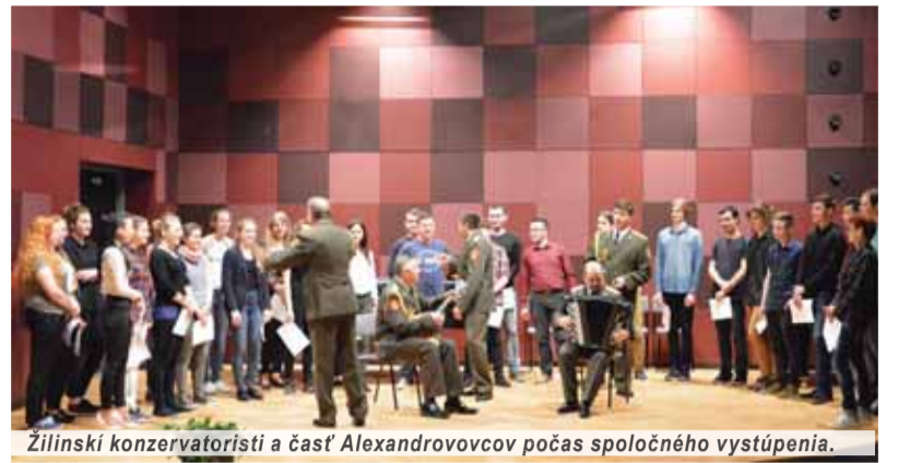
Žilinskí konzervatoristi a časť Alexandrovovcov počas spoločného vystúpenia.