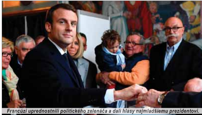
Francúzi uprednostnili politického zelenáča a dali hlasy najmladšiemu prezidentovi.

V susednom Rakúsku vidíme takisto nástup politika, ročník 1986, ktorý sa profiluje ako odlišnosť od tradičnej ľudovej strany „čiernych“, z ktorej vzišiel ako najmladší rakúsky a európsky minister zahraničných vecí. Ukázalo sa, že nie on Christian Kurz sa má čo učiť, ale naopak rozdáva lekcie. A to nielen na domácej, ale aj na európskej politickej scéne. Jednak vytrvalým upozorňovaním, že bezpečnosť Európy nemožno dosiahnuť proti Rusku, ale len s Rus-