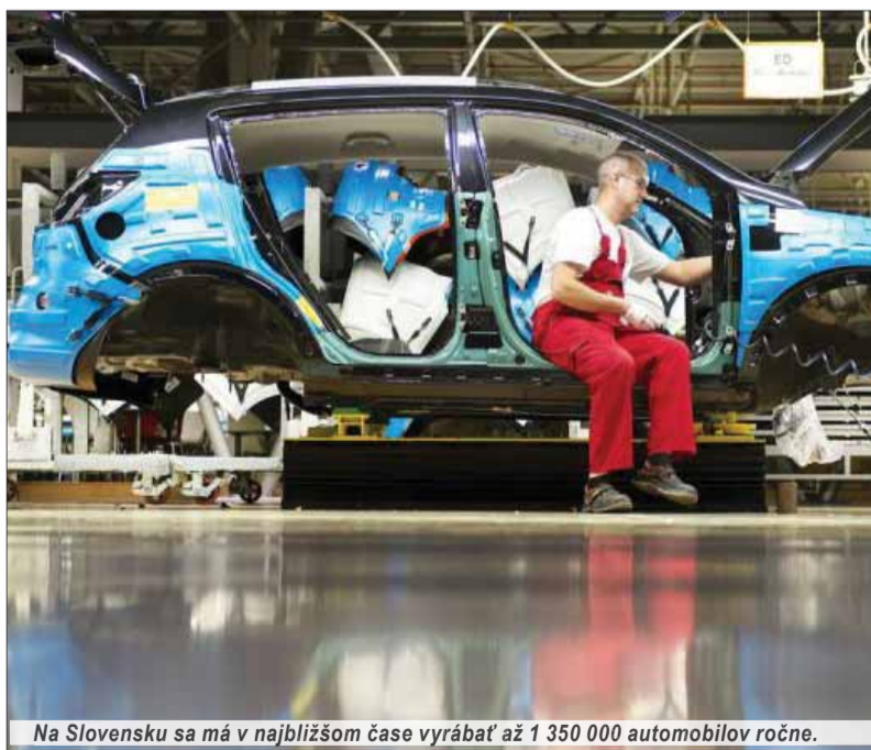
Na Slovensku sa má v najbližšom čase vyrábať až 1 350 000 automobilov ročne.

Podľa nedávno publikovaného záverečného účtu za rok 2016 je na tom Slovensko dobre vo všetkých makroekonomických ukazovateľoch, a preto treba kvitovať pre-