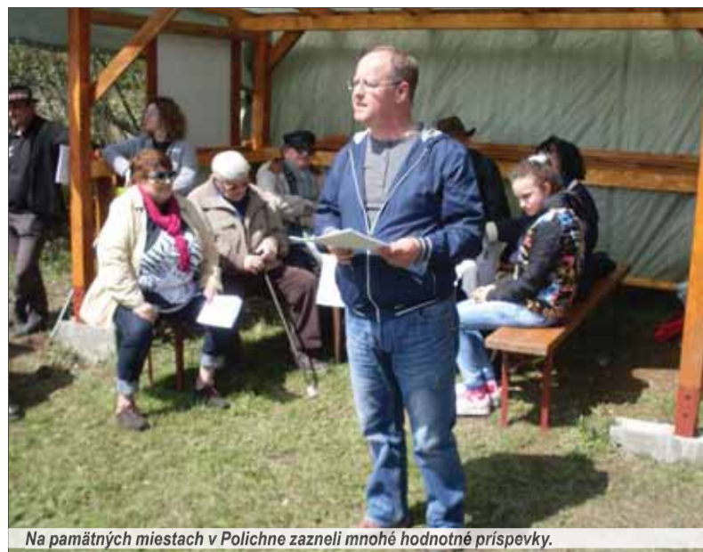
Na pamätných miestach v Polichne zazneli mnohé hodnotné príspevky.

Posledné leto bola Timrava v kúpeľoch Sliač. Dvadsaťdruhá novembra 1951 dopoludnia ju u Petrivaldských postihla prvá mozgová príhoda. Po týždennom zápase 27.