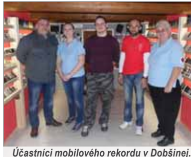
Účastníci mobilového rekordu v Dobšinej.