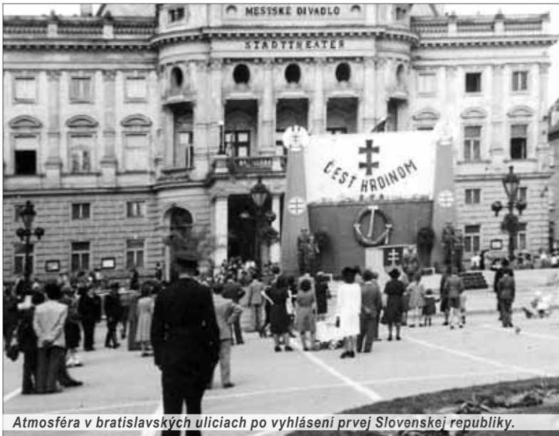
Atmosféra v bratislavských uliciach po vyhlásení prvej Slovenskej republiky.

autonómie Slovenska. Cieľom tohto úradu malo byť šírenie pozitívnej propagandy, týkajúcej sa Slovenska a jeho novej vlády. ... Úrad propagandy vytváral aj negatívnu propagandu, ktorá sa zamerala najmä proti bolševizmu, čechoslovakizmu a židovskému obyvateľstvu. Úrad vykonával aj cenzúru a zároveň usmerňoval najdôležitejšie médiá: tlač, rozhlas, film a literatúru.“