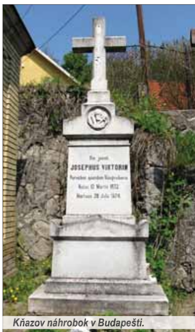
Kňazov náhrobok v Budapešti.

prostredí v Budíne. V kostole farnosti sv. Petra a Pavla (neďaleko dnešného Arpádovho mosta) pôsobil tri a pol roka – až do konca roka 1855. Potom „postúpil“ priamo do stredu krajiny. V januári 1856 nastúpil ako kaplán vo farnosti pri Kostole sv. Anny, kde pôsobil vyše desať rokov, do apríla 1866. Až po devätnástich rokoch od kňazskej vysviacky získal „systemizované“ miesto farára v mestečku Visegrad (Vyšehrad), s nemecky hovoria-