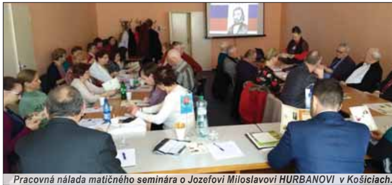
Pracovná nálada matičného seminára o Jozefovi Miloslavovi HURBANovi v Košiciach.