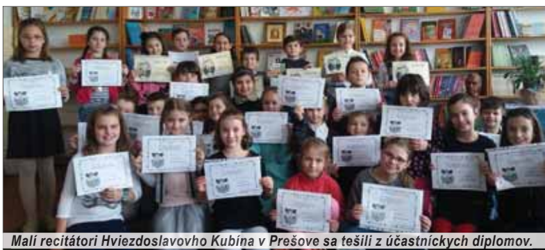
Malí recitátori Hviezdoslavovho Kubína v Prešove sa tešili z účasťníckych diplomov.

„Náš materinský jazyk je krásny a ponúka mnoho možností vyjadriť sa k akejkoľvek téme. Záujem o recitovanie medzi deťmi a mládežou začína upadať. Ktovie prečo? Ale dnes som sa presvedčila o tom, že deti o recitácii majú záujem. Bol to krásny zážitok a deti podali skvelé výkony. Vyhrať sice mohli len tí najlepší, ale aj ostatné deti majú krásnu skúse-