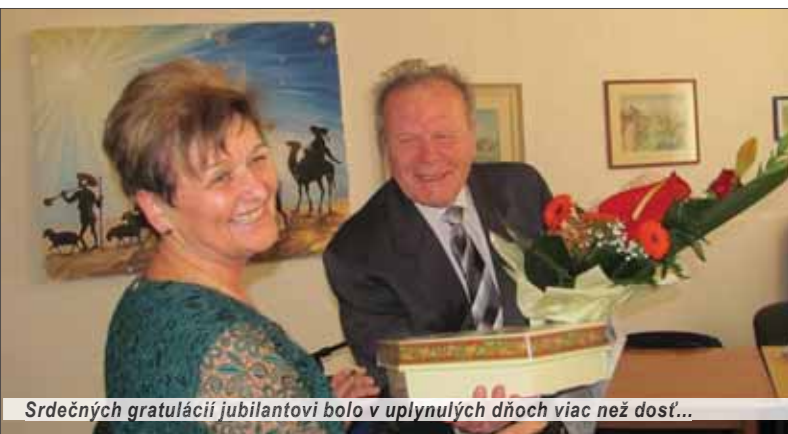
Srdečných gratulácií jubilantovi bolo v uplynulých dňoch viac než dosť...