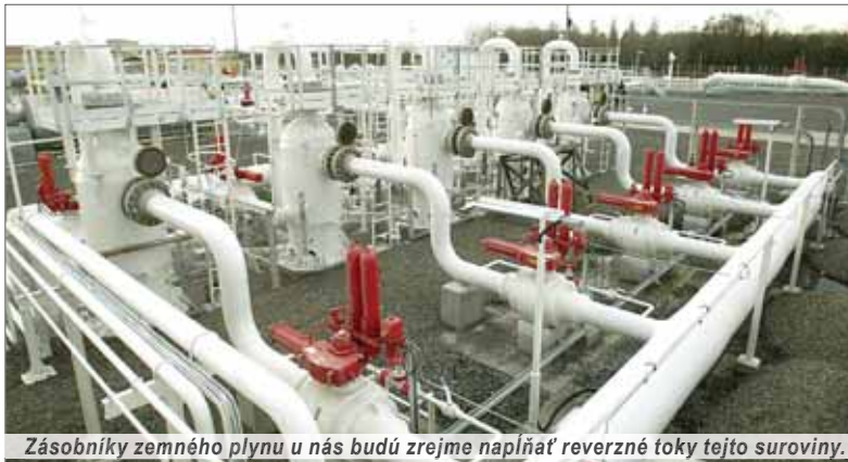
Zásobníky zemného plynu u nás budú zrejme naplňať reverzné toky tejto suroviny.

Nárast zaťaženia a vznikajúca nerovnováha v bilancií medzi spotrebou a výrobou elektrickej energie, ale aj úsilie optimalizovať prevádzku zdrojov núti jednotlivé národné elektrizačné systavy hľadať možnosti vzájomnej spolupráce s okolitými sústavami. Maďarsko najnovšie súhlasilo s novým prepojením a Slovensku umožní vyvážať nadbytočnú elektrinu z jadra. Obe prepojenia budú mať kapacitu 2 krát 400 kV a súčasná cezhraničná kapacita sa tak zdvojnásobí, uvádza portál Energia.sk.