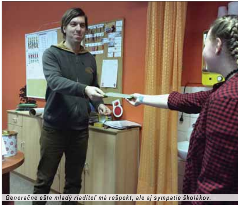
Generácie ešte mladý riaditeľ má rešpekt, ale aj sympatie školákov.

• V spoločnosti sa vytvorila akási davová „verejná“ mienka, ktorá akoby každému diktovala – slovenčina nie je potrebná, dorozumievacím jazykom je angličtina! Roky sa hovorí o dôležitosti znalosti cudzích jazykov, čo nikto nespochybňuje, ale nie je dôležité ovládať najskôr spisovnú slovenčinu?