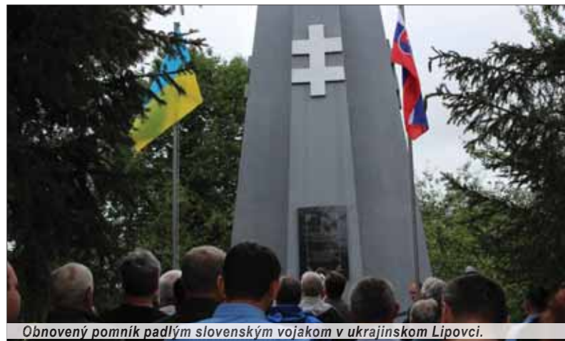
Obnovený pomník padlým slovenským vojakom v ukrajinskom Lipovci.

Po dvadsiatich rokoch má teda Slovensko nepríčetne nafúknutý morálny problém, akoby každá amnestia aj milosť neboli morálnym problémom. Havlove plošné amnestie, po ktorých sa oslobodili vrahovia a lupiči dopúšťali ohavných trestných činov, boli morálne? Kto zruši