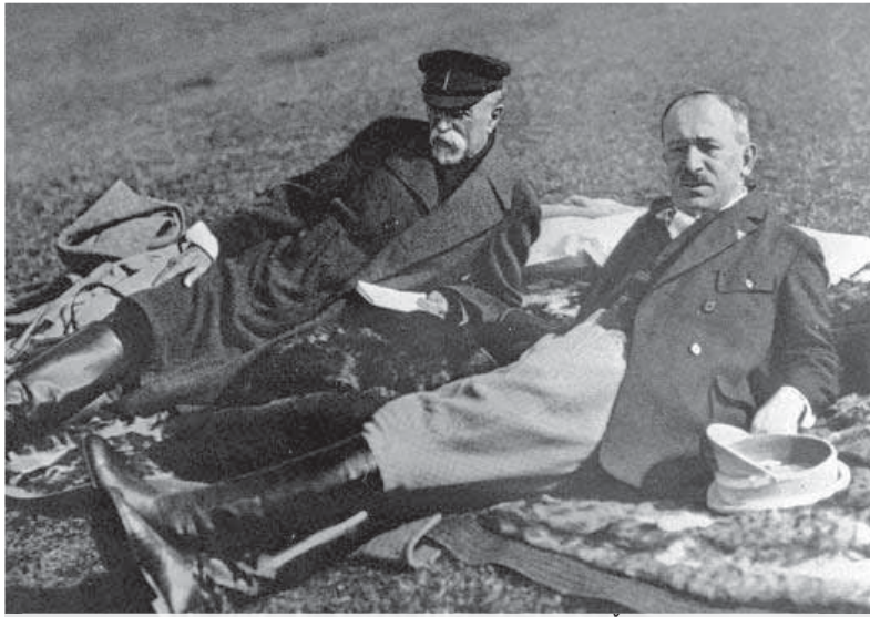
Dvaja z troch dejinami overených zakladateľov štátu Čechov a Slovákov.