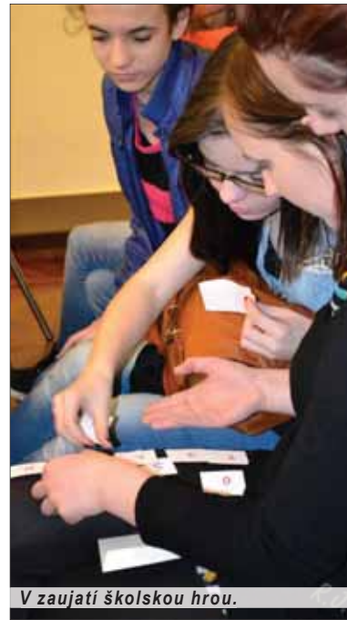
V zaujatí školskou hrou.

Mimochodom, vážení naši učitelia – od tých najstarších až po tých začínajúcich, pri príležitosti blížaceho sa vášho medzinárodného dňa vďaka vám za vzdelávanie a veľa energie do vašej ďalšej práce!