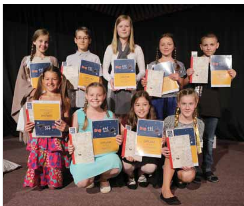
Recitátori II. detskej kategórie po svojom vystúpení na 63. ročníku Hviezdoslavovho Kubína.

Hviezdoslavov Kubín má teda za sebou už šesťdesiat tri rokov.