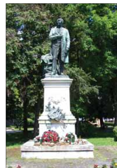
Na centrálnom námestí v Rimavskej Soboti bola jedna socha. Teraz tam majú byť tri – všetky maďarským básnikom!

Témou sa zaoberá MO MS. Moderne zmýšľajúcim občanom mesta zostáva krútiť hlavou a pýtať sa – nemali by ste sa zaoberať (ne)zamestnanosťou, kapacitou materských škôlok, stavom ciest a chodníkov? Nemali by ste slúžiť občanom Slovenska bez ohľadu na ich národnosť? Na aký text ste skladali prísahu poslancov mestského zastupiteľstva? Priority niektorých pánov poslancov v Rimavskej Soboti sú tak pri najmenej sporné. A ako sa uka-