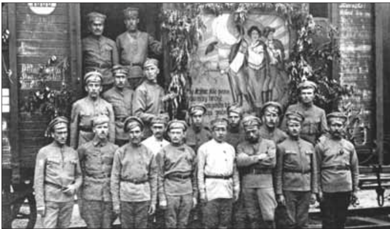
Slovenskí legionári zo 7. česko-slovenského streleckého pluku Tatranského v Rusku 1918.

Nábor českých a slovenských zajatcov sa zintenzívil až po audiencii M. R. Štefánika u cára Mikuláša II. a u ostatných ruských štátnych predstaviteľov v roku 1916. Pôvodný strelecký pluk, ktorý vznikol 2. februára 1916, sa už onedlho (19. mája 1916) rozšíril na Česko-slovenskú streleckú brigádu. Sľubný vývoj sa však