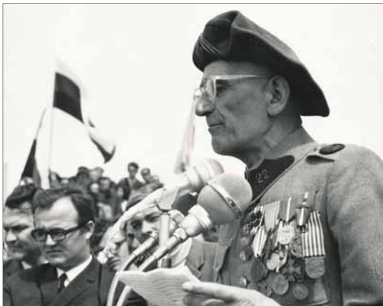
Slávnostný príhovor generála na Bradle v roku 1968 pri Mohyle M. R. Štefánika.

Najprv pracoval v Pullmana pri výrobe vagónov a chodil na večernú strednú