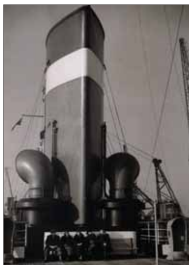
Časť delegácie na palube zaoceánskeho parníka.

Cabadaj. Výstava je otvorená do 31. augusta 2017 v budove Matice slovenskej – v tej budove, v ktorej sa zrodil plán cesty a kde sa konali aj prípravy. V nasledujúcich mesiacoch bude výstava putovať aj do ďalších slovenských miest.