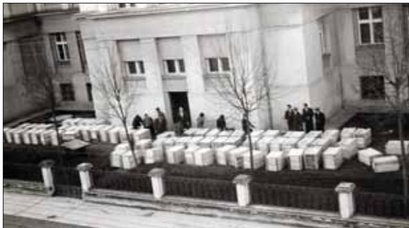
Transportné debny s tlačovinami pre krajanov v USA zaplnili celé nádvorie matičnej budovy v Martine.