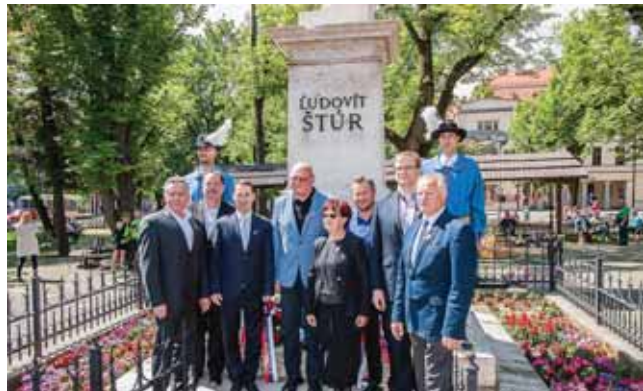
Maticní predstavitelia a vzácní hostia pred Štúrovým pamätníkom v centre starobylej Levoče.

Štúrovské mesto Levoča bolo uprostred júna dejiskom hurbanovských osláv pri príležitosti dvojtého výročia narodenia Jozefa Miloslava Hurbana, súputníka Ľudovíta Štúra.