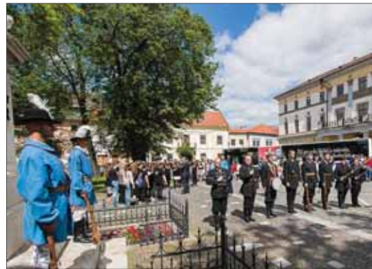
Pekný kolorit levočských architektonických dominánt tvoril skvelú kulisu jubilejnej slávnosti.