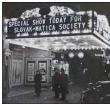
Special show today for Slovak - Matica society - mesto Wilkes Barre - jedno z miest projekcie matičného filmu.