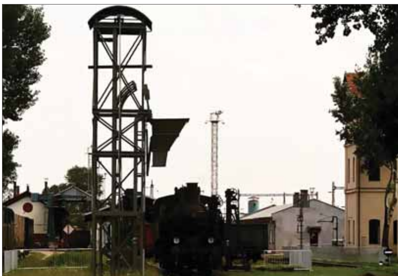
Členovia Klubu priateľov železničnej dopravy sa usilujú, aby MDC malo čo najviac pôvodných zariadení.

V jeho areáli spí svoj slávny sen história našej koľajovej dopravy. A vďaka miestnym nadšencom, aj z radov mládeže, je to sen dôstojný a pútavý. Múzejno-dokumentálne centrum (MDC) Železníc Slovenskej republiky na Rendezi-Východnom v jednej z bratislavských mestských častí nie je iba lokálnou regionálnou expozíciou. To vôbec nie. Areál MDC vracia návštevníka do dávnej i nedávnej histórie koľajovej dopravy všeobecne i na Slovensku.