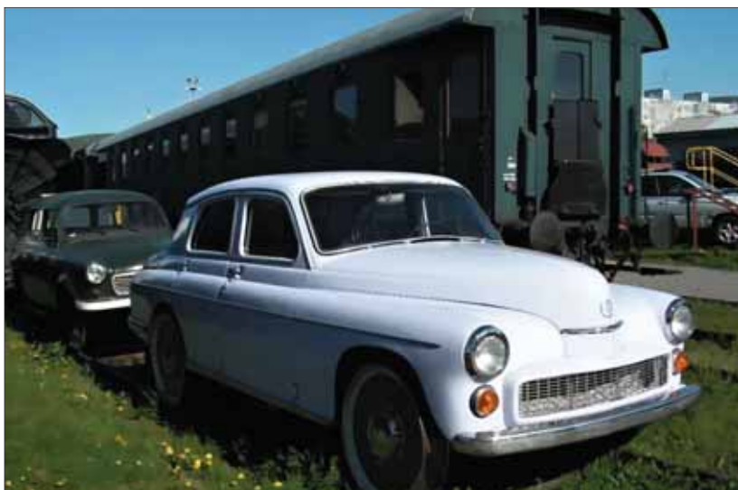
Ako ukázal Deň drezín, po koľajniciach sa pohybovali vozidlá všelijakých tvarov a určenia.