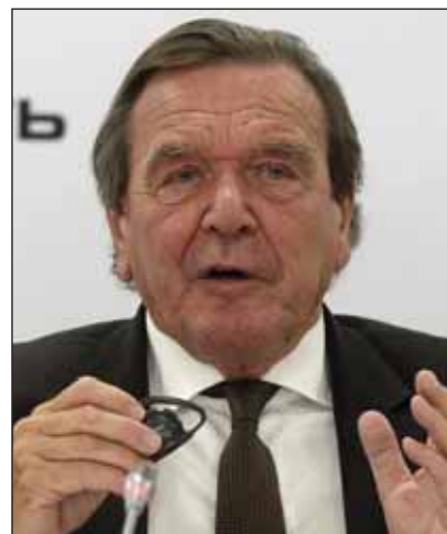
Bývalý populárny nemecký kancelár Gerhard SCHRÖDER na čele najdôležitejších podnikov je pre Rusko skvelou obchodnou značkou.

Uplynulo už dvanásť rokov odvtedy, čo musel sociálny demokrat Gerhard Schröder (nar. 1944) priznať porážku vo voľbách a uvoľniť miesto v úrade kancelára Spolkovej republiky Nemecko. Kancelárom bol v rokoch 1998 – 2005. Vzápätí šokoval všetkých, keď sa objavil na čele svetovej ruskej plynárskej spoločnosti Gazprom. Teraz postúpil ešte vyššie – za predsedu dozornej rady ruskej ropnej spoločnosti Rosneft. Je to Rusku najlojálnejší Nemec. Čo je za tým?