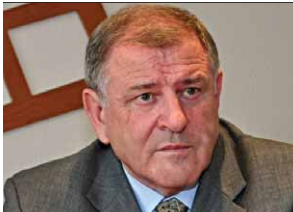
Vladimír MEČIAR sa zmenil aj o „hriechoch“ Michala Kováča st.

„Pokiaľ išlo o amnestie – či áno, alebo nie – treba sa vrátiť do roku 1998,“ pustil sa do objasňovania vzniku príčin udelenia amnestií. V tom čase Michal Kováč skončil v úrade prezidenta SR a vláda si zorganizovala zasadnutie v sídle prezidenta. Aby oznámila, že podľa Ústavy SR preberá právomoci prezidenta na seba a schválila zoznam veľvyslancov, ktorých dovtedy nebolo možné meniť, lebo nebola zhoda medzi prezidentom a vládou. „Nech sme dali akýkoľvek návrh, neprešiel,“ spomínal V. Mečiar a pokračoval: „A zaoberali sme sa otázkou ďalšieho postupu proti prezidentovi SR, pretože pri výkone funkcie urobil veľmi veľa chýb. Dokonca