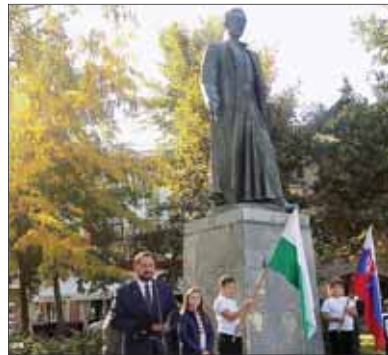
Novozámčania si vďaka dielu Antona BERNOLÁKA, ktorého veľkú časť vytvoril práve v tomto meste. Aj počas tohtoročného Mesiaca kultúry si pripomenuli 255. výročie narodenia tejto významnej osobnosti.

Mesto Nové Zámky a Miestny odbor Matice slovenskej boli začiatkom októbra organizátormi slávnostného otvorenia Mesiaca kultúry v meste Nové Zámky a spomienkových osláv 255. výročia narodenia Antona Bernoláka.