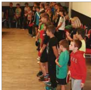
Populárny stolnotenisový turnaj v Nitre sa od tohto roku včlenil do ministerského projektu Stolný tenis do škôl...

V nasledujúcich ročníkoch chcú v Nitre na tento cieľ rozšíriť hraciu plochu aj počet štartujúcich, na čom – ako veria – sa bude podieľať voľnočasový stol-