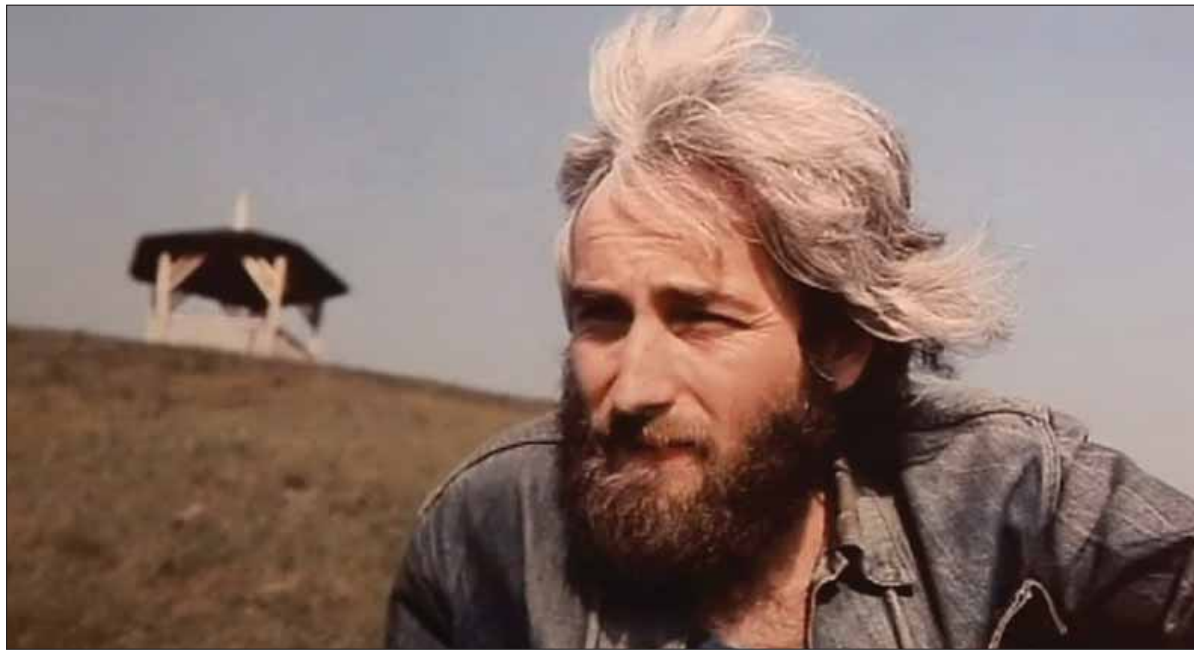
Hudobník, spevák a dokumentarista Dežo URSINY nielenže si získal svoju generáciu, ale podnetne ovplyvnil aj ďalšie, a stále má čo muzikantsky povedať i súčasníkom.

Hudobný novátor, ktorý uvzato išiel svojou cestou, ale vedel zložiť aj nápadité piesne s ambíciami hitu. Absolvent VŠMU, ktorý sa v priebehu filmárskej kariéry blýskol niekoľkými dokumentárnymi a krátkometrážnymi filmami. V prvom rade však skladateľ, muzikant a spevák, ktorý od šesťdesiatych rokov permanentne dával slovenskej rockovej hudbe stále nové a nové impulzy – Dežo URSINY.