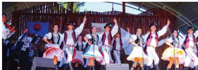
Temperamentné tance zo Zemplína boli ozdobou 34. Podvihorlatských folklórnych slávností v obci Porube pod Vihorlatom, ktorú aj tentoraz vzorne reprezentoval súbor Porubjan.

Pri MO MS pracuje FS Porubjan a detský folklórny súbor Lupienok, ktorých programy vychádzajú z tradičného folklóru a čo najvernejšie