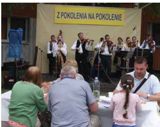
Tak ako v mnohých obciach na juhu Slovenska aj v Diakovciach po tieto dni spomínali na návrat predkov do vlasti pred sedemdesiatimi rokmi.

„Rok 1947 bol pre Slovákov žijúcich na Dolnej zemi v Maďarsku veľmi ťažkým a dôležitým obdobím. Vaši starí a prastarí rodičia museli totiž urobiť zásadné životné rozhodnutie – zostať alebo opustiť kraj, kde sa narodili, žili, vychovali deti. Rozhodli sa opustiť všetko, domovy, hroby svojich predkov a odišli do rodnej vlasti svojich predkov na Slovensko. Bol to