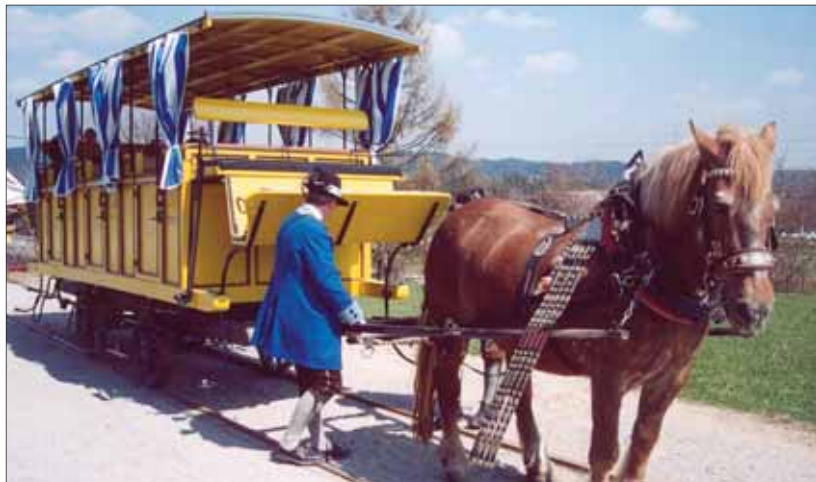
Železniční nadšenci pripomínajú dejiny koľajovej dopravy aj takými unikátmi.

Bežný pracovný deň. Poslanci zastupiteľstva v Mestskej časti Bratislava-Rača riešia nadmerný hluk, ktorý spôsobuje železnica v lokalite Východné. Odborníci merajú decibely, novinári sa občas zastavia, železnica reaguje. To je však iba jedna z mnohých starostí obyvateľov v tesnej blízkosti významného nákladného železničného uzla.