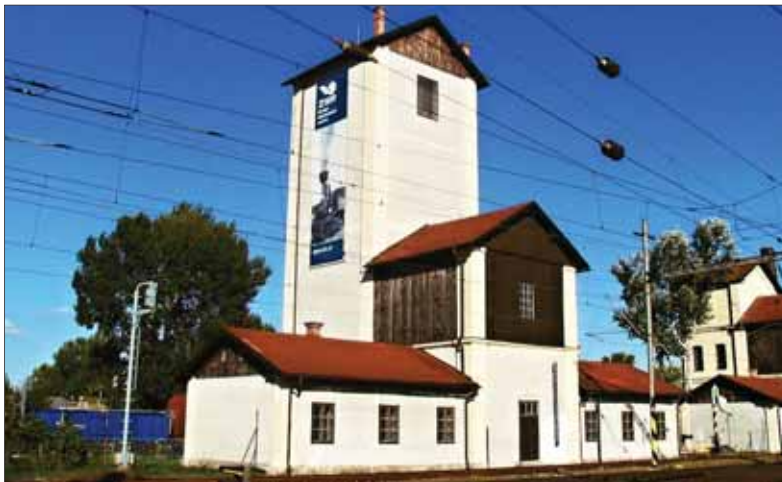
Rendez bol do roku 1946 súčasťou terajšej bratislavskej Mestskej časti Rača.